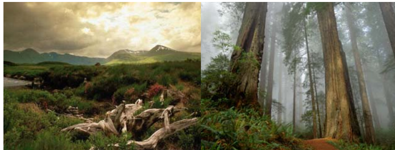
Gambar 3.4 Gambar Hutan 2