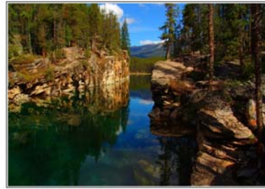
Gambar 3.9 Gambar suasana siang hari 2