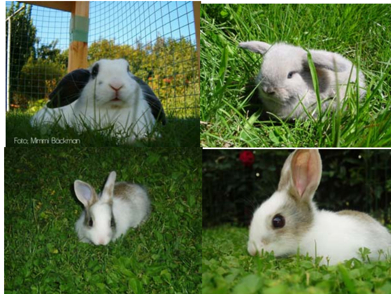
Gambar 3.14 Gambar Kelinci