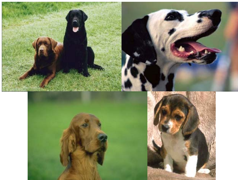
Gambar 3.22 Gambar Anjing

Linlin : Suka menyombongkan diri, suka menghina.