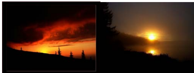
Gambar 3.3 Gambar suasana sore hari 1