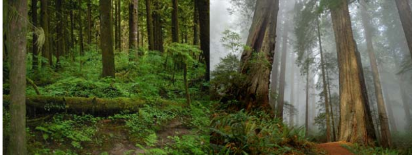
Gambar 3.1 Gambar Hutan1