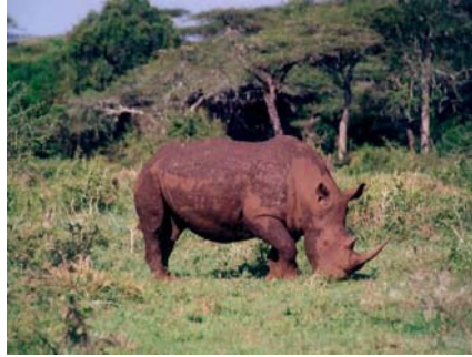
Gambar 3.21 Gambar Badak