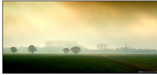
Gambar 3.11 Gambar Suasana pagi hari 2