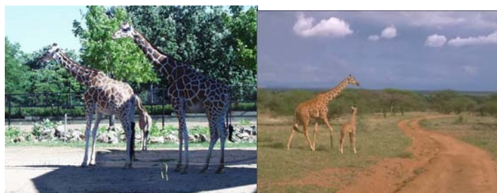
Gambar 3.17 Gambar ibu jerapah dan anaknya

Para Harimau :Jahat, angkuh, suka menghalalkan segala cara untuk mencapai keinginannya, malas.