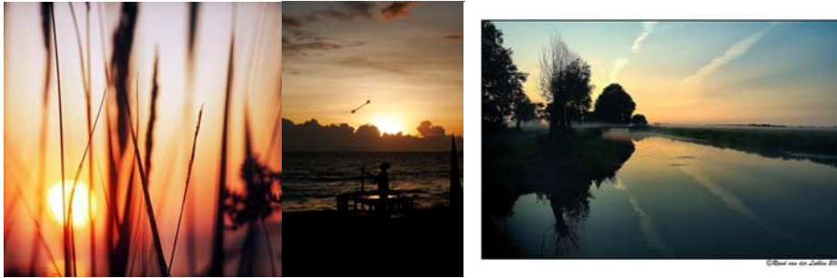
Gambar 3.5 Gambar suasana sore hari 2