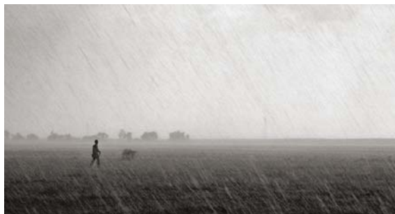
Gambar 3.7 Gambar suasana hujan deras