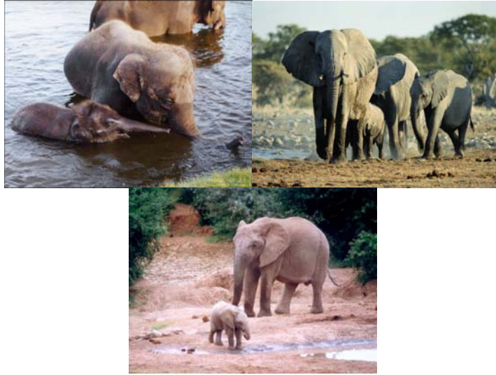
Gambar 3.18 Gambar gajah dan anaknya