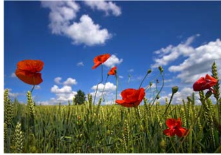
Gambar 3.8 Gambar lapangan rumput dengan taman bunga