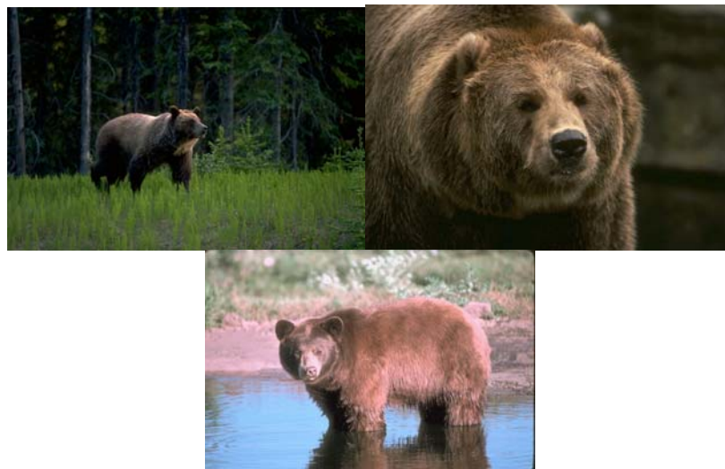
Gambar 3.13 Gambar Beruang