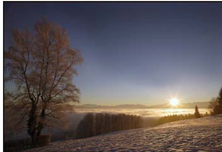
Gambar 3.2 Gambar Suasana Pagi Hari 1