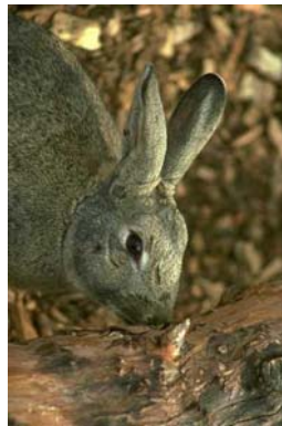
Foto 3.19 Gambar kelinci dekat sarangnya