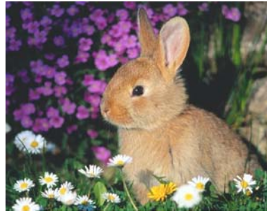
Gambar 3.23 Gambar kelinci