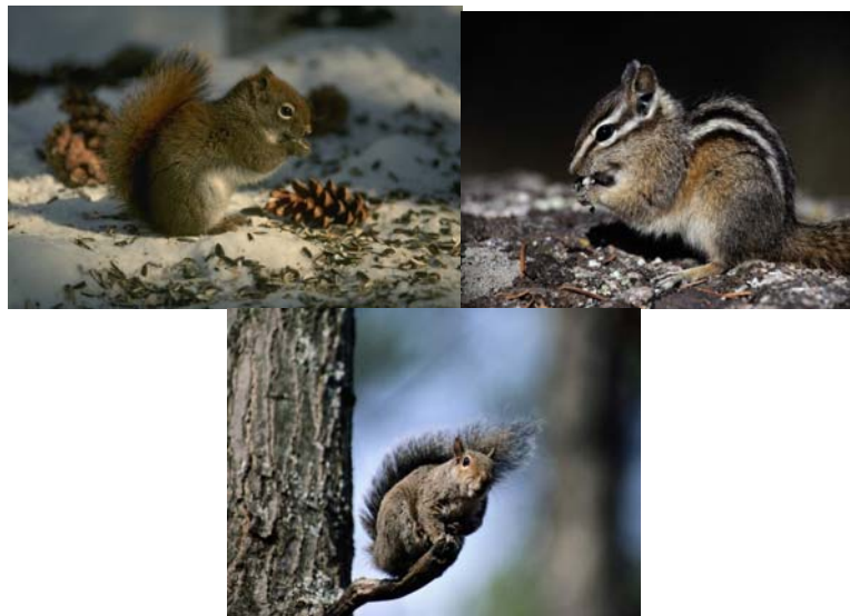
Gambar 3.15 Gambar Tupai