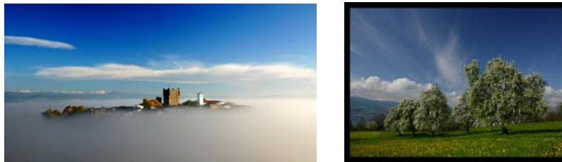
Gambar 3.6 Gambar suasana siang hari 1