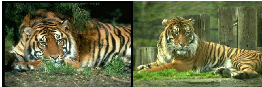
Gambar 3.20 Gambar Harimau