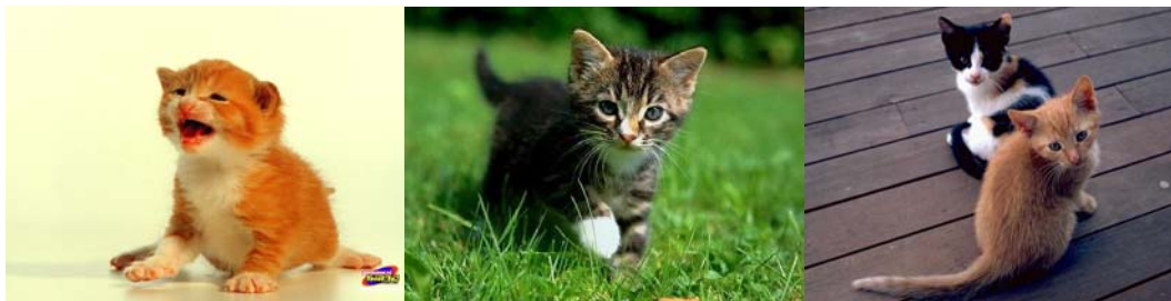
Gambar 3.24 Gambar Kucing