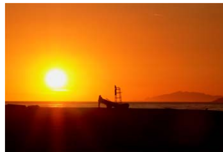
Gambar 3.10 Gambar Suasana Sore hari 3