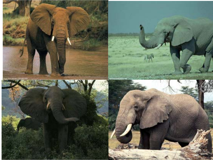
Gambar 3.16 Gambar Gajah