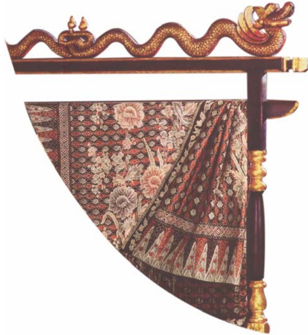
Gambar 1.2. Gawangan

Peraturan tersebut digunakan tidak hanya oleh Kasunanan Surakarta, tetapi juga digunakan pula oleh Kasultanan Yogyakarta, walaupun ada beberapa motif yang berbeda. Seperti diketahui bahwa Kasultanan Yogyakarta dan Kasunanan Surakarta merupakan kerajaan serumpun, yang dulunya berasal dari satu kerajaan, yaitu kerajaan Mataram. Karena adanya hal itu, maka dalam mendirikan keraton Yogyakarta Pangeran Mangkubumi atau Sultan Hamengkubuwana I menggunakan konsep-konsep yang tidak jauh berbeda dengan konsep-konsep pendirian keraton Surakarta. Konsep-konsep yang mirip satu sama lain itu juga terlihat dalam seni batik tradisional Yogyakarta maupun batik tradisional Surakarta. Hal tersebut dapat dimengerti, karena batik tradisional Yogyakarta merupakan lanjutan yang tidak terlepas dari mata rantai batik tradisional Mataram Baru. Walaupun demikian, karena pengaruh lingkungan dan kondisi kehidupan masyarakat, akhirnya terjadi beberapa perbedaan yang tidak terlalu prinsipil. Justru dengan adanya perbedaan tersebut masing-masing daerah memiliki karakteristik batik tradisional sendiri-sendiri. Sebagai contoh perbedaan tersebut adalah perbedaan warna putih pada batik tradisional batik Yogyakarta adalah