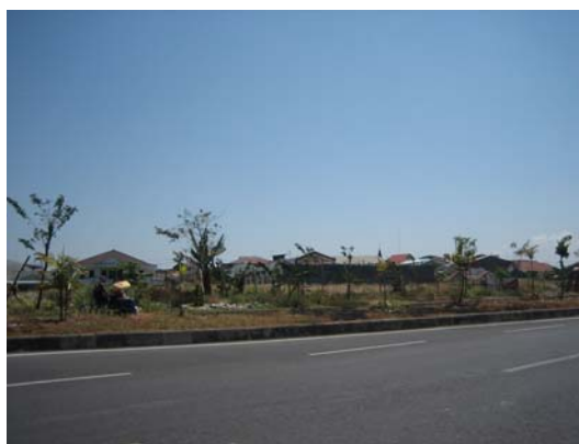
Gambar 2.2 Perumahan Kalijudan di sebelah selatan site