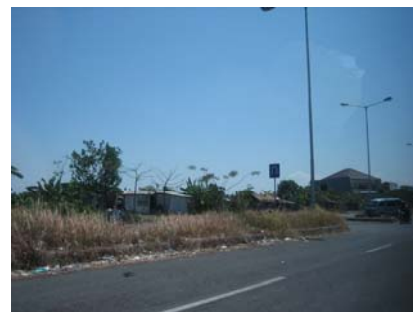
Gambar 2.1. Lahan kosong didepan site