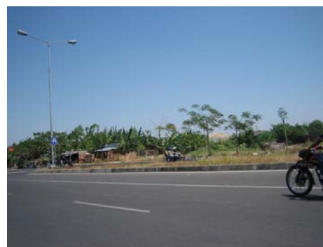
Gambar 2.3 Kondisi site sekarang