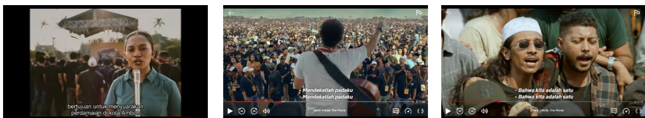
Gambar 4.4 Adegan Konser Perdamaian Terbesar di Kota Ambon, Kepulauan Maluku