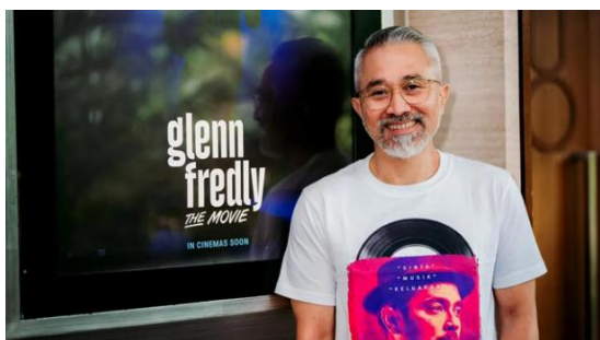
Gambar 4.1 Lukman Sardi Sebagai Sutradara Pada Film Glenn Fredly The Movie