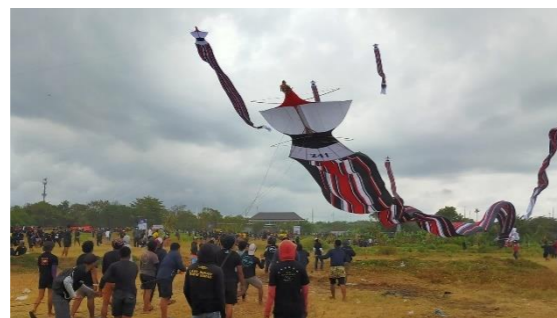
Gambar 1. 1 Tradisi Melayangan di Bali

Layang-layang di Bali bukan sekadar sebuah permainan tradisional; melainkan sebuah manifestasi nilai historis dan spiritual yang melekat erat pada budaya masyarakat Bali. Dalam tradisi melayangan, masyarakat Bali tidak hanya menerbangkan layangan sebagai hiburan, tetapi juga sebagai bentuk komunikasi simbolis dengan alam dan para dewa (Anggaraditya, 2017, p. 3). Kata “layang” yang berarti “surat” mengandung makna spiritual, di mana layangan menjadi simbol pesan yang diterbangkan ke langit sebagai wujud syukur masyarakat kepada Dewa Rare Angon, perwujudan Dewa Siwa, atas keberhasilan hasil panen mereka (Anggaraditya, 2017, p. 3). Hubungan yang kuat antara layangan dengan kegiatan bertani menjadikan tradisi ini sebagai salah satu elemen penting dalam budaya Bali.