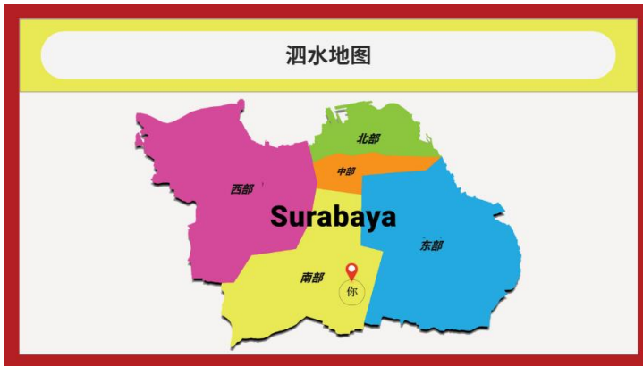
图 4.4 泗水地图

本地图的主要目的是让新生了解从学校到泗水西部确实有一定的距离。为了便于读者理解，笔者特意选择了简洁的地图图像，旨在清晰地展示整个泗水市的区域，同时为中国新生提供一个轻松易懂的概览。