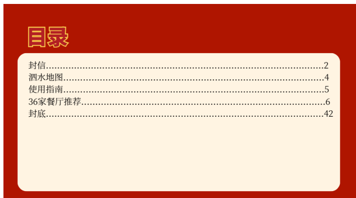
图 4.3 目录

笔者整理了简单的目录结构为了方便读者可以一目了然地了解本电子指南的整体结构与内容安排。一共为五个主要部分包括：封信、泗水地图、使用指南、36 家餐厅推荐以及封底。