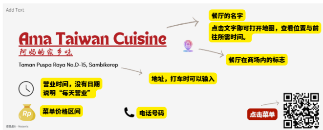
图 4.5 使用指导

笔者对电子指南的内容进行了简要介绍，向读者展示将看到哪些部分。例如，餐厅名称和二维码可以点击，直接引导读者进入相关页面。这样，读者不仅能阅读内容，还能无需手动搜索，直接查看餐厅的详细信息。在使用指导部分，笔者使用了白色作为页面的背景颜色。对于每个所使用元素的说明，笔者使用了黄色，以便能够立刻吸引读者的注意力，并提高文字的清晰度。