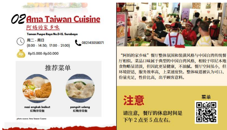
图 4.6 电子指南内容

在内容部分，笔者以餐厅名称作为开头。点击餐厅名称时，读者将被引导至 Google Map ，以帮助他们了解从当前位置到餐厅的距离。 Google Map 中也附有各种资讯，例如营业时间、顾客拍摄的餐厅照片、最新评论以及菜单照片（如有）。在价格区间部分，笔者主要参考 GoFood 应用程序中提供的价格信息；若 Google 上有显示，则也会参考；若无，笔者通过查看菜单上的定价自行进行分析。本电子指南的内容还包括来自受访者数据的简要评论。至于“推荐菜单”部分，笔者依据受访者所提供的推荐菜品进行整理。最后，笔者也添加了 Instagram 账号与电子菜单的二维码。此二维码既可扫描，也可直接点击，以便引导读者前往相关页面。