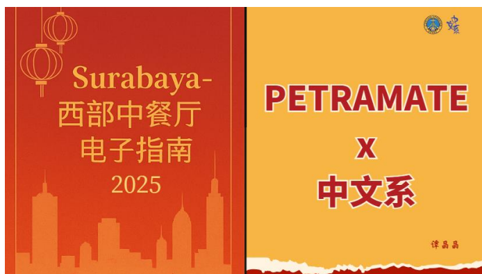
图 4.1 封面

电子指南的封面使用了以红色和黄色为主的配色方案。这种颜色的选择不仅旨在吸引视觉注意力，还旨在与作为主要使用对象的中国学生建立情感上的联系。在封面的左侧，笔者清楚地标示了电子指南的标题；而在右侧，则注明了中文系与 Petramate 之间的合作，作为对双方在设计过程中参与程度的认可。因此，封面设计不仅具有美学功能，同时也具有象征意义。希望封面页面能够带给中国学生积极的第一印象，激发他们的好奇心，并营造一种归属感和联系感。