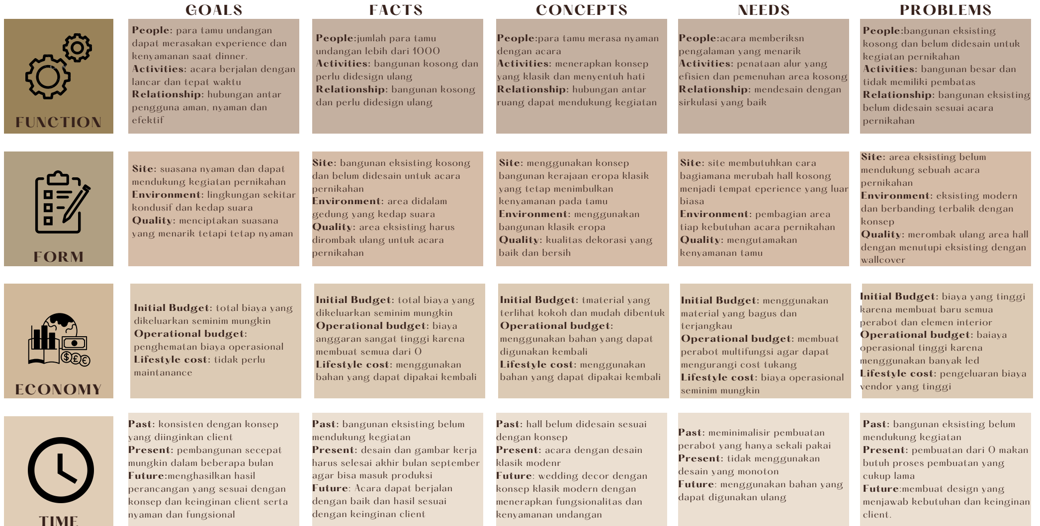
I Tabel 2. Framework I