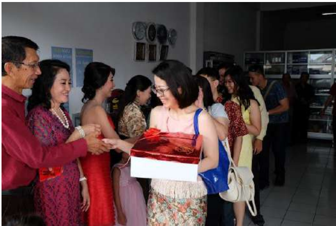
Gambar 2.8 Pemberian Angpao kepada Pembawa Seserahan atau Baki

Pada akhir prosesi, wakil keluarga wanita akan memberikan angpao kepada setiap pembawa seserahan. Hal ini dilakukan karena adanya anggapan bahwa hal ini agar pemberi seserahan akan enteng jodoh, namun ada juga yang beranggapan angpao sebagai ucapan terima kasih karena telah bersedia membantu.