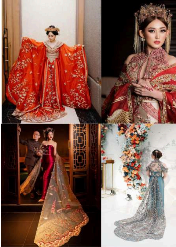
Gambar 2.25 Koleksi Alethea Sposa