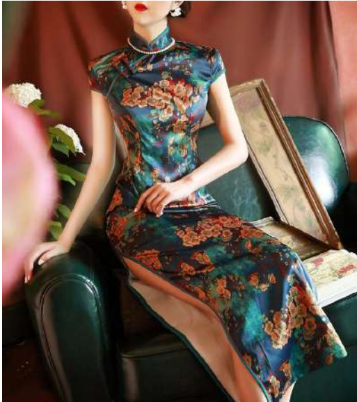
Gambar 2.10 Cheongsam dengan Belahan Tinggi