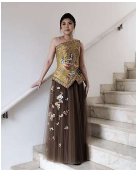
Gambar 2.12 Cheongsam Two Pieces

https://www.kompasiana.com/priatiningsih/6394087d0d6a9d4ab36ddb12/inspirasi-cheongsam-modern-gaya-santai