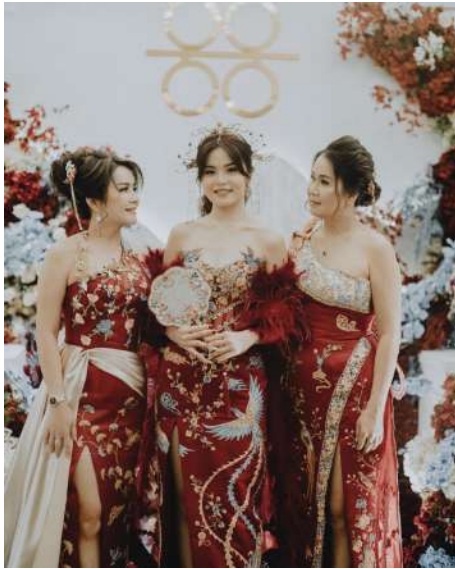
Gambar 2.13 Evening dan Bridal Cheongsam