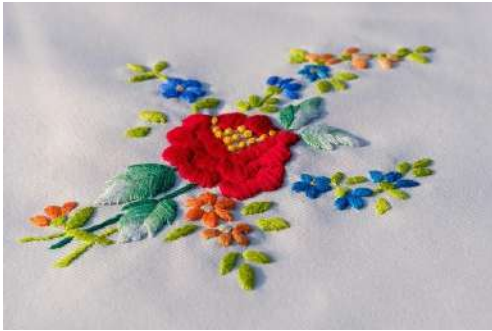
Gambar 2.18 Contoh Bordir Datar