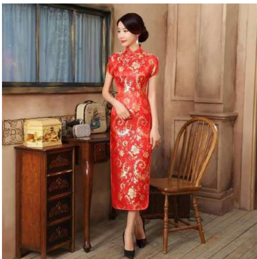
Gambar 2.9 Cheongsam Memendek Pertengahan Betis