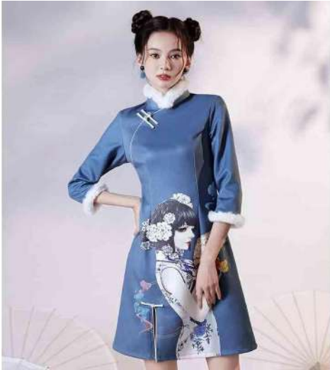
Gambar 2.11 Cheongsam dengan Motif Seni Pop