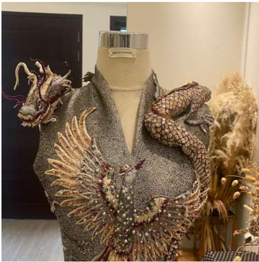
Gambar 2.19 Contoh Bordir Timbul (3D)