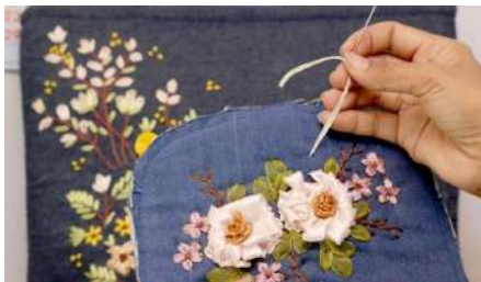
Gambar 2.17 Bordir dengan Teknik Bordir Pita

Menggunakan pita dengan bahan dan ukuran tertentu dan hanya digunakan untuk membuat motif-motif bunga. Pita memberikan efek 3D karena ukurannya lebih besar dan hasil yang diberikan akan lebih dekoratif karena bahan pita lebih beragam.