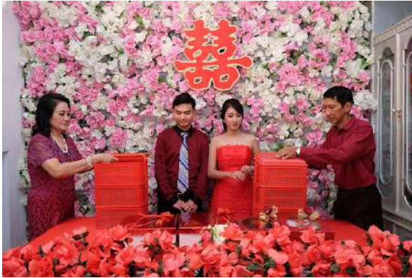
Gambar 2.7 Pengembalian Seserahan dan Seserahan Balasan