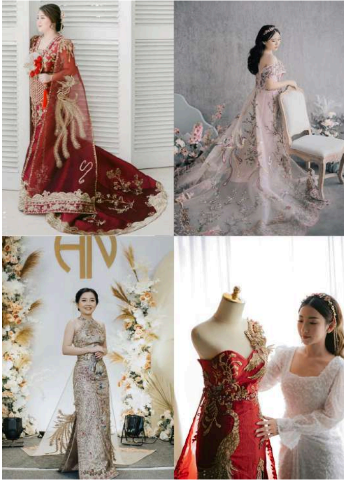
Gambar 2.26 Koleksi House of Lea