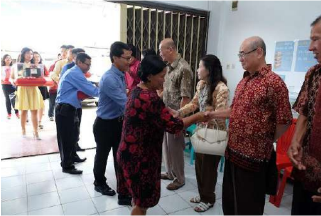
Gambar 2.4 Penyambutan Pembawa Seserahan atau Baki

Sumber: Bayu, & Ricca. (2017, May 21). Sangjit: Seserahan Tradisi Tionghoa (Pre-wedding Ceremony In Chinese Tradition: Byric-Kurniawan.