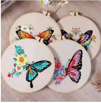
Gambar 2.14 Bordir dengan Teknik Bordir Tangan