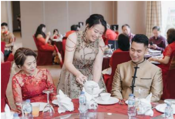
Gambar 2.6 Ramah Tamah dan Makan Bersama pada Tradisi Seserahan atau Sangjit

Prosesi ini akan dilanjutkan dengan sedikit pembukaan dari orang tua calon mempelai wanita, dan dilanjutkan dengan ramah tamah. Pada tahap ini, beberapa seserahan akan dibawa ke kamar atau tempat lain untuk diambil sebagian isinya. Sebagian isi dari seserahan diambil ini memiliki alasan karena jika isi seserahan diambil seluruhnya, berarti keluarga wanita menyerahkan calon pengantin wanita seluruhnya kepada calon pengantin pria dan memutuskan hubungan keluarga dengan calon pengantin wanita.