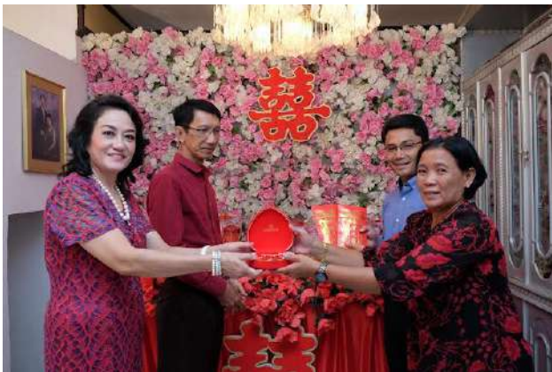
Gambar 2.5 Penerimaan Seserahan Tradisi Seserahan atau Sangjit

Seserahan diberikan satu per satu secara berurutan yang telah ditentukan dari awal. Barang seserahan yang telah diterima oleh pihak mempelai wanita akan langsung dibawa ke meja yang akan dijadikan tempat sementara untuk dipamerkan kepada kedua belah pihak keluarga.