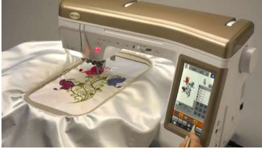
Gambar 2.15 Bordir dengan Teknik Bordir Mesin