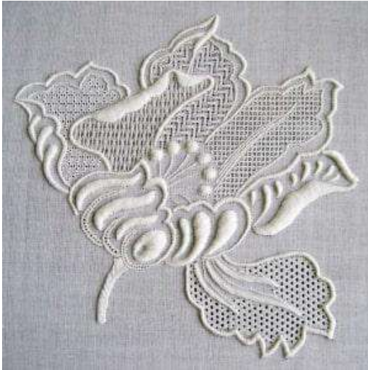
Gambar 2.20 Contoh Bordir Terawang