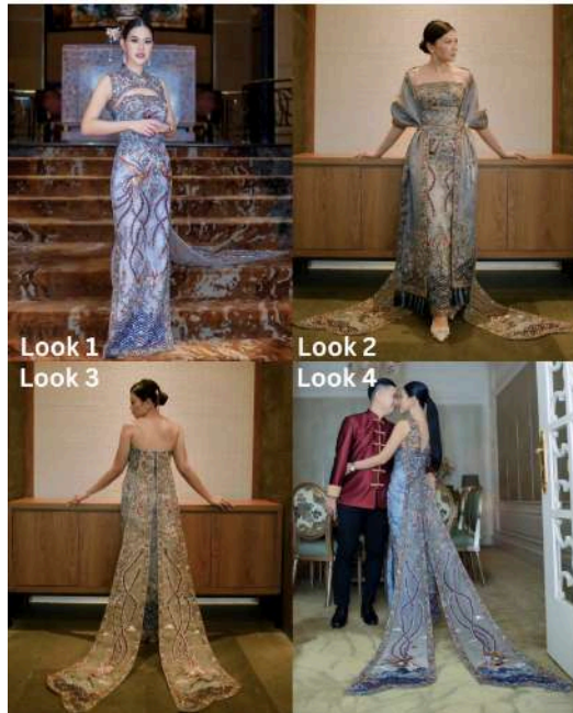
Gambar 2.21 Contoh Multilook Cheongsam