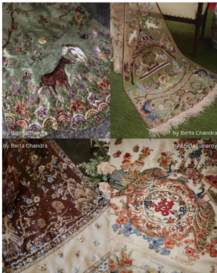
Gambar 2.22 Contoh Custom Bordir pada Cheongsam