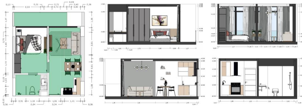
Gambar 5.9.2. Layout tipe 1 bedroom dalam apartemen vertu

Apartemen tipe 1 bedroom memenuhi persyaratan Standar PUPR nomor 14 tahun 2017 sehingga lebih cocok digunakan oleh penyandang disabilitas tuna daksa