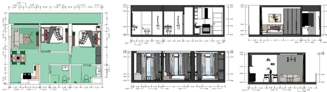
Gambar 5.9.3 Layout tipe 2 bedroom dalam apartemen vertu

Apartemen tipe 2 bedroom memenuhi persyaratan Standar PUPR nomor 14 tahun 2017 sehingga lebih cocok digunakan oleh penyandang disabilitas tuna daksa