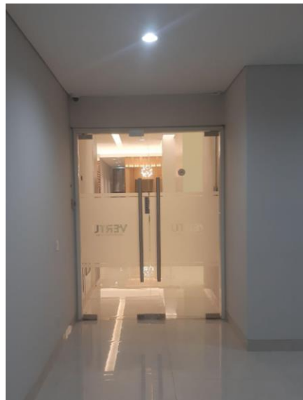
Gambar 5.10.1 Pintu Masuk dari Mall Ciputra menuju Apartemen Vertu