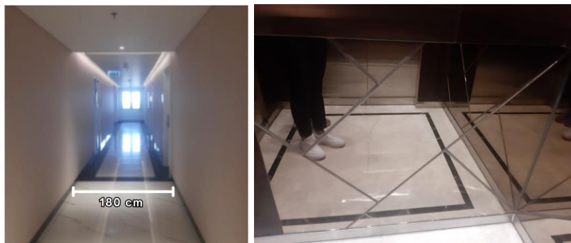
Gambar 5.10.4 Koridor (Kiri) dan Lift (Kanan)