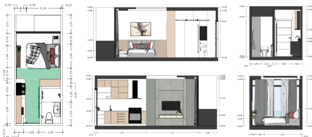
Gambar 5.9.1 Layout tipe studio dalam apartemen vertu

Apartemen tipe studio belum memenuhi persyaratan Standar PUPR nomor 14 tahun 2017 sehingga kurang cocok digunakan oleh penyandang disabilitas tuna daksa