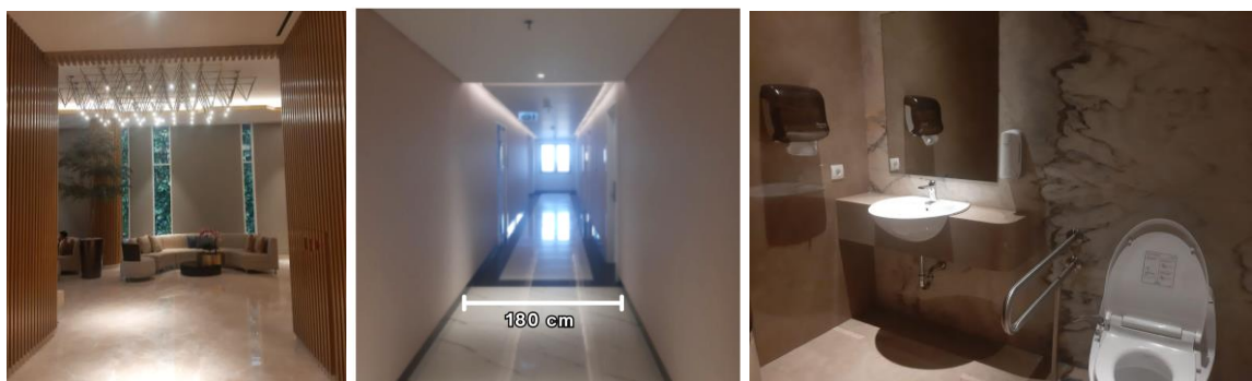
Gambar 5.10.2 Koridor Lobby (Kiri), Koridor Lantai 8 (Tengah), Toilet Disabilitas (Kanan)