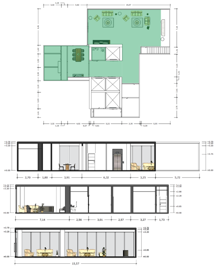
Gambar 5.9.4 Layout dan Potongan Lantai Ground