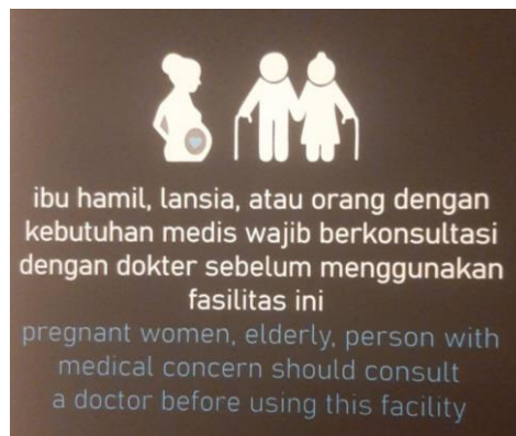
Gambar 5.10.3 Peraturan pada Penggunaan Fasilitas Kolam Renang