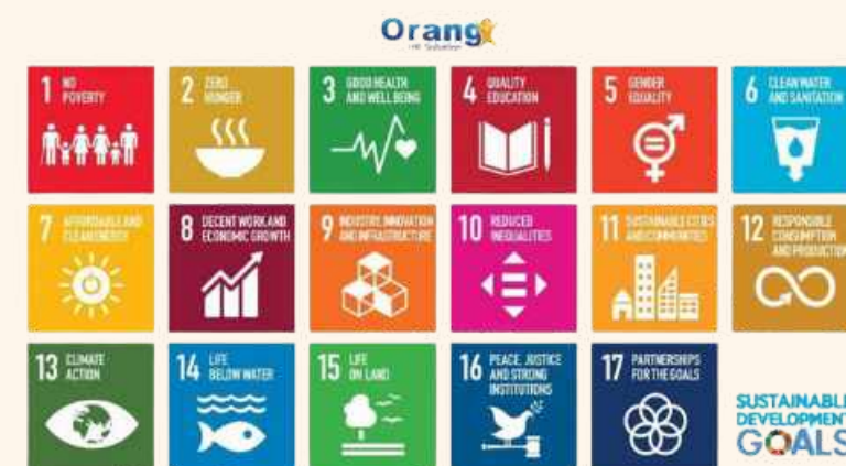
Gambar .17 Sustainable Developments Goals Sumber: myorangehr, 2023

Perancangan produk interior cultural sustainability akan mengangkat SDGs nomor sebelas yaitu sustainable cities and communities (kota dan permukiman yang berkelanjutan termasuk warisan budaya dan alam). Pada perancangan ini mengambil SDGs ke 11 artinya melestarikan warisan kebudayaan, khususnya di Bangkalan Madura. Sanjoyo, Kepala Sekretariat Nasional SDGs, pada rapat pleno Komisi nasional Indonesia untuk UNESCO 2023, menyatakan bahwa SDG 11 menjadi salah satu highlight yang perlu diperhatikan, karena jumlah wisata musiman menurun sebanyak 1,5 juta orang. Ini dapat dijadikan poin penting untuk kontribusi perancangan ini untuk membantu menyelesaikan solusi SDGs tersebut.