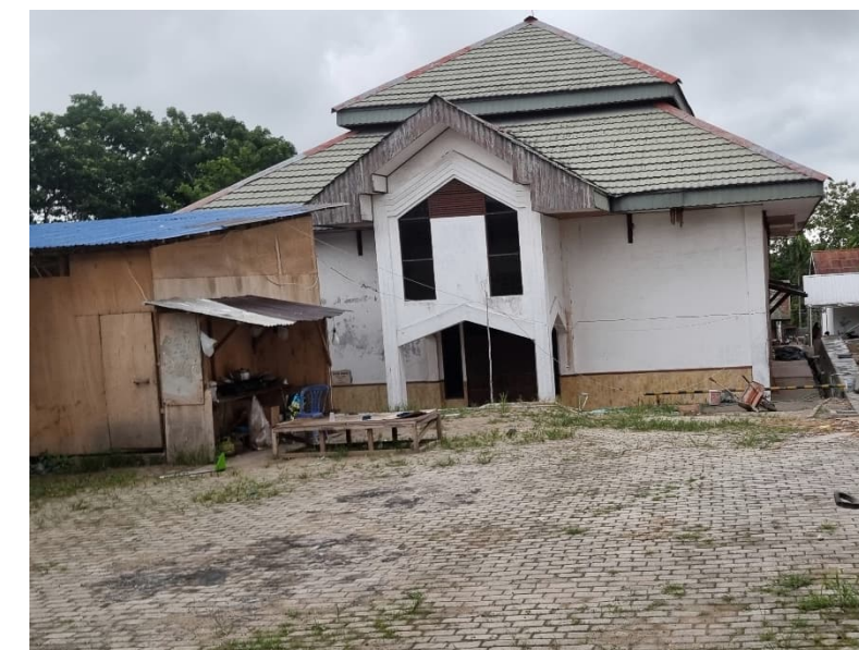
Gambar 1.2. Kondisi Wisma Sikhar, Rumah Retret di Banjarbaru

Rumah Retret ini direncanakan sebagai pembaruan untuk Wisma Sikhar, yang merupakan Rumah Retret tua di Keuskupan Banjarmasin, didasari oleh kebutuhan mendalam untuk mempertahankan nilai-nilai spiritual dan sejarah, sambil memperbaiki fasilitas untuk memenuhi kebutuhan dan harapan masa kini. Wisma Sikhar, sebagai pusat retreat dan spiritualitas yang telah melayani umat Katolik dan masyarakat sekitarnya selama bertahun-tahun, telah menjadi tempat berharga untuk pertumbuhan iman dan ketenangan batin. Walau Wisma Sikhar telah menjadi rumah retreat bagi umat Katolik di Keuskupan Banjarmasin begitu lamanya, tetapi bentuk bangunan yang kurang terdesain dan lokasinya yang tidak strategi membuatnya kurang relevan dengan kebutuhan Umat terutama umat-umat Katolik muda yang bertumbuh bersama dengan perkembangan jaman. Maka dari itu, diperlukan Rumah Retret baru yang dapat memberikan pengalaman dan fasilitas rohani yang mengikuti perkembangan zaman.