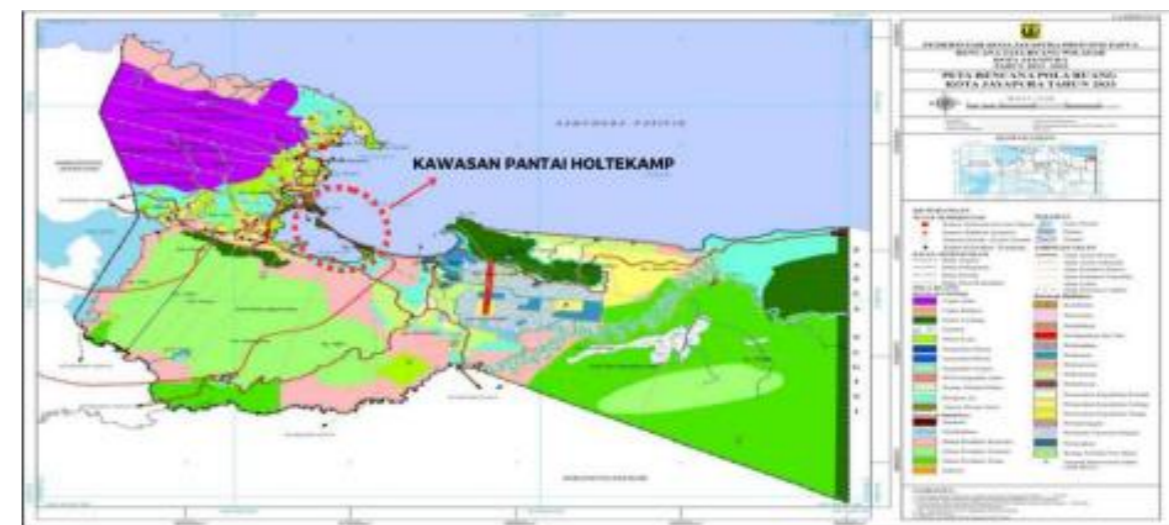
Gambar 1.2 Peta Penetapan Pola Ruang Kota Jayapura