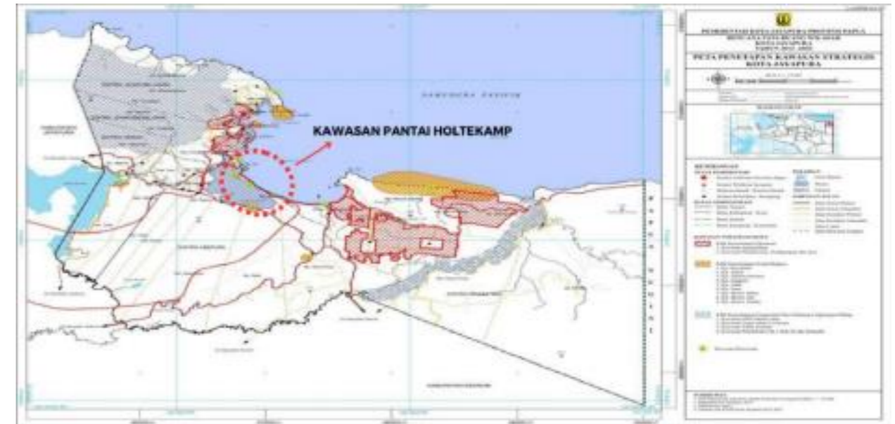
Gambar 1.1 Peta Penetapan Kawasan Strategis Kota Jayapura