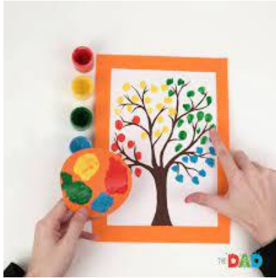
3.1 Media Finger Painting