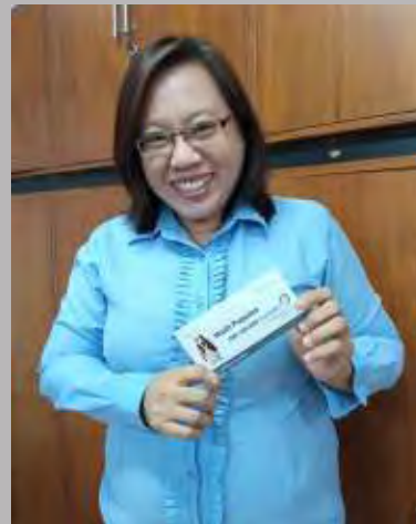
Ester Lany Unit Perbekalan