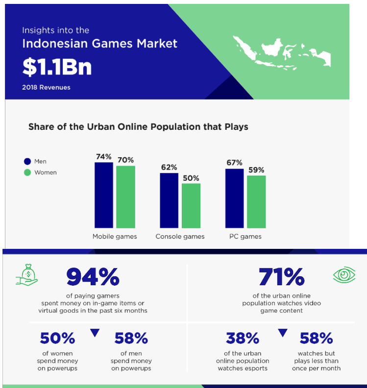
Gambar 1. 2 Indonesian Games Market