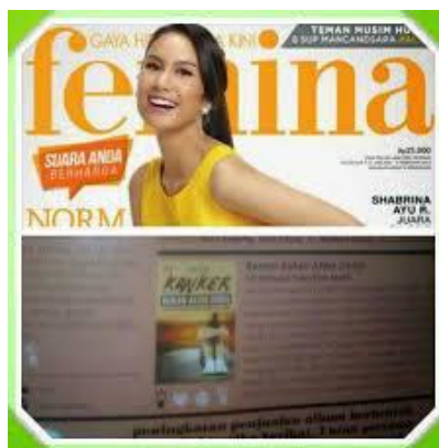
Gambar 2.5 .Foto Buku “Kanker Bukan Akhir Dunia” dalam rubrik ulasan Majalah “Femina”

https://4.bp.blogspot.com/-AtOvtfEI6YQ/VxgCfWoiVZI/AAAAAAAAAD-E/7LiuzRfFb2sRJqTVA5kZ0i0NVdY8ll7ogCLcB/s1600/buku%2Bkanker%2B3.JPG