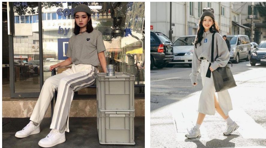
Gambar 2.7. Casual style & chic style

Berdasarkan hasil wawancara dengan beberapa target audiens, kebanyakan dari mereka menyukai gaya casual dan chic seperti dibawah ini. Style desain yang mereka sukai sesuai dengan kepribadian mereka yang praktis, simpel dan tidak suka ribet.