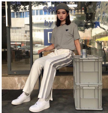
Gambar 2.1. Casual style

Orang yang memakai casual style biasanya memiliki kepribadian yang santai, praktis, tidak suka dengan hal yang ribet, gesit. Mereka suka menggunakan outfit yang simpel dan tidak terlalu rame. Mereka suka apa adanya dalam berpenampilan (Thalia, 2009).