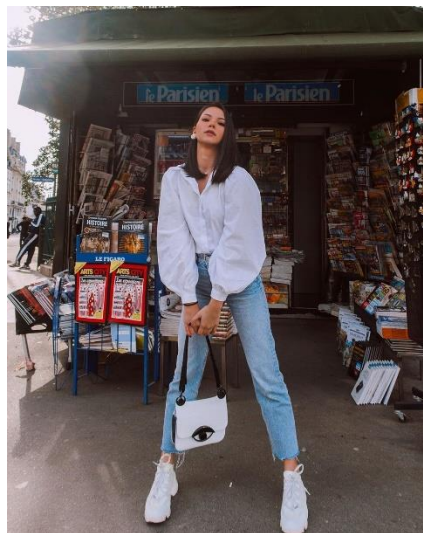
Gambar 2.3. Classic style

Orang yang menggunakan classic style biasanya menggambarkan kepribadian yang rapi, smart , elegan dan perfeksionis dalam berpenampilan (Thalia, 2009).