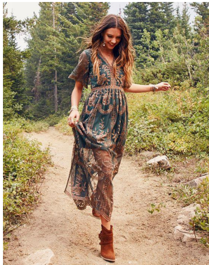
Gambar 2.4. Bohemian style

Biasanya orang yang menggunakan bohemian style adalah orang yang mencintai seni dan memiliki kebebasan berekspresi dalam berpenampilan (Thalia, 2009).