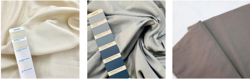
Gambar 2.11. Euca Canvas, Moco Spandex, Lyco Poplin