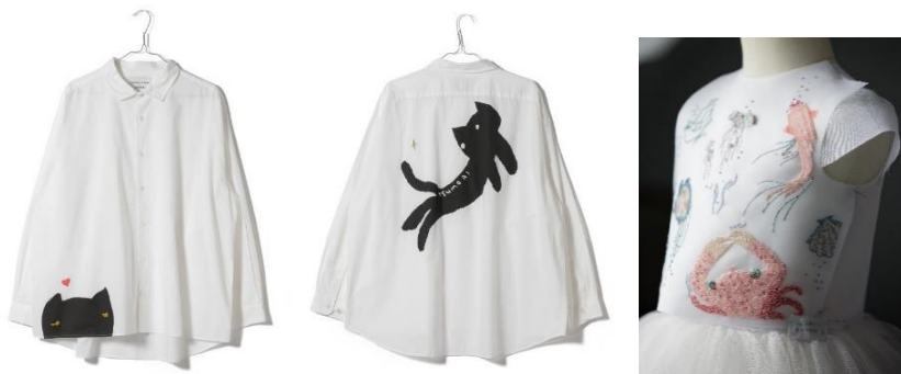
Gambar 2.10. Referensi desain tiga