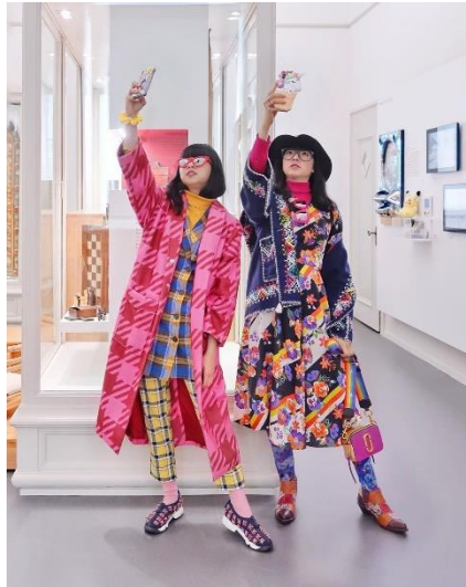
Gambar 2.5. Artsy style