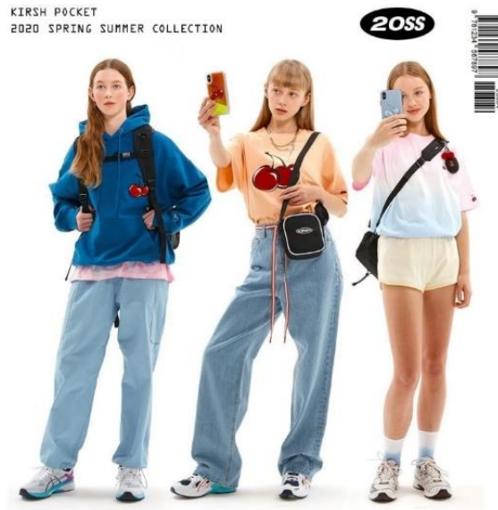
Gambar 2.8. Referensi desain satu