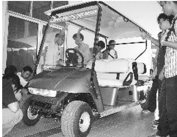
Gambar 2.1. Mobil Listrik Buatan LIPI

hingga delapan jam. Sistem penggerak yang diterapkan pada Marlip telah dipaten atas nama Masrah, penemunya. Motor listrik yang digunakan pada mobil listrik itu jenisnya sangat bervariasi dan sangat tergantung pada desain sistem penggerakannya. Bila ditinjau dari daftar paten, hasil penemuan sistem penggerak mobil listrik di dunia berkisar 230 jenis. Dengan muatan 6-8 penumpang, kendaraan ini dapat melaju pada kecepatan 40 km per jam. Saat ini LIPI berhasil membuat tiga prototipe Marlip yang dioperasikan di Kebun Raya Bogor. Prototype mobil listrik yang memiliki kandungan lokal hingga 70 persen itu, awal Mei lalu, dipamerkan dalam Ritech 2003 , yang diselenggarakan Kementerian Riset dan Teknologi di Jakarta. Meski fungsinya berjalan dengan baik, menurut Kepala LIPI Prof Dr Umar A Jenie, Marlip akan menjalani penyempurnaan sepanjang tahun ini. Penyempurnaan ditujukan pada tiga bagian utamanya; sistem kendaraan, sistem energi, dan sistem penggerak. Dengan kisaran harga sekitar Rp 40 juta-Rp 60 juta memang masih cukup mahal untuk saat ini. Tapi bila dilihat dari kemudahan perawatan dan emisi buangnya nol, yang berarti tanpa polusi, bisa jadi Marlip akan menjadi pilihan masyarakat.