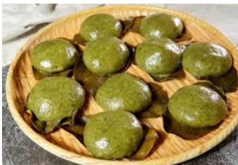
图片 2.2 : 艾粄