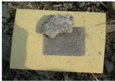
图片 2.1：用小石子或土块压住银纸

扫墓也是清明节重要的活动。首先将长在墓园的杂草割除掉，清扫坟墓。打扫后，把祭祀品准备好，放在祭坛上 5 。准备后，在坟身周围摆放十二张冥纸，并用小石子或土块压住银纸，传说是为祖先重屋(客语为整修房屋之意)，也是希望祖先庇佑子孙一年十二个月，月月吉祥顺利。