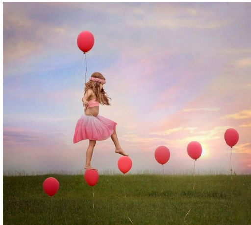
Gambar 2.9. Konseptual fotografi