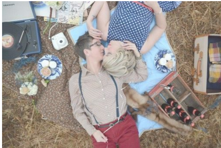
Gambar 2.11. Konseptual fotografi