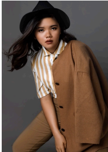
Gambar 2.7. Front Light

Sumber cahaya berasal dari bawah, dan digunakan sebagai pengisi saja ( Fill Light ). Dapat mengurangi kontras pada bayangan yang dihasilkan oleh cahaya utama ( Main Light ). Biasanya dapat dibantu dengan reflector atau Styrofoam berwarna putih.