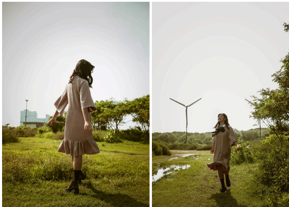
Gambar 2.3. Top Light

Sumber cahaya terletak jauh diatas posisi kamera dan kira kira tepat diatas obyek, menghasilkan efek yang lebih mendalam dengan adanya bayangan yang tajam.