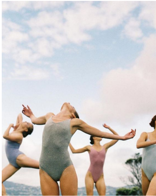
Gambar 2.10. Konseptual fotografi