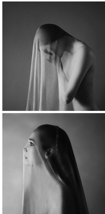
Gambar 2.13. Konseptual fotografi