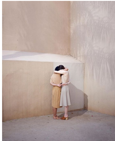
Gambar 2.8. Konseptual fotografi