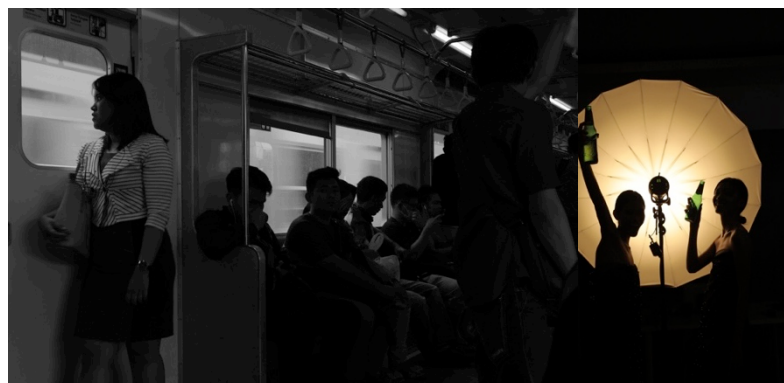
Gambar 2.6. Backlight

Sumber cahaya terletak di belakang obyek (berlawanan dengan kamera).