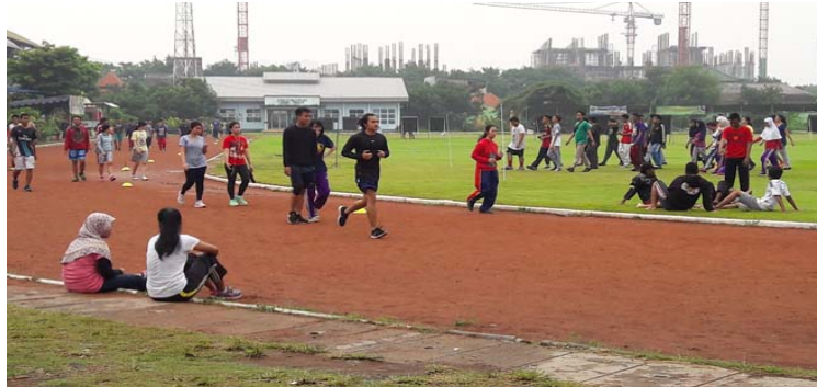
Gambar 2.16. Koni Lapangan Lari