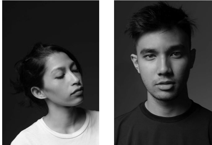
Gambar 2.4. dan 2.5 Side Light

Sumber cahaya terletak pada samping obyek, yang dapat menonjolkan efek tiga dimensi, bentuk, dan permukaan obyek foto.