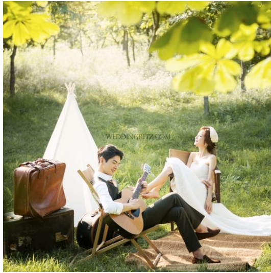
Gambar 2.12. Konseptual fotografi