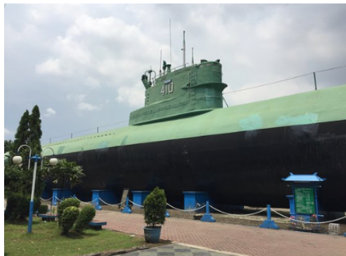
Gambar 2.15. Monumen Kapal Selam