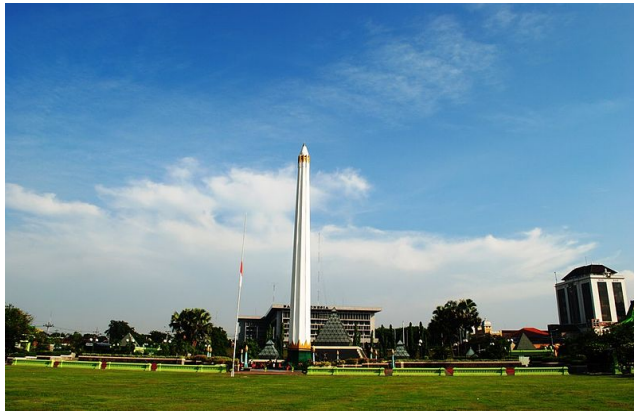
Gambar 2.14. Konseptual fotografi

Tugu pahlawan dibangun dalam bentuk "paku terbalik" dengan ketinggian 40,45 meter dengan diameter 3,10 meter dan di bagian bawah diameter 1,30 meter. Di bawah monumen dihiasi dengan ukiran "Trisula" bergambar, "Cakra", "Stamba" dan "Padma" sebagai simbol api perjuangan. Di dalam tugu ini, terdapat Museum 10 November. Museum Sepuluh Nopember dibangun untuk memperjelas keberadaan Tugu Pahlawan tersebut dan sebagai penyimpang bukti-bukti sejarah di 10 November 1945.