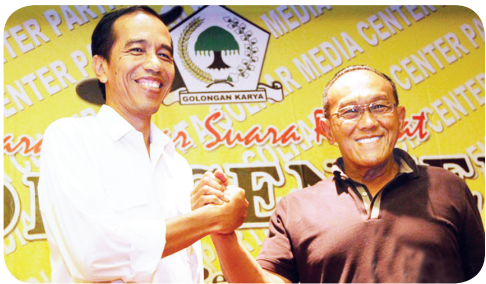
Jakarta, Harian Nusanantara- Bakal calon presiden, Joko Widodo, menegaskan tidak akan

berbicara soal bagi-bagi jatah kabinet dengan Partai Golkar, jika Golkar ingin bergabung bersama koalisi yang telah dibangun oleh PDI Perjuangan, Partai Nasdem, dan Partai Kebangkitan Bangsa. Jokowi juga tidak akan membahas kursi calon wakil presiden untuk partai tersebut.