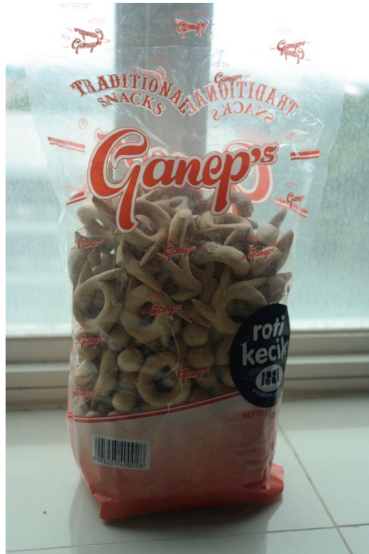
Gambar 1.6 Kemasan roti kecil kemasan 600 gr