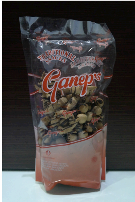
Gambar 1.3 Kemasan roti kecil ukuran 200 gr.