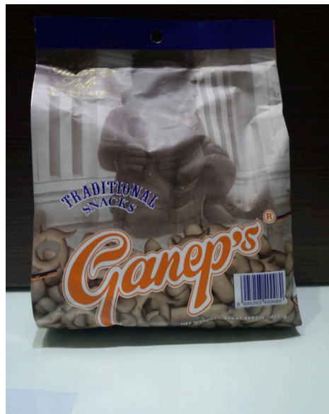
Gambar 1.4 Tampak depan kemasan roti kecil ukuran 400 gr

Dapat dilihat pada gambar 1.3 kemasan roti kecil dengan ukuran 200 gr ini menggunakan bahan plastic transparent berbentuk pillow pack dengan tampilan visual dominan berwarna orange, dengan logo perusahaan Ganep's, dan didesain secara Transparan.