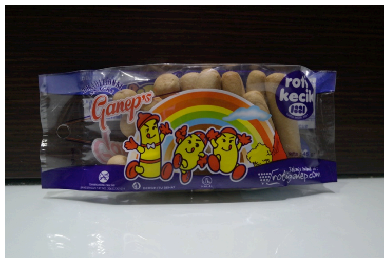
Gambar 1.1 Kemasan roti kecil ukuran 45 gr.

Berikut ini adalah beberapa kemasan roti kecil beserta dengan ukurannya