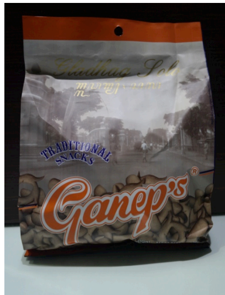
Gambar 1.5 Tampak belakang kemasan roti kecil kemasan 400 gr

Pada Gambar 1.4 dapat dilihat kemasan untuk roti kecil kemasan 400 gr, kemasan ini merupakan kemasan “premium”. Tujuan dari dibuatnya kemasan ini adalah dikhususkan untuk tujuan buah tangan atau oleh-oleh. Tampilan visual dari produk ini adalah dengan menggunakan salah satu icon kota Surakarta yaitu reco Gladhak, dengan logo perusahaan dan nama produk.