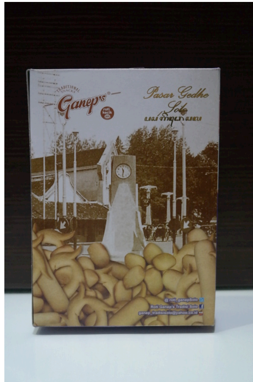
Gambar 1.8 Tampak belakang kemasan roti kecil “special”