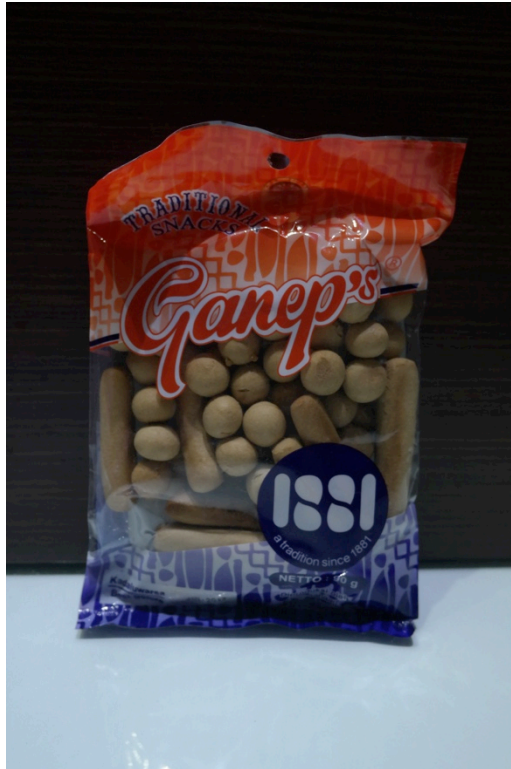
Gambar 1.2 Kemasan roti kecil ukuran 90 gr.

Pada Gambar 1.2 roti kecil ini dikemas dengan menggunakan kemasan plastic transparent berbentuk pillow pack dengan tampilan visual jenis dan nama produk pada bagian depan dan ditambahkan dengan motif batik yang sudah digunakan oleh perusahaan Ganep's yang telah digunakan selama 4 tahun terakhir oleh perusahaan Ganep's ini. Kemasan ini digunakan untuk roti kecil dengan ukuran 90 gr