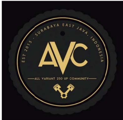
Gambar 4.1. Logo All Variant 250 UP Community

Dalam AVC 250 UP terdapat pengurus yang mempunyai tugas masing-masing yang berkaitan dengan kepentingan dalam komunitas. Kepengurusan yang ada dalam All Variant 250 UP Community adalah sebagai berikut: