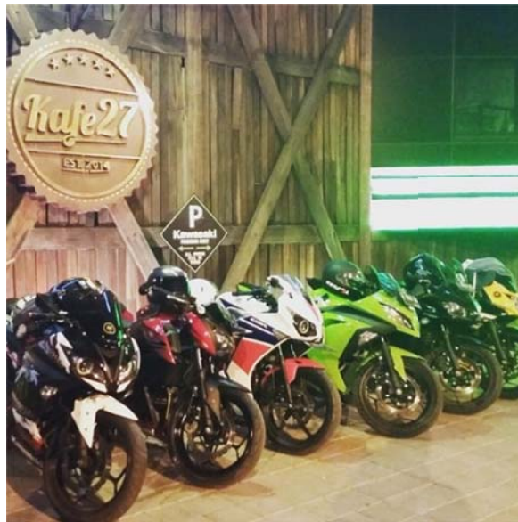
Gambar 4.3. Motor-motor AVC 250 UP dari berbagai merek

mencipta. Peneliti melihat bahwa kekreativitasan dalam komunitas ini berasal dari daya pikir para pendiri AVC 250 UP. Mereka mempunyai pikiran untuk membangun suatu komunitas yang berbeda dari komunitas-komunitas yang sudah ada. Para pendiri komunitas ini membangun komunitas yang sifatnya all variant atau segala merek dan jenis motor dapat bergabung dalam komunitas ini. Bila selama ini komunitas yang ada selalu berdasarkan merek atau jenis motor yang sama, bagi AVC 250 UP hal ini tidak berlaku karena dalam komunitas ini para anggotanya menggunakan motor dengan merek dan jenis yang berbeda-beda. Contohnya seperti Kawasaki Ninja Fi, Kawasaki Ninja Karburator, Yamaha YZF-R25, Honda CBR, Benelli, dan sebagainya.