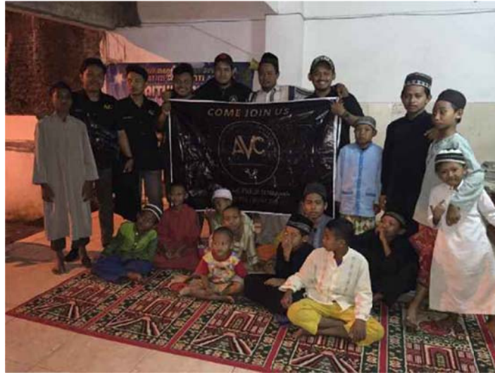
Gambar 4.2. AVC 250 UP melakukan kunjungan ke Panti Asuhan

Dalam perencanaan AVC 250 UP melakukan kunjungan ke panti asuhan terdapat proses komunikasi. Tahap pertama beberapa pengurus sebagai komunikator mengadakan rapat untuk mengadakan kegiatan sosial. Dalam rapat terdapat beberapa usulan untuk menjalankan kegiatan ini. Tahap kedua pengurus mempatenkan acara kunjungan ke panti asuhan sebagai kegiatan sosial mereka. Setelah itu memasuki tahap selanjutnya, pengurus dan anggota lain berkumpul dalam kopdar dan membicarakan bahwa kegiatan sosial yang akan dilakukan adalah kunjungan ke panti asuhan. Pesan yang disampaikan adalah pesan tanpa media. Para anggota yang mendengar pesan tersebut melakukan penyandian balik untuk memberikan tanggapan terhadap usulan tersebut.