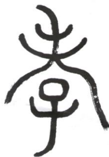
古汉字“孝”意味着对父母的孝