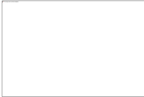
Gambar 3.1.2 Typeface yang akan digunakan dalam isi http://www.identifont.com/samples/microsoft/Consolas.gif

Isi akan menggunakan typeface sans serif consolas, dengan alternatif lainnya mencakup Georgia atau Bookman Old Style. Hal ini mempertimbang keterbacaan typeface karena volumenya yang cukup teks heavy.