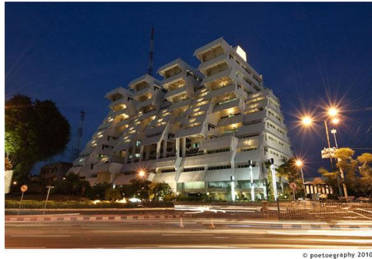
Gambar 3.1. Intiland Tower Surabaya