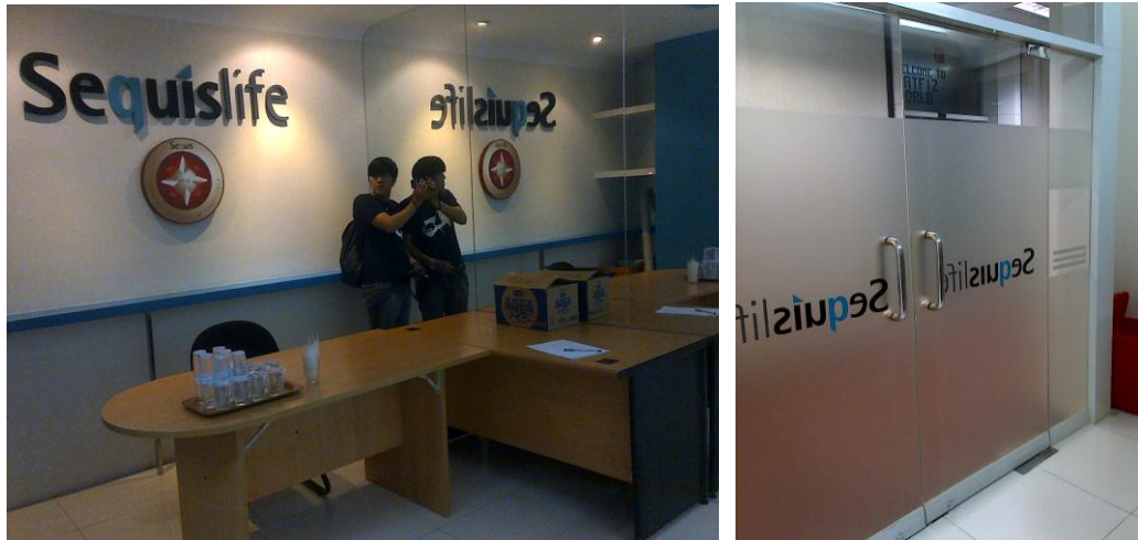
Gambar 3.8. Lobby & pintu masuk ruang pelatihan Sequislife di lantai 6