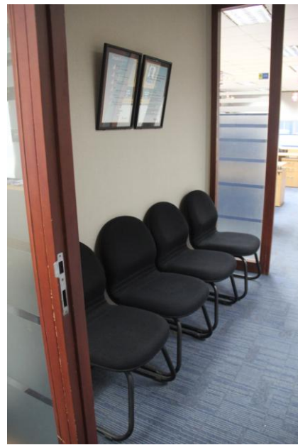
Gambar 3.6. Selat ruang kerja