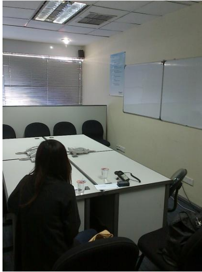
Gambar 3.10. Area rapat kantor Sequislife di lantai 1