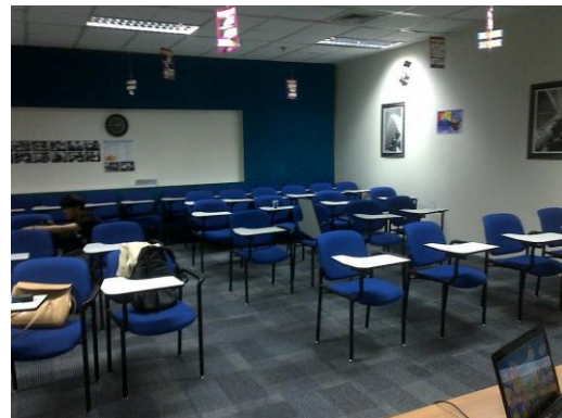
Gambar 3.7. Ruang pelatihan Sequislife di lantai 6