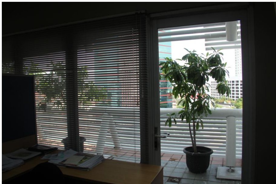
Gambar 3.4. Teras luar