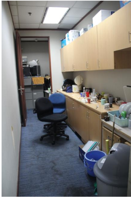
Gambar 3.5. Pantry