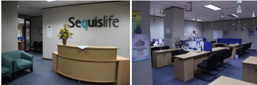
Gambar 3.3. Lobby Sequislife dan ruang kerja di lantai 8