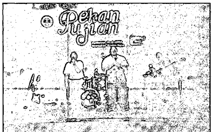
Grup Band Remaja GBI Bethany, Juara Pertama Lomba Band Pekan Rohani Petra

Sebagai puncak acara dari Pekan Rohani ini adalah Lomba Band. Tiap grup berusaha tampil dengan menarik di hadapan 3 juri dan penonton. Kemampuan tiap grup cukup bagus, hanya saja masih ada grup yang demam panggung. Penampilan "US Band" memukau juri dan penonton.