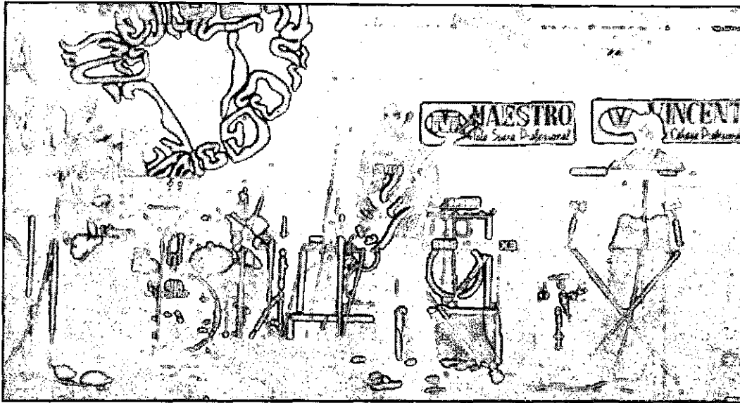
Aksi Salah Satu Band Peserta Gebyar Seni Budaya

▶ Badan Eksekutif Mahasiswa (BEM) UK Petra, 9 Agustus lalu mengadakan Gebyar Seni Budaya 2002, bertempat di Auditorium. Mulai pukul 10 pagi, mahasiswa UK Petra sudah mulai memasuki Auditorium. Tujuan diadakannya Gebyar Seni Budaya 2002 ini untuk memberikan kesempatan bagi mahasiswa dalam