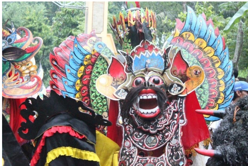
Gambar 2.5. Barong Kemiren