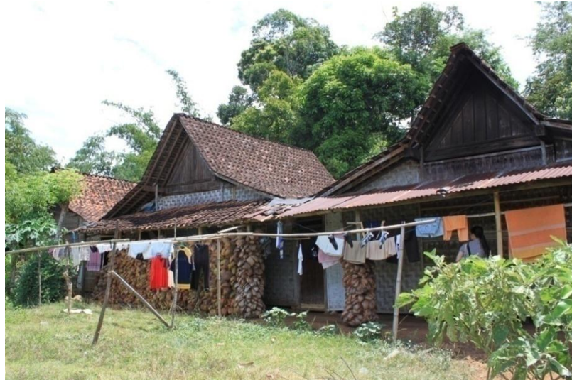
Gambar 2.3. Rumah Suku Osing