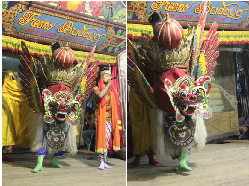
Gambar 2.4. Barong Kemiren