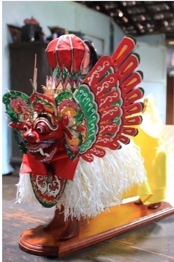
Gambar 2.6. Miniatur Barong

Selain daya tarik pada fungsinya, Barong Kemiren juga merupakan kumpulan artefak yang bergerak. Khusus pada barong dan pertunjukannya secara keseluruhan menyimpan berbagai simbol yang sarat makna. Simbol dan makna yang terdapat pada barong merupakan daya tarik tersendiri.