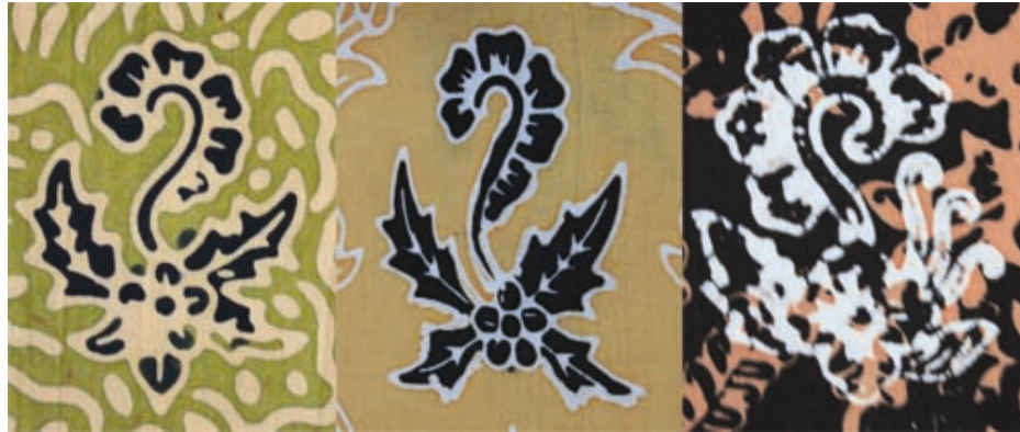
Gambar 2.7. Bentuk Gajah Uling