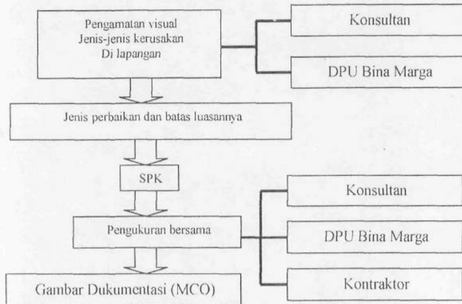
Gambar 3.1 Skema Cara Proyek Mengidentifikasi Kerusakan Jalan

Cara mengidentifikasi kerusakan dilakukan dengan cara pengamatan langsung atau visual dilapangan.