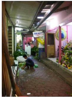
Gambar 1.3 Orang – orang kerja di jalan untuk pengunjung