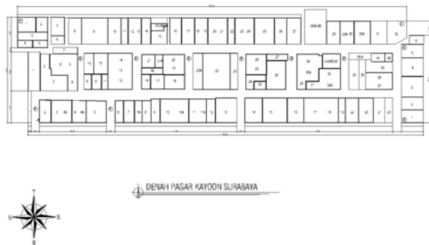
Gambar 1.13 Denah Pasar Bunga Kayoon