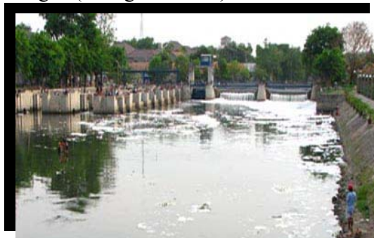
Gambar 1.1 Keadaan Sungai Kalimas di sekitar kayoon yang menjadi potensi pada tapak

Pasar Kayoon merupakan pasar yang terletak disepanjang Sungai Kalimas Surabaya yang mempunyai fasilitas tempat jualan aneka jenis bunga serta tanaman hias, di lengkapi pula dengan pusat makanan khas Surabaya. Selain itu juga terdapat pusat jualan batu antik. Jika dilihat keadaannya saat ini sungai Kalimas sangat kumuh dan tidak terawat, banyak sampah – sampah di tengah – tengah sungai dan juga banyaknya bungunan – bangunan liar memang cukup mengganggu pemandangan.(lihat gambar 1.1)