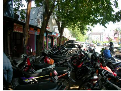
Gambar 1.6 Tempat parkir yang tidak memadai dan memakan jalan