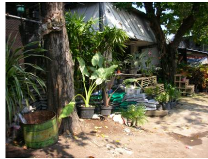
Gambar 1.7 Suasana area depan dari pasar Kayoon

Dilihat dari foto – foto perkembangan keadaan pasar Kayoon dapat di simpulkan, terjadi penurunan keadaan lingkungan sekitar pasar bunga Kayoon misalnya keadaan menjadi lebih kumuh, kotor dan tidak terawat. Begitu juga keadaan parkir kendaraan yang mau ke pasar bunga Kayoon, sangat semeraut dan parkir dengan sembarangan. (lihat gamabar 1.8)