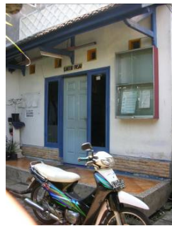
Gambar 1.4 kantor pasar yang kurang memadai