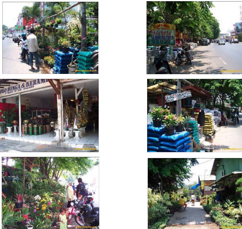
Gambar 1.2 Keadaan Pasar Kayoon beberapa tahun yang lalu

Beberapa foto perkembangan tentang keadaan pasar bunga Kayoon beberapa tahun yang lalu dengan keadaan pasar Kayoon sekarang.(lihat gambar 1.2 sampai gambar 1.7)