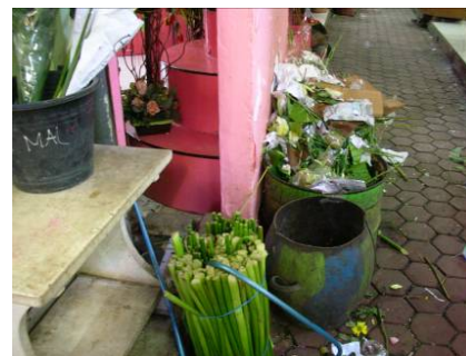
Gambar 1.5 Sampah – sampah dari bunga yang di letakkan sembarangan di depan toko