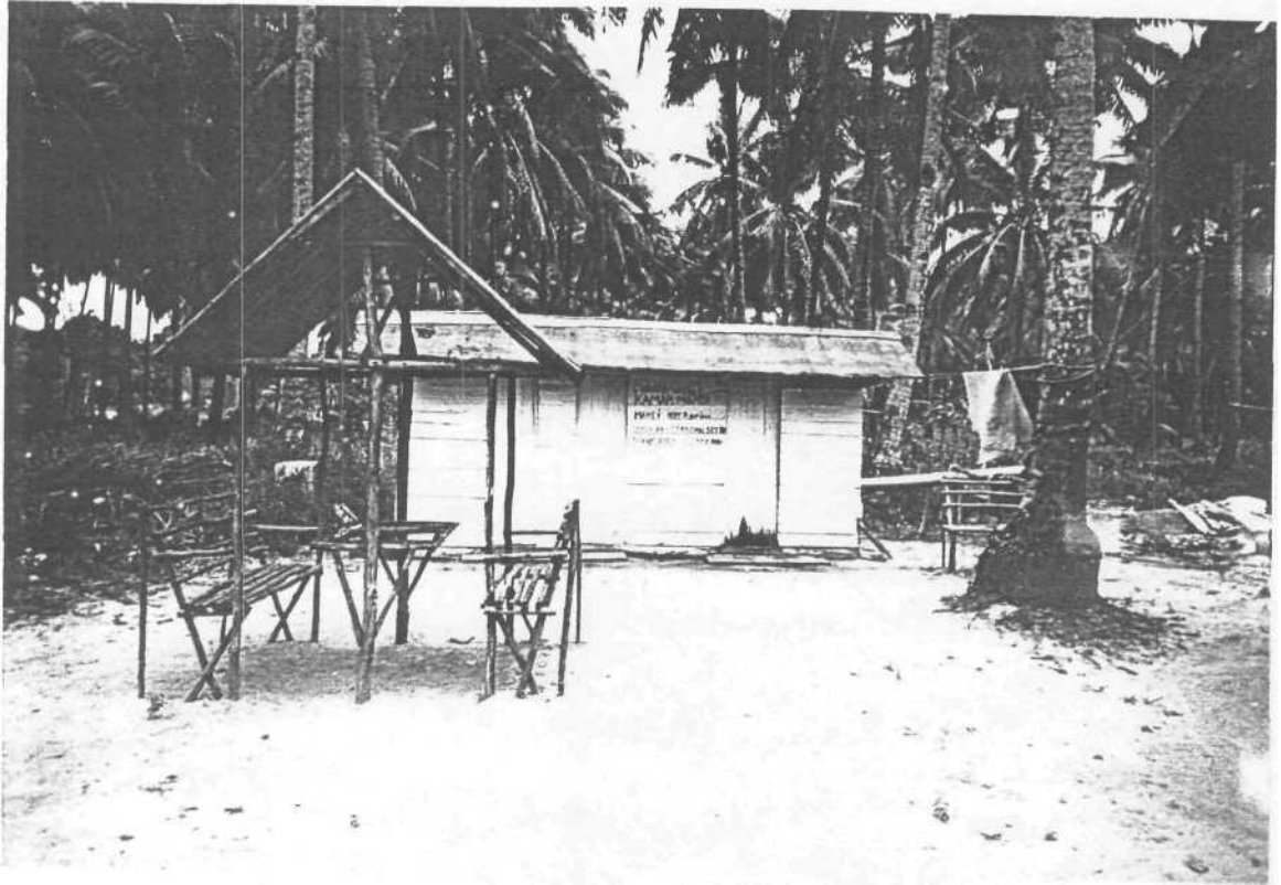
Gambar 11. WC Umum