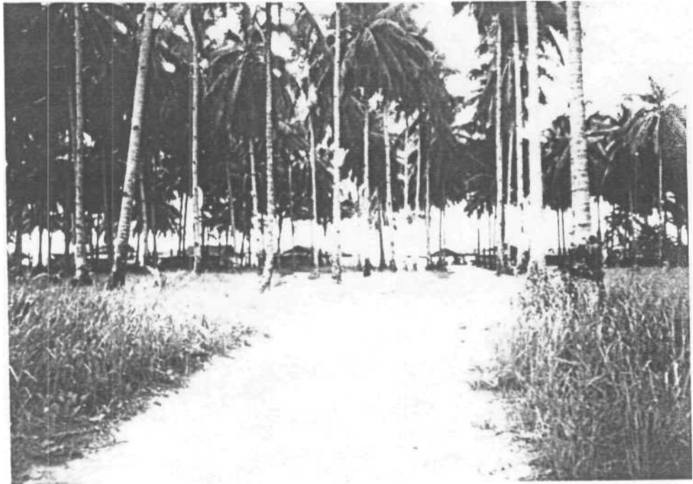
Gambar 05. Keadaan Jalan Masuk Pantai Trikora