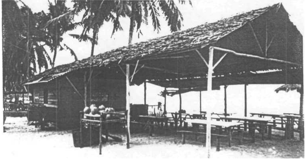
Gambar 07. Warung Di Pantai Trikora