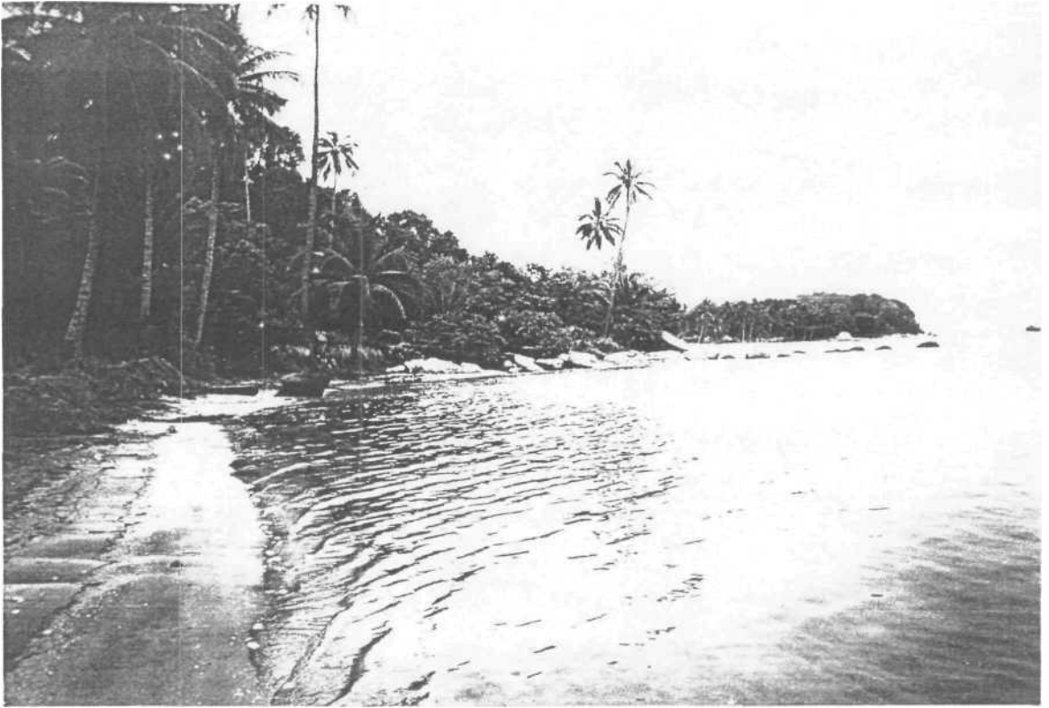
Gambar03. Pemandangan Pantai Trikora