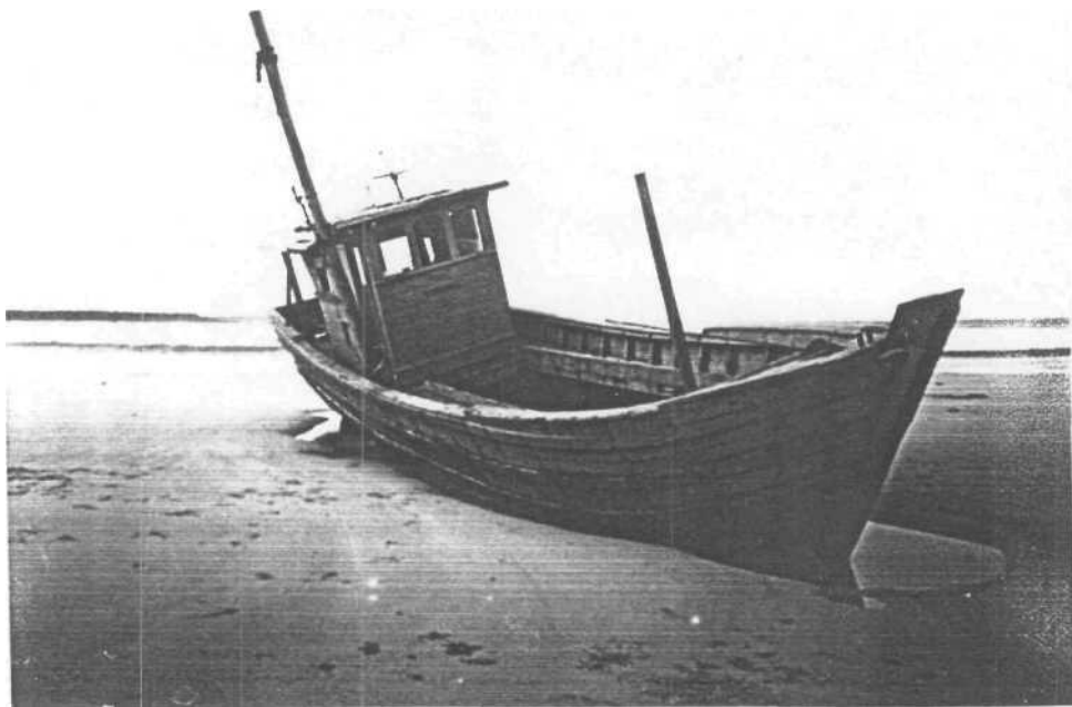
Gambar 04. Kapal Yang Digunakan Para Nelayan