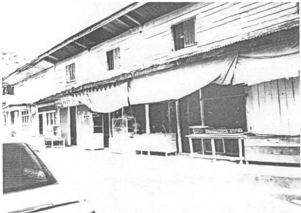
Gambar 10. Rumah Tradisional di Gesek Yang Terkenal Dengan Nasi Lemak