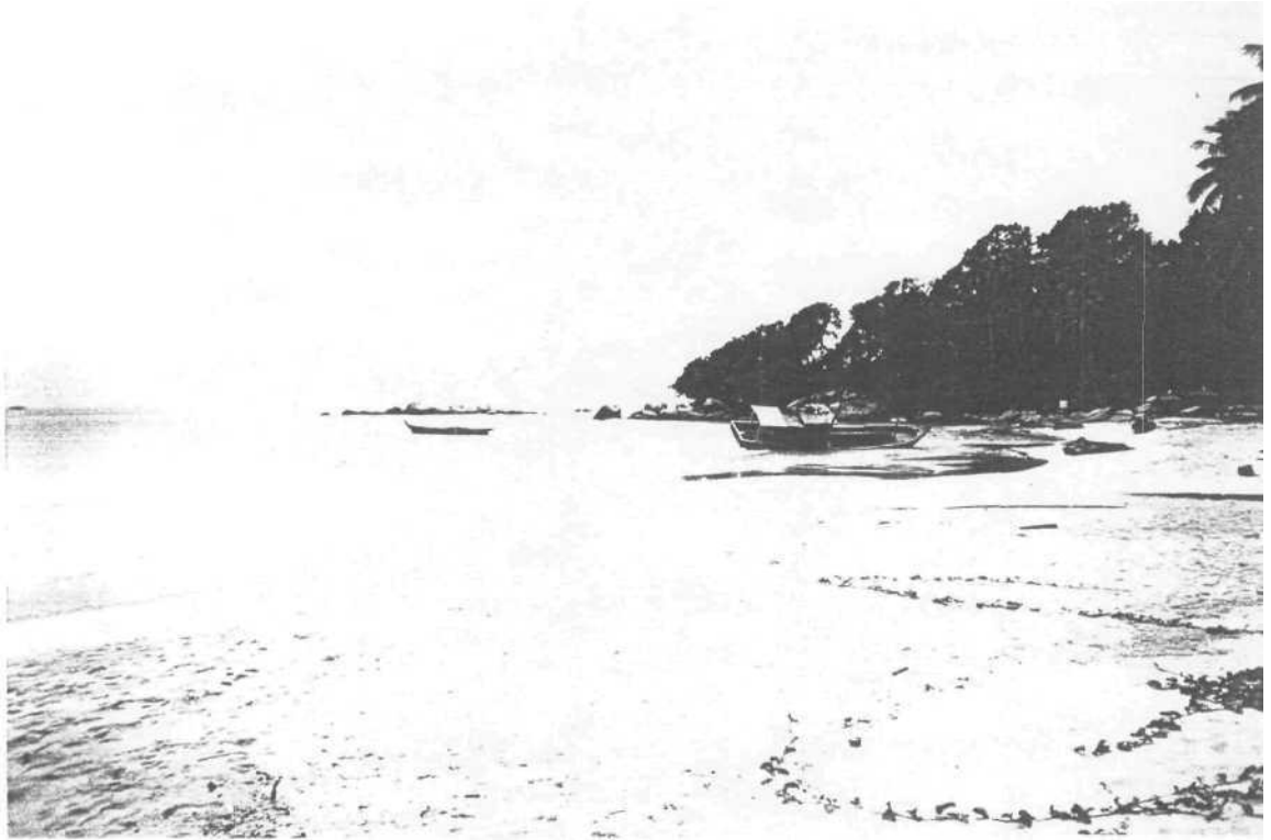
Gambar 01. Pemandangan Pantai Trikora