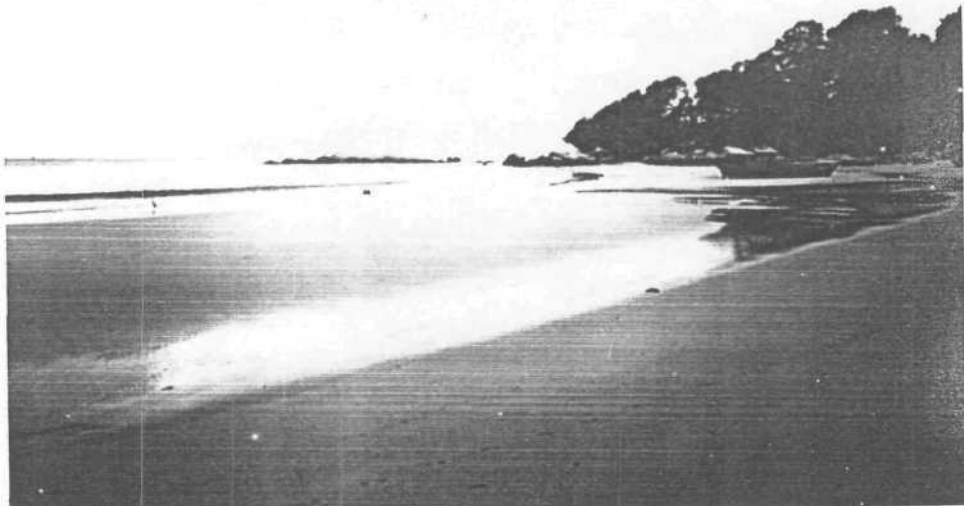
Gambar 02. Pemandangan Pantai Trikora