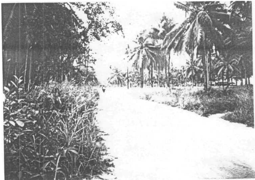
Gambar 06. Keadaan Jalan Raya Pantai Trikora