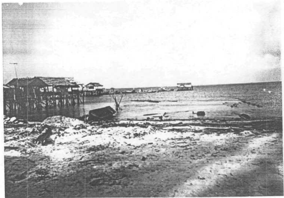
Gambar 08. Kelong ( Warung Di Atas Laut) Berada Di Dekat Pantai