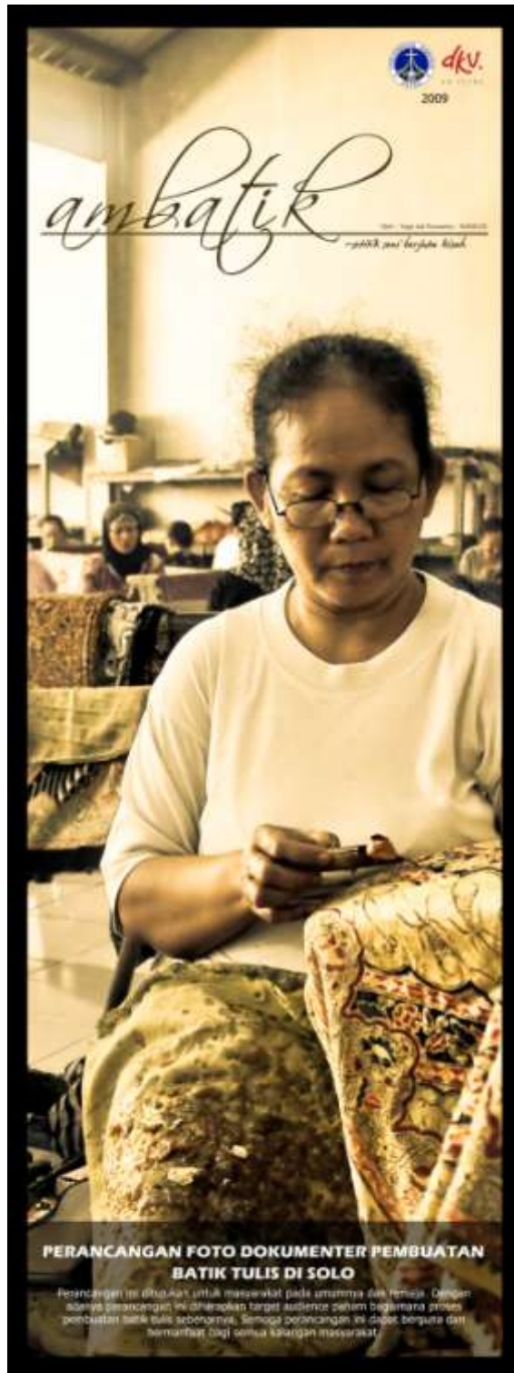
Gambar 4.28. X-Banner