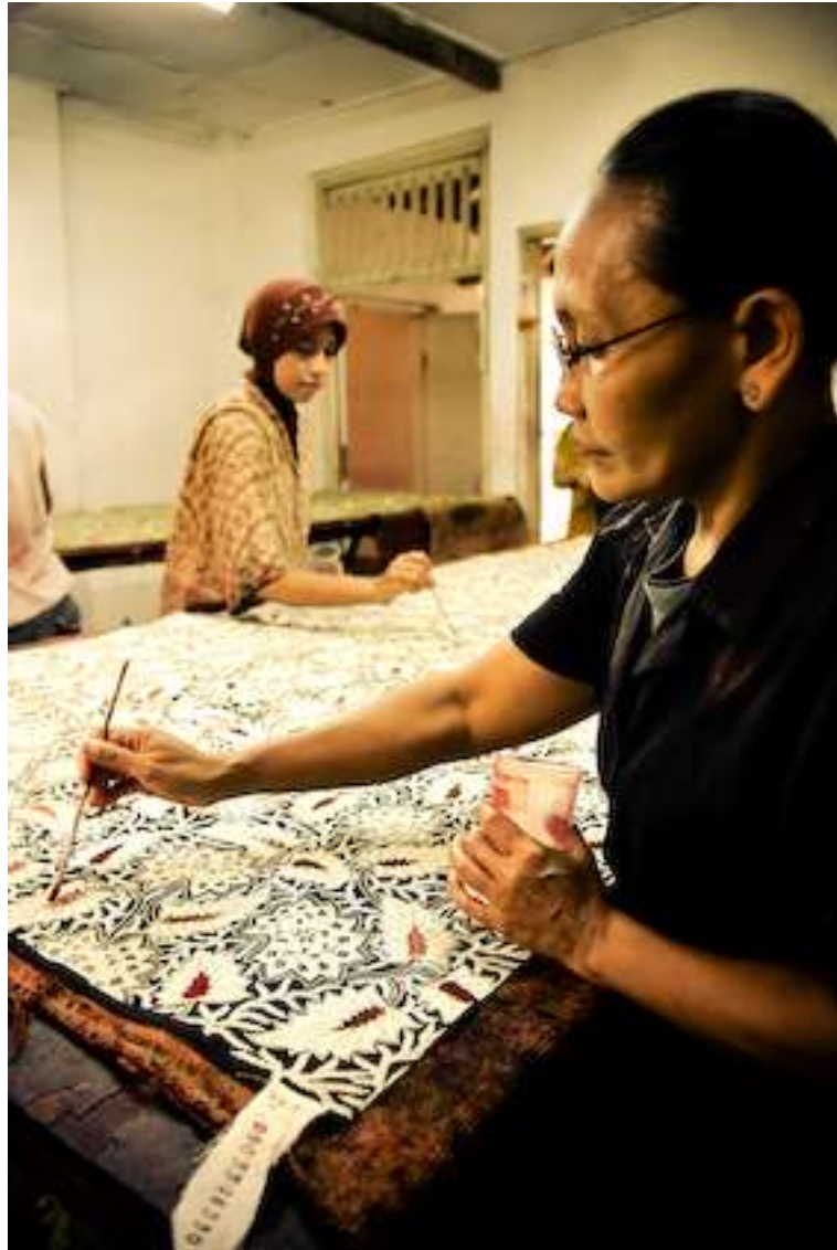
Gambar 4.8. Colet 1