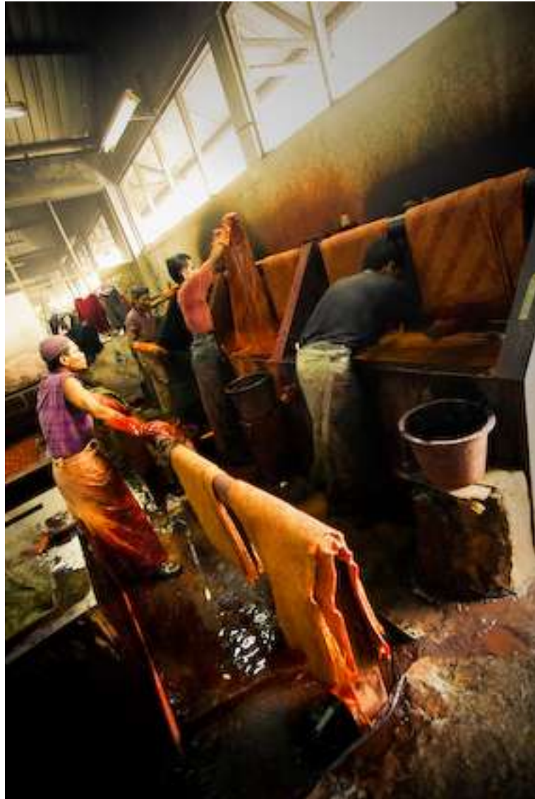
Gambar 4.7. Celup