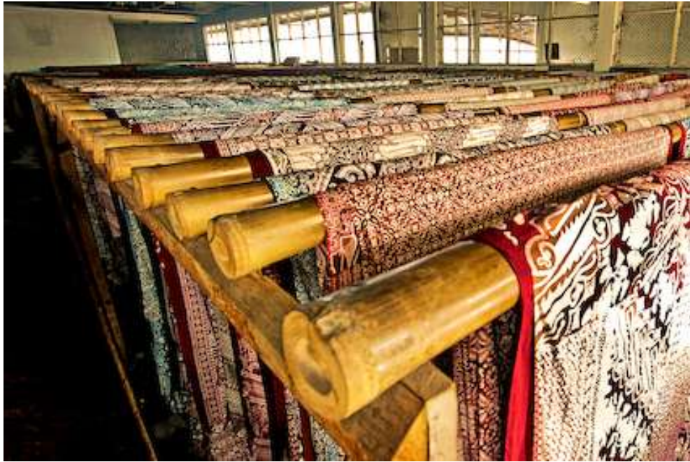
Gambar 4.18. Jemur