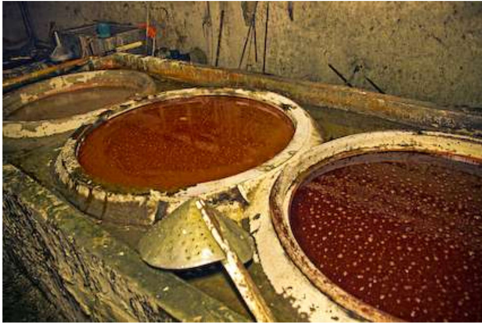
Gambar 4.12. Nglorot 1