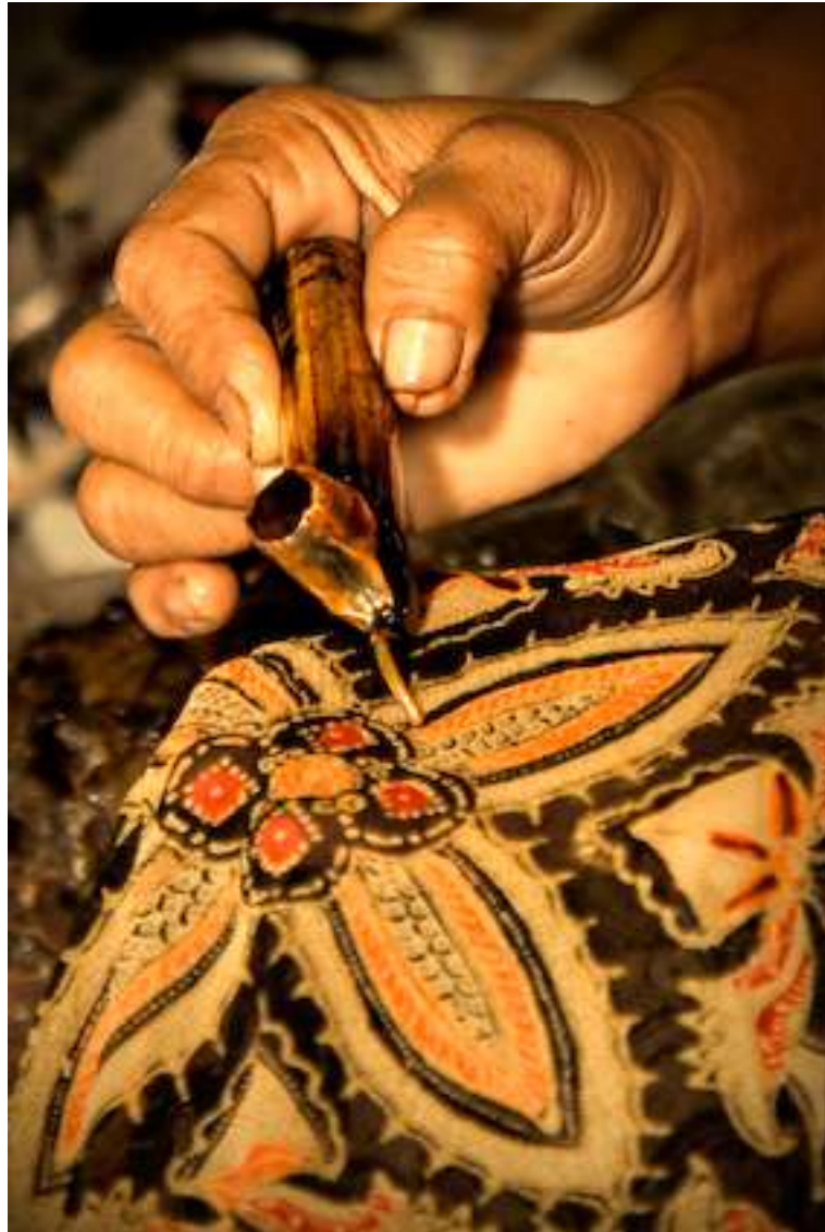
Gambar 4.10. mBatik 2-1