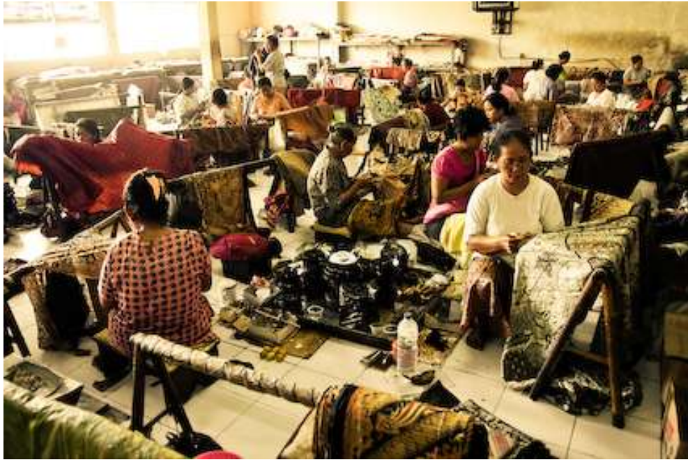
Gambar 4.11. mBatik 2-2