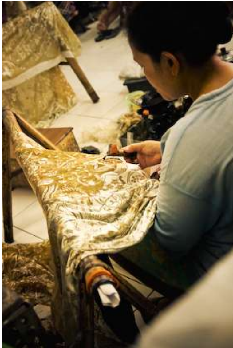
Gambar 4.6. Nembok 2