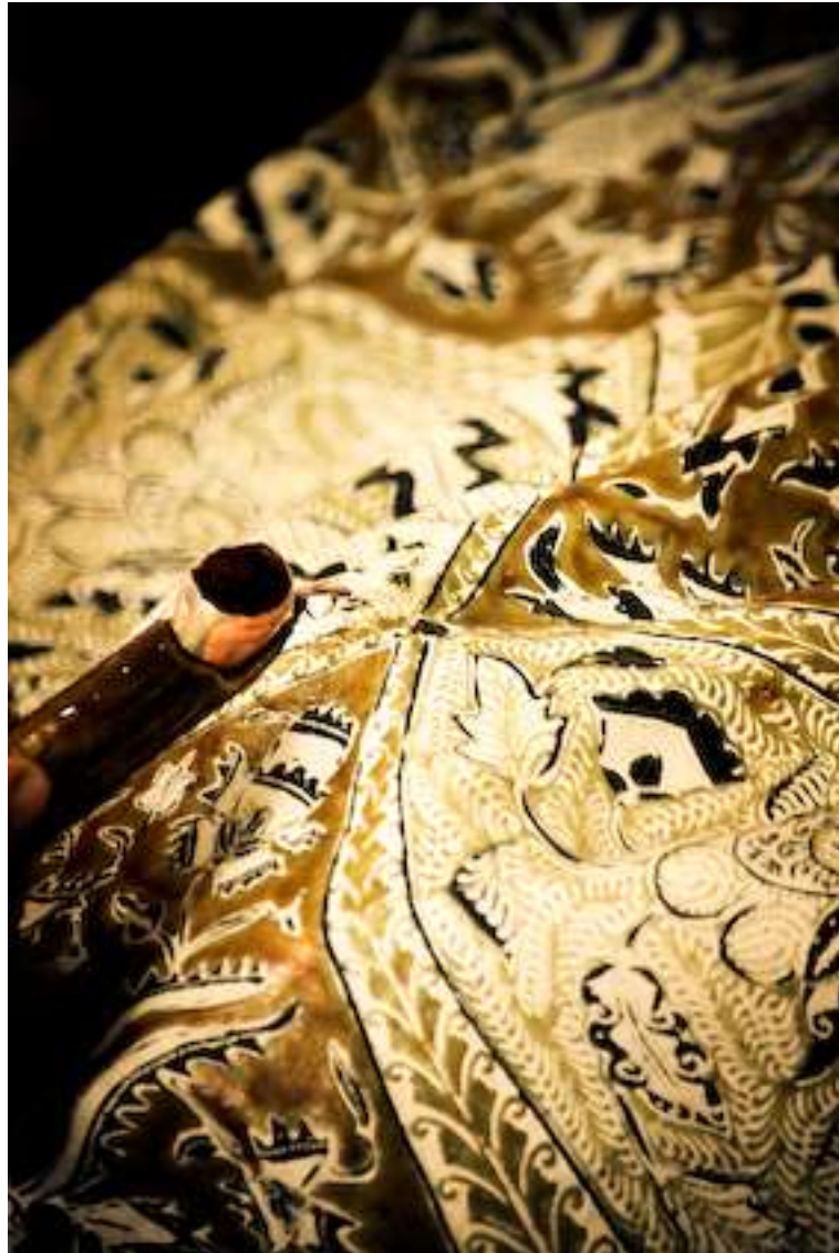
Gambar 4.5. Nembok 1