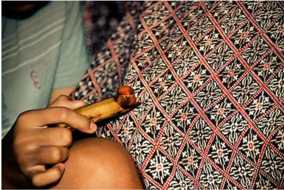
Gambar 4.14. Granit