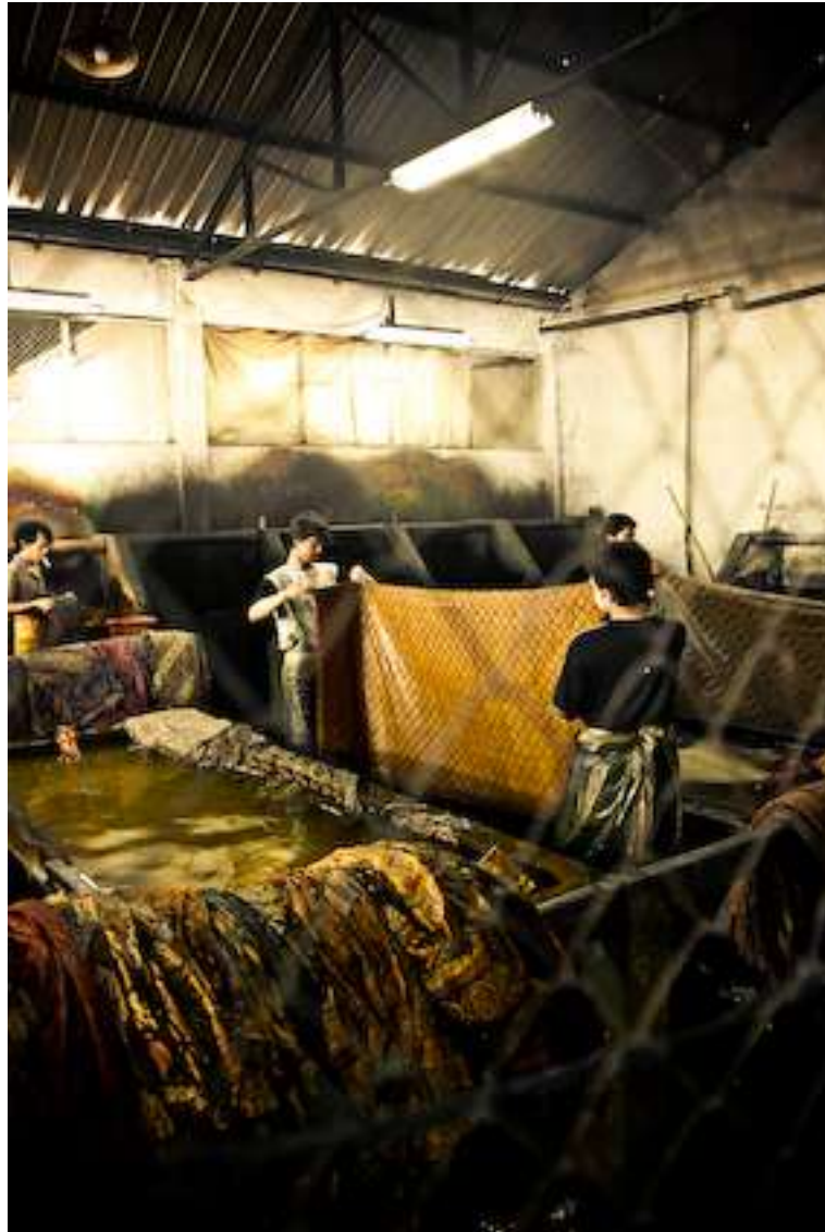
Gambar 4.17. Soga