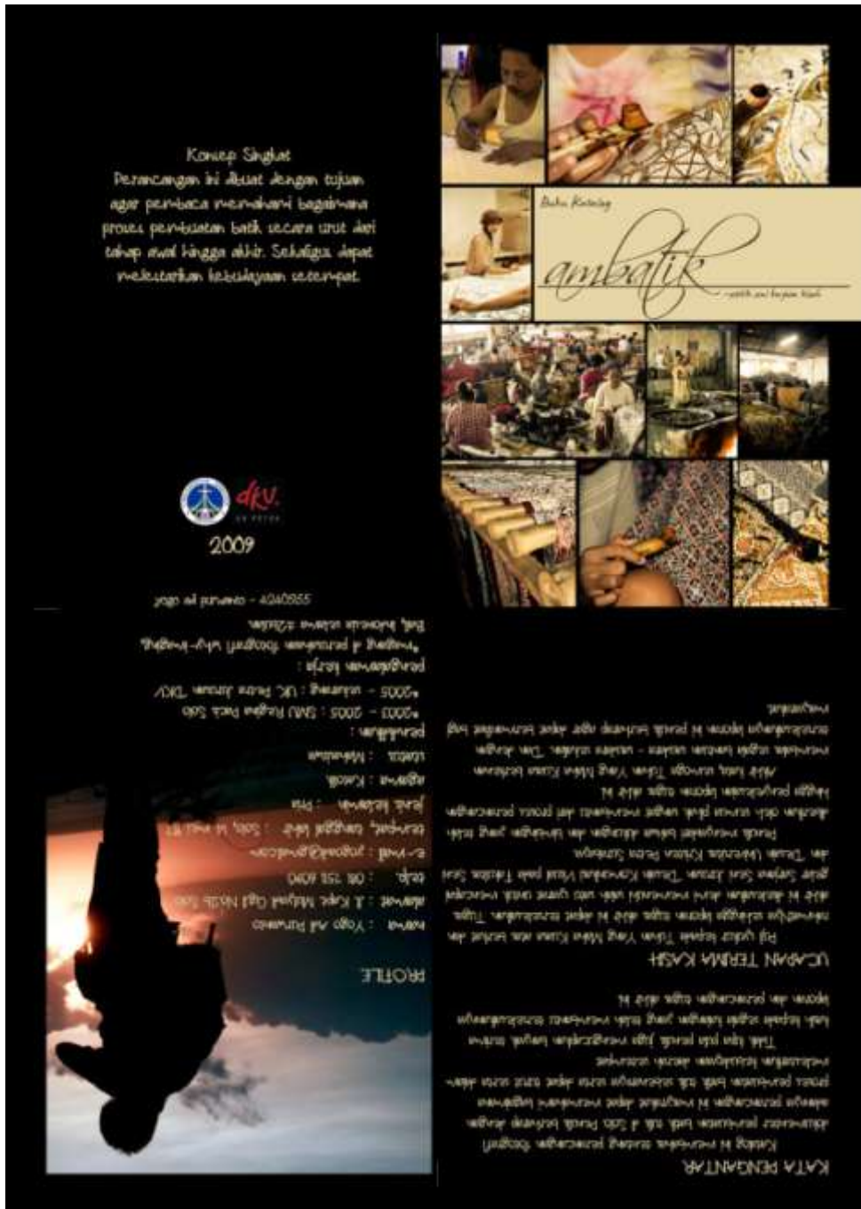
Gambar 4.26. Katalog Halaman Depan