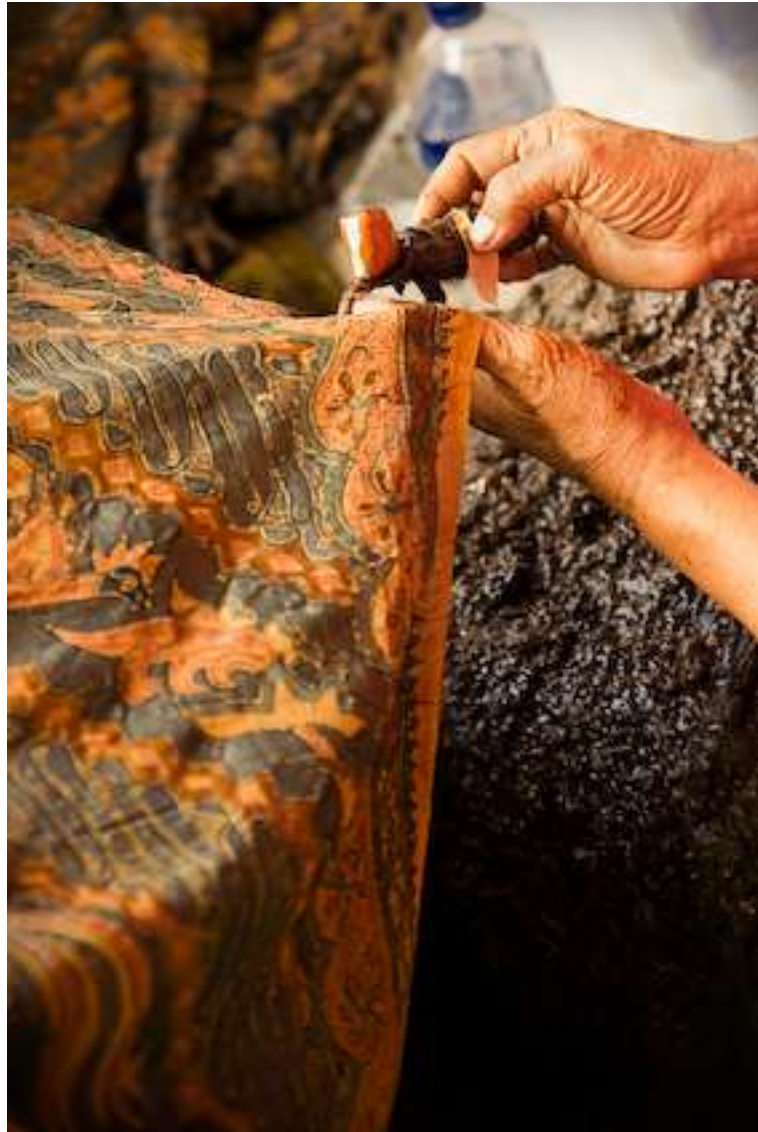
Gambar 4.16. Bironi 2