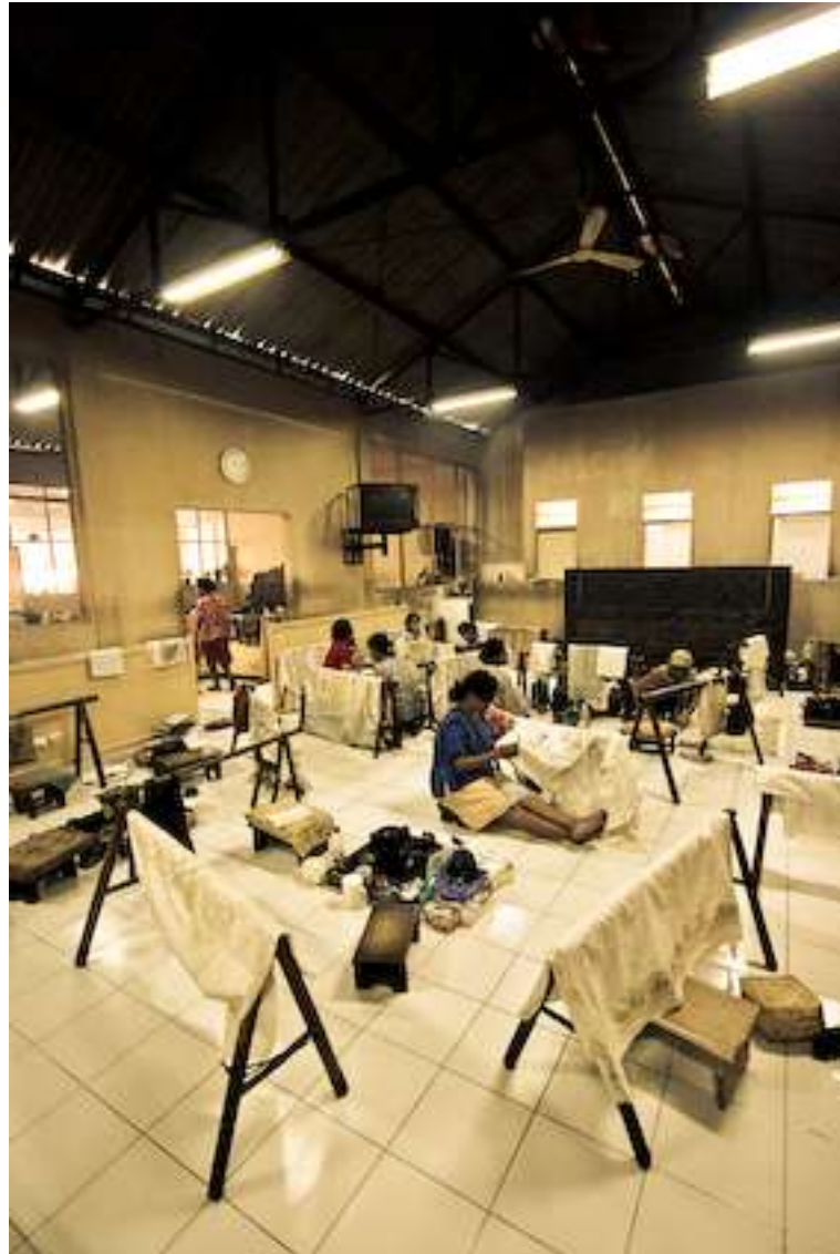
Gambar 4.3. nGrengreng 1