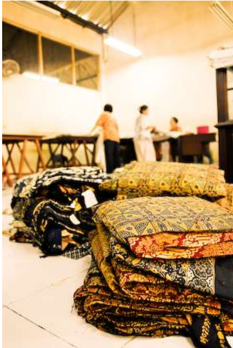
Gambar 4.19. Lipat 1