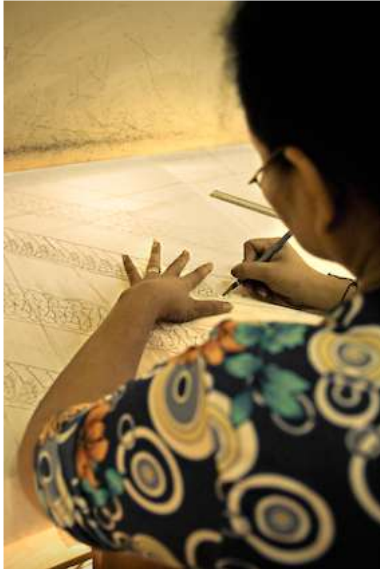
Gambar 4.1. Mola 1