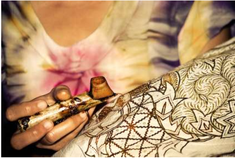
Gambar 4.4. Ngrengreng 2