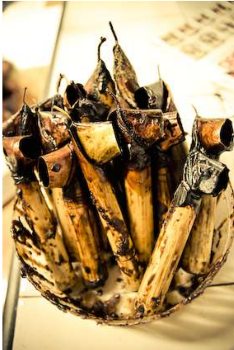
Gambar 4.21. Canting