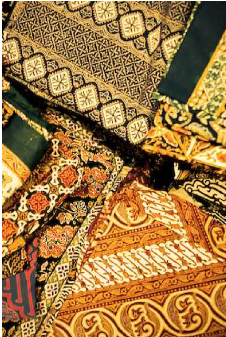
Gambar 4.20. Lipat 2