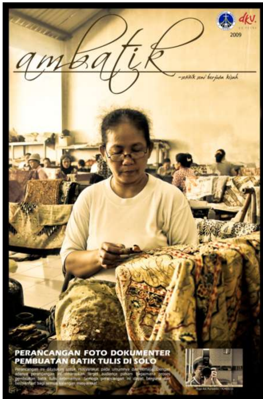
Gambar 4.23. Poster