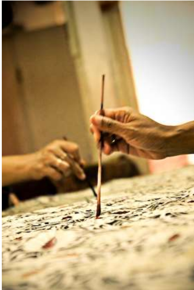
Gambar 4.9. Colet 2