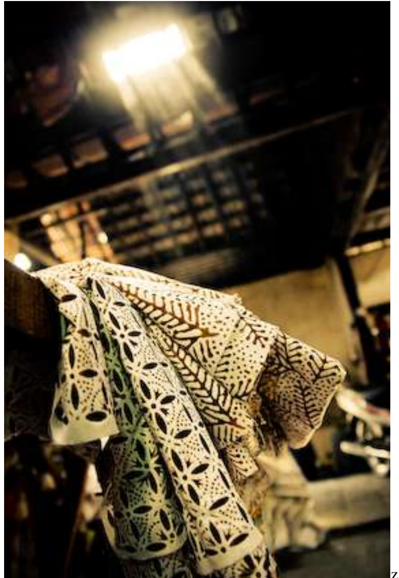
Gambar 4.22. Light Of Inspiration