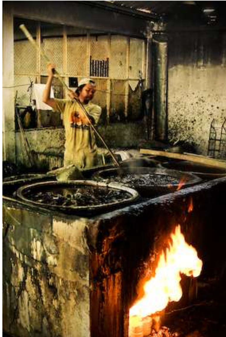
Gambar 4.13. Nglorot 2