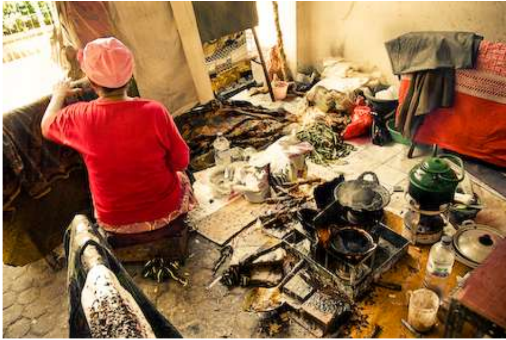
Gambar 4.15. Bironi 1