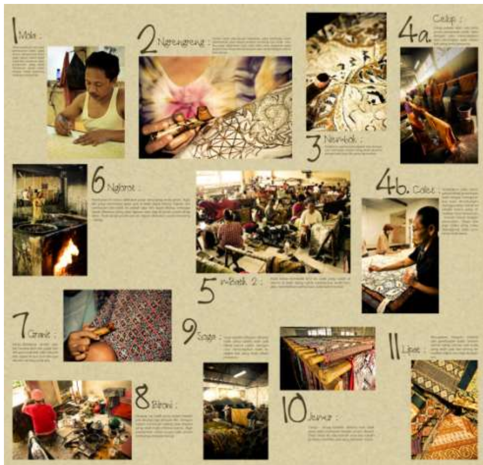
Gambar 4.24. Pamflet Halaman Depan