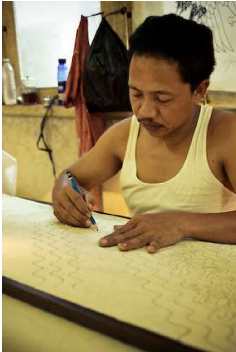
Gambar 4.2. Mola 2