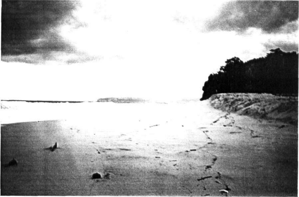
Gambar 7. Pantai Molang dengan keindahan pasir putihnya .