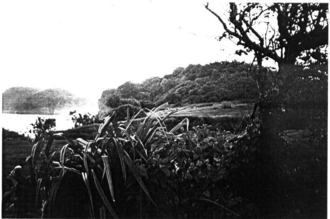
Gambar 3 , 4 Pemandangan Pantai Molang yang masih alami