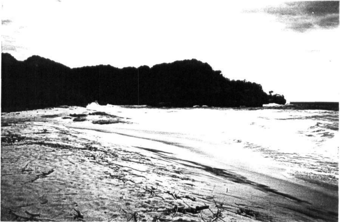
Gambar 1. Pantai Molang yang terletak di desa Pucanglaban