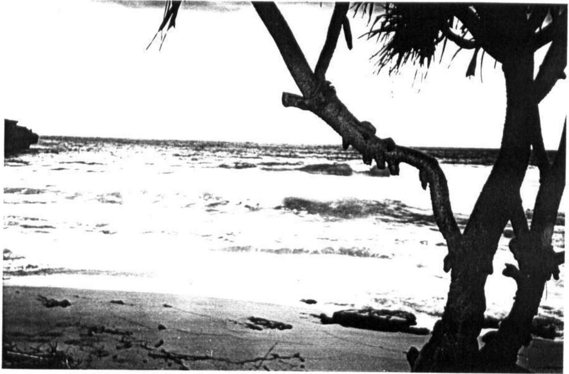
Gambar 6. Pantai Molang yang memiliki air yang jernih dan belum terpolusi .