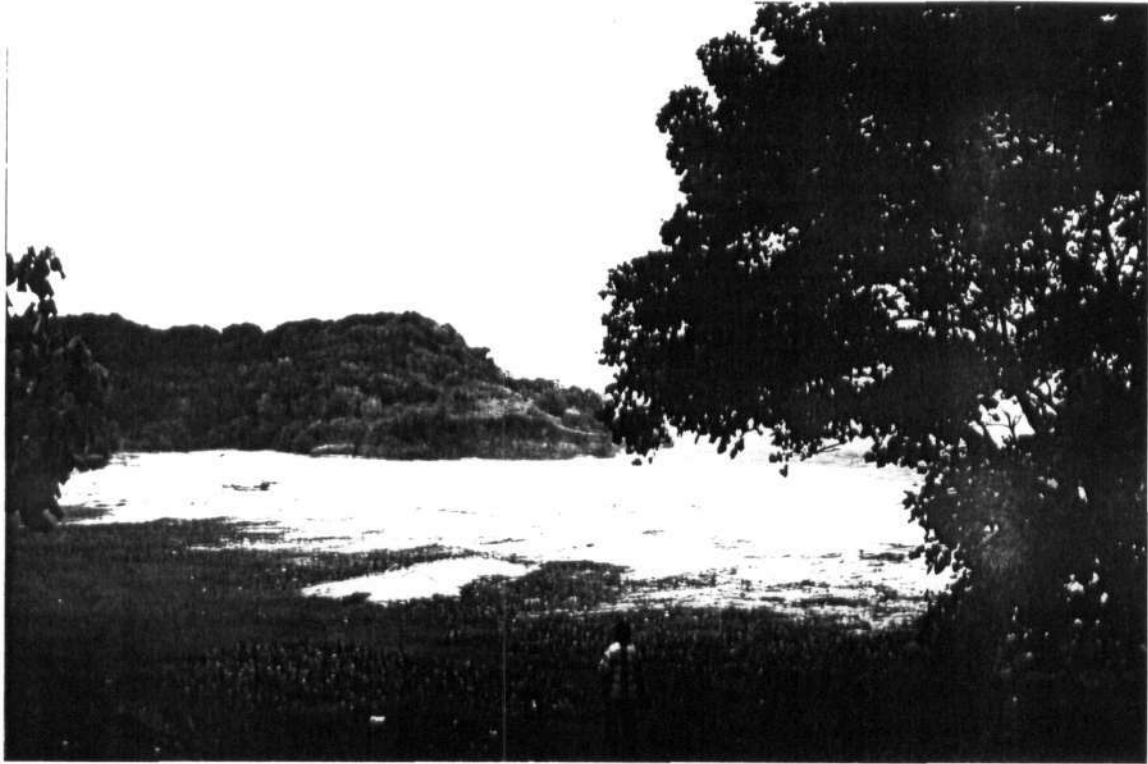
Gambar 5. Lokasi perkemahan yang ada di Pantai Molang .