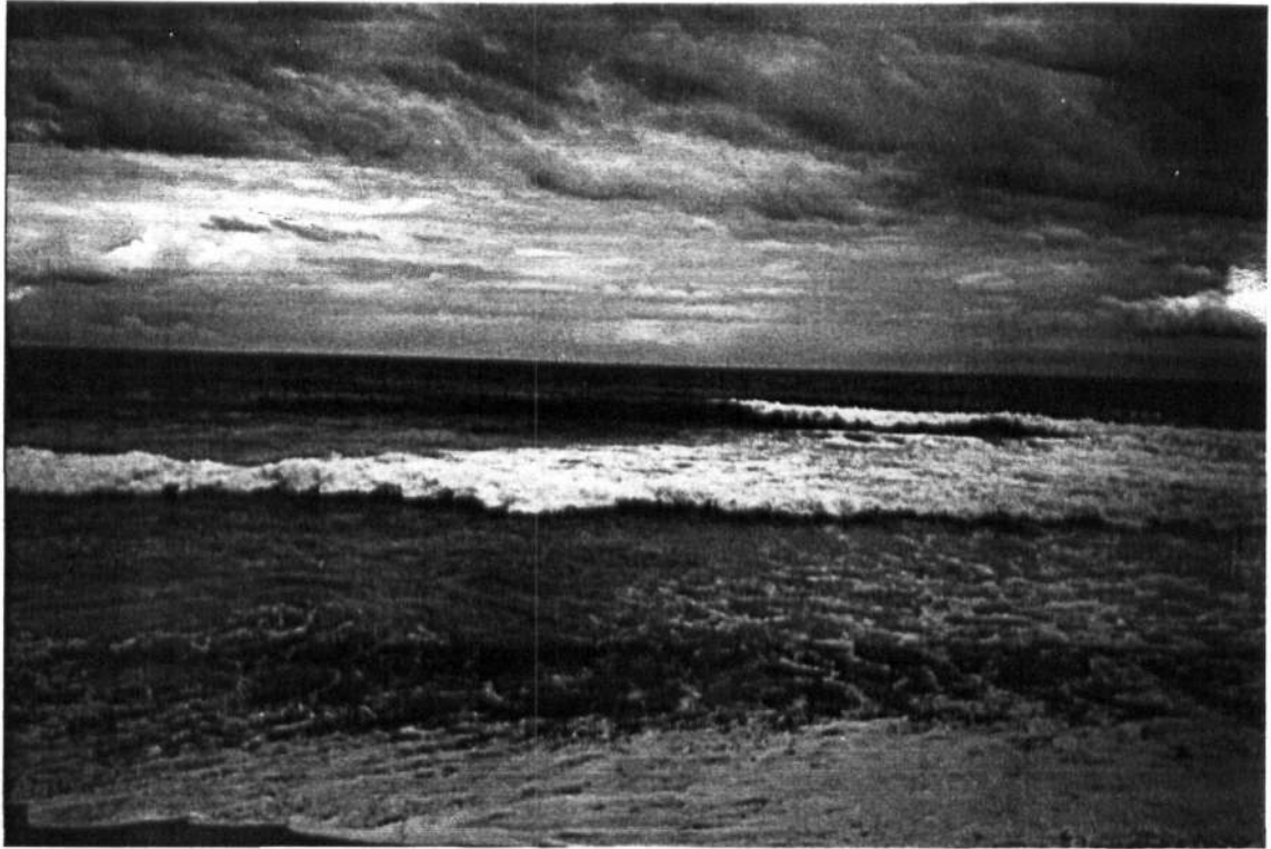
Gambar 8. Deburan ombak Pantai Molang yang cukup besar cocok untuk berolah raga air .