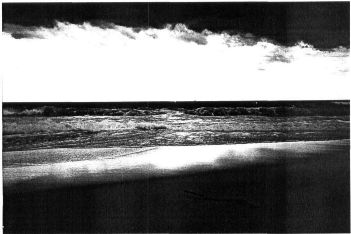
Gambar 9 , 10 . Pemandangan Pantai Molang pada waktu senja hari .