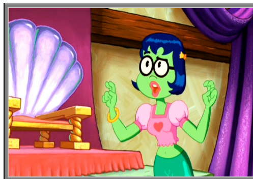
Gambar 4.7. Putri Mindy

Raja Neptune adalah penguasa tertinggi lautan. Kepalanya yang botak tertutup oleh mahkota kerajaan yang biasa ia kenakan sebagai tanda bahwa ia adalah sang penguasa lautan. Ia tinggal di istana bersama putrinya, Mindy yang kelak akan menggantikan kedudukannya. Ia seorang raja yang cukup kejam dan selalu memimpin dengan “tangan besi”. Kebiasaan buruknya adalah ia tidak pernah melewatkan satu hari pun tanpa menghukum seseorang dan perbuatannya tersebut sangat tidak disenangi Putri Mindy .