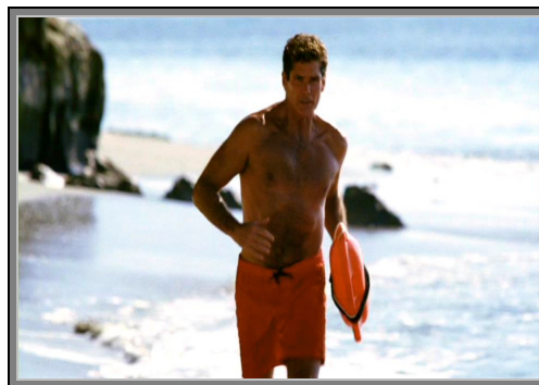
Gambar 4.9. David Hasselhoff

Dennis “the hit man” adalah seorang pembunuh bayaran yang disewa Plankton untuk mencelakai SpongeBob dan Patrick . Ia terkenal kejam, predator dan berdarah dingin.