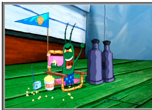
Gambar 4.5. Sheldon J. Plankton

Eugene H. Krabs adalah bos dari SpongeBob dan Squidward yang merupakan pemilik restoran Krusty Krab yang menjual burger lezat bernama Krabby Patty . Ia merupakan tokoh yang kikir dan tamak, karena ia adalah pengusaha yang hanya mementingkan uang.