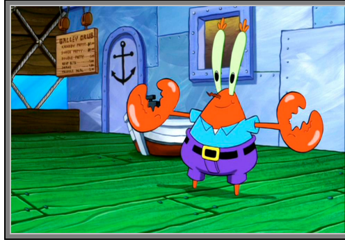
Gambar 4.4. Eugene H. Krabs