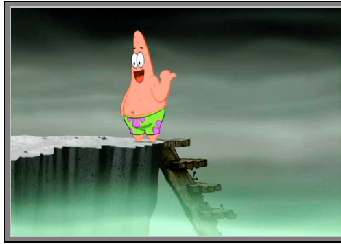
Gambar 4.2. Patrick Star