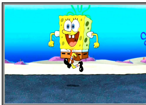
Gambar 4.1. SpongeBob SquarePants