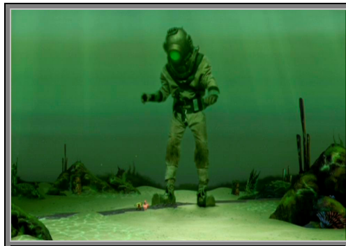
Gambar 4.10. Cyclops