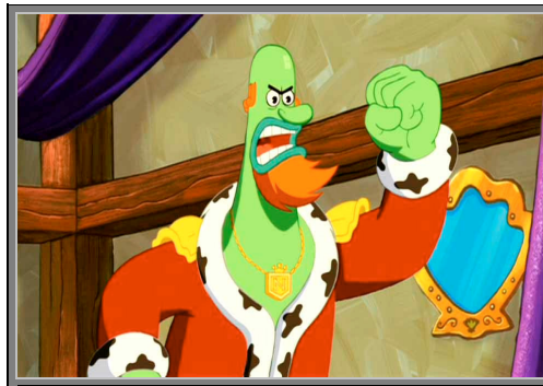
Gambar 4.6. Raja Neptune