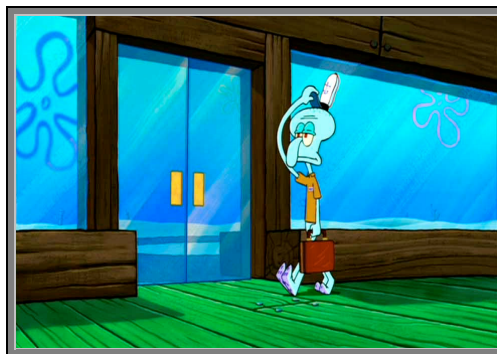
Gambar 4.3. Squidward Tentacles

Patrick Star adalah si bintang laut sahabat kental SpongeBob . Dia sangat suka melakukan berbagai macam kegiatan seperti yang dilakukan oleh SpongeBob . Patrick memiliki karakter sifat yang sangat lucu dan bodoh tetapi penyayang.