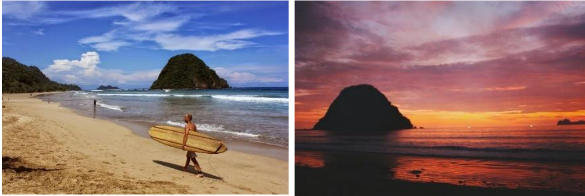
Gambar 1.1 Wisata Selancar dan Pemandangan Sunset di Pantai Pulau Merah

Kabupaten Banyuwangi merupakan sebuah wilayah kabupaten di Provinsi Jawa Timur , Indonesia yang memiliki banyak potensi wisata. Salah satunya adalah Pantai Pulau Merah yang terletak di Selatan Kabupaten Banyuwangi. Nama Pulau Merah merujuk pada sebuah bukit kecil di tepi pantai yang memiliki tinggi sekitar 200 meter. Bukit tersebut memiliki tanah berwarna merah dan ditutupi oleh vegetasi hijau sehingga tidak terlalu tampak warna aslinya. Bukit ini bisa diakses pada saat air sedang surut. Pantai ini terkenal dengan potensi ombak yang dapat digunakan untuk berselancar. Hal ini berpotensi mendatangkan wisatawan domestik maupun wisatawan luar negeri untuk berselancar dan menikmati keindahan Pantai Pulau Merah.