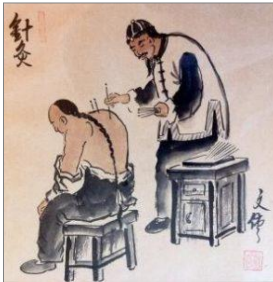
Gambar 2.6. Teknik akupuntur

dikembangkan menjadi karpet, sandal, dan alat pijakan agar jalur energi pada tubuh bisa bersikulasi dengan lancar.