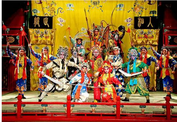
Gambar 2.5. Opera Beijing

Opera merupakan seni teater masyarakat China, di daerah-daerah opera ini biasanya dimainkan saat ada festival ataupun acara tertentu.