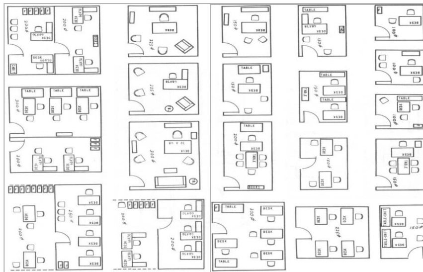
Gambar 2.2. Tipe-tipe layout kantor semiprivat

Chiara dan Callender (1980), ruang konfrensi atau ruang rapat adalah bagian penting dalam sebuah bangunan kantor. Ruang konfrensi tidak memiliki standar pengguna yang harus berada dalam ruang tersebut. Ruang tersebut dapat diadakan berdasarkan kebutuhan pengguna. Ruang konfrensi/ ruang rapat digunakan untuk merencanakan, mengevaluasi, dan tempat menampung saran maupun kritik.