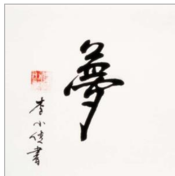
Gambar 2.4. Kaligrafi China

Shu fa dalam bahasa Cina, telah dianggap sebagai intisari budaya Tionghoa karena ini adalah seni yang mencakup bahasa Cina, sejarah, filsafat, dan estetika. Menurut Li (2009), Kaligrafi Cina merupakan warisan budaya yang kompleks dan misterius. Seni kaligrafi melambangkan kemajuan dalam pendidikan, kreativitas, dan budaya. Penulisan kaligrafi China memiliki teknik tersendiri, dalam menulis seseorang harus dalam kondisi tenang dan fokus, saat kerajaan dulu para penyair menulis kaligrafi ditempat yang dilengkapi pemandangan sehingga mereka mendapatkan inspirasi dan langsung menggoreskan dalam bentuk tulisan. Kaligrafi China sampai sekarang masih banyak digunakan dalam penulisan puisi/ syair-syair dalam seni. Peralatan yang dibutuhkan meliputi kuas kaligrafi, kertas tipis seperti kertas roti, dan tinta.