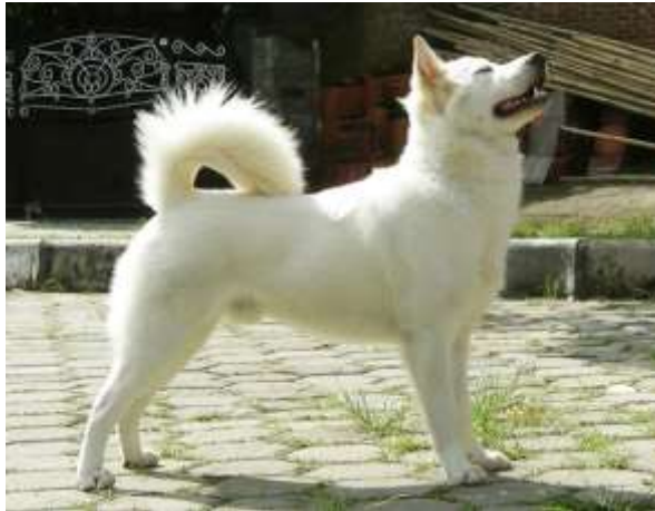
Gambar 2.1 Anjing Kintamani