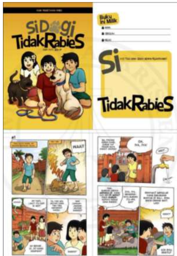
Gambar 2.10 Karya cergam (komik) pesaing