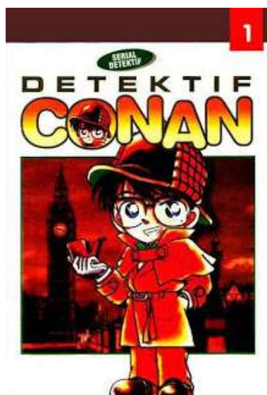
Gambar 2.8 Contoh komik Detektif Conan dari Jepang

Lalu adapula masa dimana cergam impor dan terjemahan lebih banyak dijual daripada cergam lokal oleh penerbit. Istilah cergam ini akhirnya tergeser menjadi istilah komik yang sudah mengglobal dan populer di kalangan anak muda. Pada tahun 1980-an sampai dengan 1990-an semakin banyak komik impor yang masuk ke Indonesia. Lalu dengan perkembangan jaman, cergam sudah dapat diakses melalui internet dan dapat dilihat tanpa sensor negara sehingga gambar atau adegan yang tak senonoh juga dapat dibuka. (Salam, 2017, p.197)