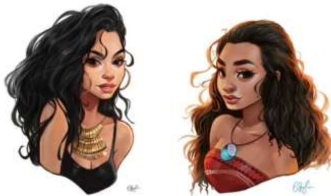
Gambar 2.3 Contoh gaya ilustrasi semi realis karya BoFenglin

Menurut Is Yuniarto, semi realis dapat dijabarkan dari per-kata nya, yaitu semi yang dalam bahasa Inggris berarti tidak penuh atau sebagian, dan realis yang berarti nyata. Gaya gambar yang menggunakan pewarnaan yang semi realis atau 3 dimensi namun proporsi tubuh karakter tidak seperti sesungguhnya. Terjadi distorsi pada bagian tubuh tertentu seperti terlalu besar atau terlalu kecil sehingga menimbulkan kesan tidak nyata. Semi realistic memiliki penggemar yang cukup banyak pula karena memiliki sebuah kemiripan tersendiri dengan objek atau orang nyata namun dalam bentuk kartun yang dibuat lebih cantik atau lucu oleh senimannya. Cukup banyak indie artists atau seniman independen yang menunjukkan karya ilustrasi semi realis-nya yang digemari oleh banyak orang.