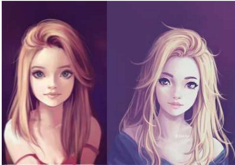
Gambar 2.9 contoh ilustrasi karya Hiba Tan Sumber: https://www.redbubble.com/people/hibatan/works/23695550-untitled?p=photographic-print