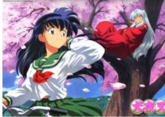
Gambar 2.2 Contoh gaya ilustrasi Jepang, Inuyasha

postur tubuhnya kurus, rambutnya berwarna-warni dan tak nampak seperti ras manapun di dunia nyata namun bisa terlihat dari bajunya yang merupakan baju adat suatu negara atau tempat. (Shirong Lu, 2008, p.172)