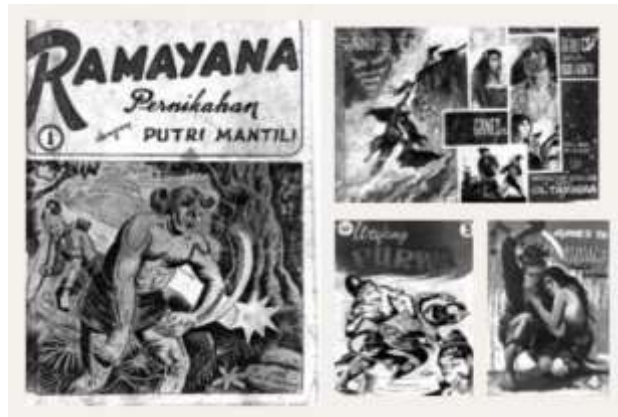
Gambar 2.7 Cergam berjudul Ramayana

usaha untuk mengimbangi cergam luar negeri yang datang ke Indonesia pada sekitar tahun 1940 seperti Tarzan , Phantom , Rip Kirby , Marco Polo , dan lain-lain. Pada masa ini pula muncul cergam bertema Cina seperti Petualangan Sie Dijen Koei .