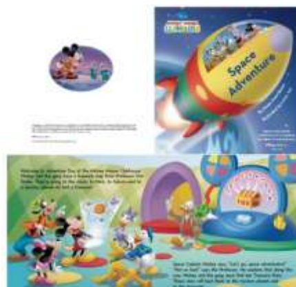
Gambar 2.4 Contoh buku cergam Disney

Buku cergam merupakan sebuah buku bacaan yang sudah sering digunakan sejak dulu ditujukan untuk anak-anak untuk membantu melancarkan kemampuan anak dalam membaca dan memahami kata-kata. Meskipun demikian, buku cerita bergambar ini juga masih dapat diminati oleh remaja dan kalangan dewasa pula karena buku cergam merupakan sebuah bentuk bacaan yang menghibur. Salah satu hasil thesis dari Rollins College mengkaji tentang kegunaan buku gambar dalam sebuah kelas di tingkat SMA dan hasilnya membuktikan bahwa ada peningkatan pemahaman para siswa terhadap materi yang disediakan. Dengan ini, dapat disimpulkan bahwa sampai umur remaja pun buku cergam masih memiliki dampak yang cukup kuat.