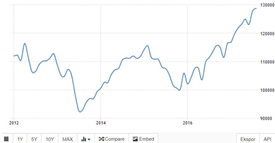
Gambar 1.1 Grafik Pertumbuhan Cadangan Devisa Indonesia

memberikan warna baru dalam era kepemimpinannya. Saat mewarisi “warisan” dari pemimpin sebelumnya, Pada waktu itu, cadangan devisa yang dimiliki oleh Indonesia berada pada posisi US$111.862 M (BPS, November 24, 2016). Tetapi pada saat ini, jumlah cadangan devisa Indonesia naik \pm 16% menjadi US$ 128.8 M pada akhir September 2017. (Trading Economics, September 11, 2017). Berikut ini table dari pertumbuhan cadangan devisa Indonesia pada era kepemimpinan dari Presiden Joko Widodo.