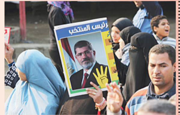
内阁12月25日决定将穆兄会及其分支机构定性为恐怖组织。

6月30日，埃及前总统穆西执政一周，穆西的支持者和反对者发生暴力冲突，导致大量人员伤亡。7月1日，军方发出48小时最后通牒，要求双方解决危机。7月3日，军方以未能控制局面为由解除穆西职务，由最高法院院长暂行总统职权，并宣布“未来路线图”进行政治过渡。8月14日，埃及警方对开罗和吉萨两处穆西支持者营地清场，并宣布全国进入一个月的紧急状态，在12个省实行宵禁。清场行动和其后在全国各地发生的冲突共造成近千人丧生。9月12日，过渡政府决定延长紧急状态两个月。10月9日，埃及取消穆斯林兄弟会（穆兄会）注册的非政府组织资格。埃及