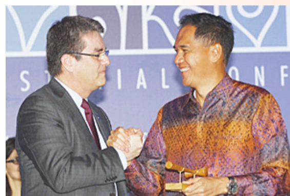
12月7日，世界贸易组织（WTO）第九届部长级会议在印尼峇厘岛闭幕，各方达成该组

织成立以来首个全球性贸易协定。协定包含贸易便利化、农业、棉花、发展等四项议题共10份文件，内容涵盖简化海关及口岸通关程序、允许发展中成员在粮食安全上有更多选择权、协助最不发达成员发展贸易等内容。协定将为正在艰难复苏的全球经济注入新的活力，发展中成员将从中获益。多哈回合谈判是中国加入WTO后参加的第一轮多边贸易谈判，中国在谈判关键时期发挥积极建设性作用，为解决最不发达成员关切、弥合各方分歧、推动协定达成，发挥了“促谈、促和、促成”的实质性作用。