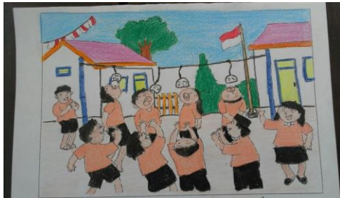
Hasil mewarnai dari Oma