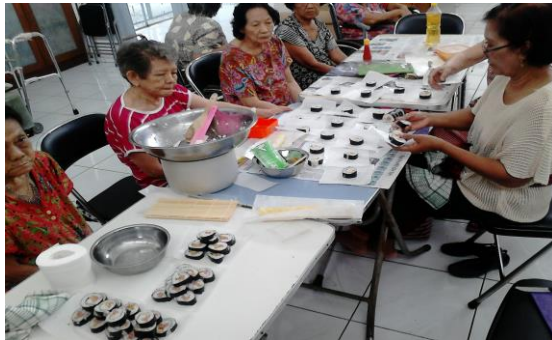
Lansia membuat Sushi di Rumah Usiawan Panti Surya Surabaya