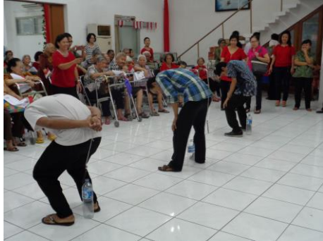
Lomba Dalam rangka memperingati 41 tahun Rumah Usiawan Panti Surya Surabaya.