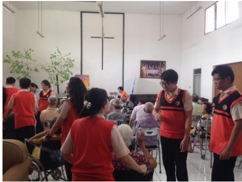
Kunjungan dari SMAK Hendrikus Surabaya