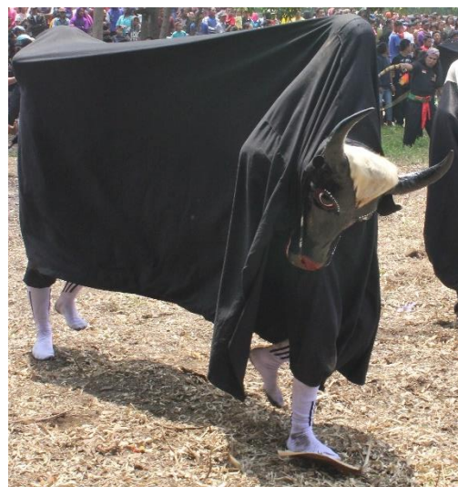
Gambar 2.4. Banteng