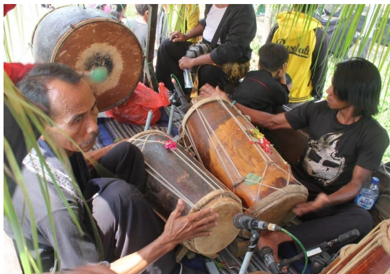
Gambar 2.7. Pemain musik kendang dan jidor