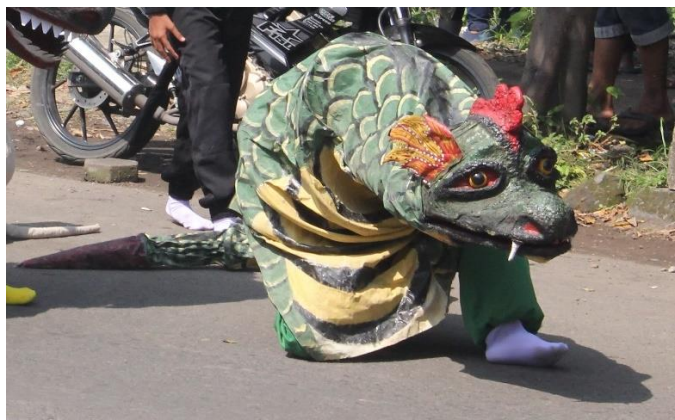
Gambar 2.6. Ular naga