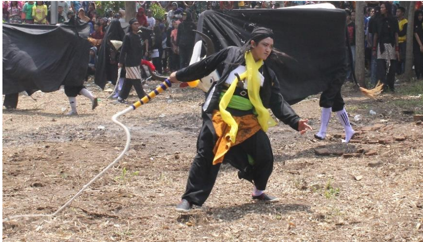
Gambar 2.2. Pawang bantengan ( dadungawuk )

Permainan kesenian Bantengan dimainkan oleh dua orang yang berperan sebagai kaki depan sekaligus pemegang kepala Bantengan dan pengontrol tari Bantengan serta sebagai kaki belakang yang juga berperan sebagai ekor Bantengan . Kostum Bantengan biasanya terbuat dari kain hitam dan topeng yang berbentuk kepala banteng yang terbuat dari kayu, tetapi tidak menutup kemungkinan apabila kostum Bantengan dikembangkan variasinya. Bantengan juga selalu diiringi oleh macanan . Kostum macanan terbuat dari kain yang biasanya berwarna kuning belang oranye yang dipakai oleh seorang lelaki, tetapi sekarang kostum macanan ada berbagaimacam warna untuk menambah variasi.