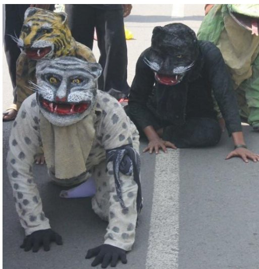
Gambar 2.3. Macanan

Permainan kesenian Bantengan dimainkan oleh dua orang yang berperan sebagai kaki depan sekaligus pemegang kepala Bantengan dan pengontrol tari Bantengan serta sebagai kaki belakang yang juga berperan sebagai ekor Bantengan . Kostum Bantengan biasanya terbuat dari kain hitam dan topeng yang berbentuk kepala banteng yang terbuat dari kayu, tetapi tidak menutup kemungkinan apabila kostum Bantengan dikembangkan variasinya. Bantengan juga selalu diiringi oleh macanan . Kostum macanan terbuat dari kain yang biasanya berwarna kuning belang oranye yang dipakai oleh seorang lelaki, tetapi sekarang kostum macanan ada berbagaimacam warna untuk menambah variasi.