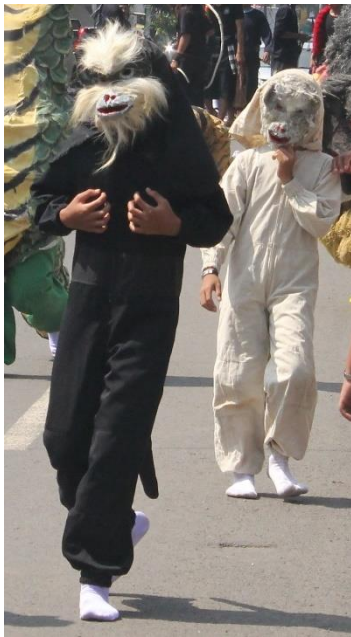
Gambar 2.5. Kera

Pada awalnya banteng melawan banteng, selanjutnya banteng melawan macan, melawan ular naga, melawan kera dan melawan binatang-binatang lain ( buron wana ). Selain memiliki makna dalam perjuangan rakyat melawan penjajah beserta provokatornya, ini semua juga karena tuntutan agar pertunjukan lebih menarik bagi penonton.