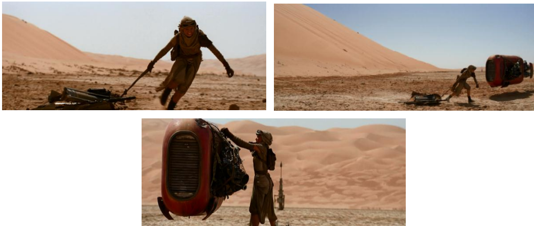
Gambar 4.13 Rey menaikkan barang bekas ke kendarannya dan membawanya untuk dijual

Dalam adegan ini, Rey dilihat dari kode perilaku yang sedang menarik barang-barang bekas yang dia kumpulkan untuk dimasukkan ke dalam jaring di bagian samping kendaraannya. Perilakunya tersebut digambarkan dalam pekerjaan sebagai seorang pemulung. Menurut Fitriana (2011, p.38), pemulung merupakan pekerjaan dengan mengumpulkan barang bekas dan memiliki resiko cukup besar. Berbeda dengan pekerjaan yang dilansir oleh money.usnews.com , bahwa perempuan mendominasi industri jasa atau disebut pink-collar seperti sekretaris, perawat, asisten dokter gigi, dan guru. (Money.usnews, 2016). Pemulung juga termasuk pekerjaan di luar rumah yang mengeluarkan keringat dan tidak seperti