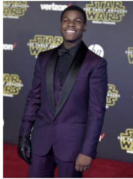
Gambar 4.6 Finn (FN-2187) yang diperankan oleh John Boyega