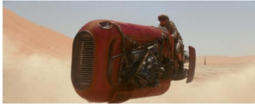
Gambar 4.14 Rey mengendarai kendaraannya

stereotipe perempuan yang pekerjaannya hanya dalam ranah domestik (Holtzman, 2011).