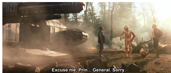
Gambar 4.22 C-3PO sempat salah memanggil Leia, masih dengan sebutan ‘putri’

Didukung dengan camera angle yang mengambil medium long shot yang memperlihatkan kegiatan apa yang dilakukan oleh Rey dan Finn dan perilaku keduanya dalam kegiatan tersebut. Dari adegan ini digambarkan bahwa perempuan juga melakukan apa yang laki-laki lakukan dalam hal pekerjaan di film terdahulu.