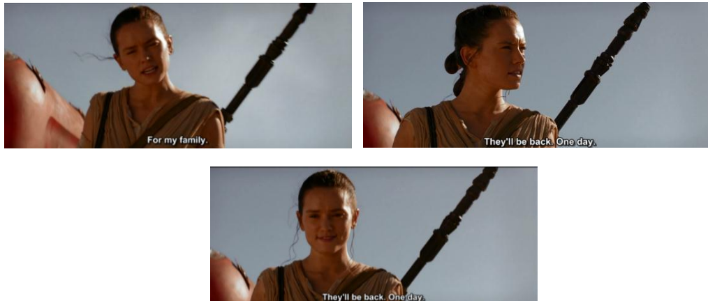
Gambar 4.26 Rey berbicara kepada BB-8 mengenai keluarganya

Sehingga dari adegan ini menggambarkan Rey bersikap agresif dan heroic yang membongkar stereotip perempuan memiliki sifat lemah lembut dan sabar (William & Bennett, 1975) tetapi Rey masih memiliki sifat penolong dan penuh belas kasih yang digambarkan oleh perempuan (Wood, 2009).