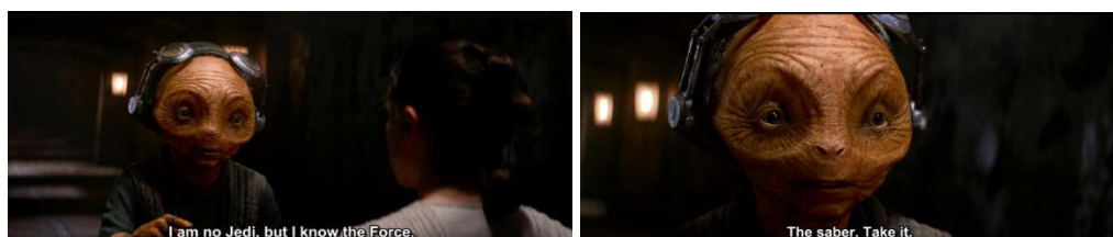
Gambar 4.30 Maz menyarankan Rey untuk mengambil lightsaber

Dilihat dari kode perilaku, Maz memanggil nama Han Solo dengan suara tegas dan keras. Seketika itu juga semua orang di dalam bar tersebut memusatkan pandangan mereka kepada Han Solo dan pemain musik yang tadinya sedang bermain berhenti sementara. Hal tersebut menggambarkan bahwa lewat kode dialog Maz ini membongkar stereotip perempuan yang tidak bisa bersuara keras (Williams & Bennett, 1975).