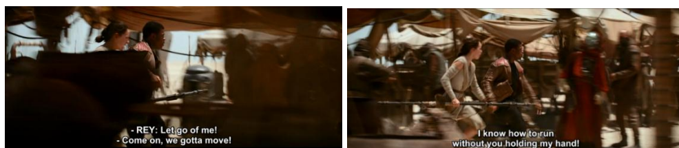
Gambar 4.36 Rey dan Finn berlari dari serangan First Order

Dalam kejar-kejaran tersebut, Rey tidak suka ketika Finn memegang tangannya terus selama berlari yang dapat dilihat dari kode dialog dengan nada penekanan.