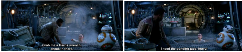
Gambar 4.20 Rey sedang memperbaiki mesin pesawat

Rey sibuk memperbaiki bagian pesawat yang rusak di ruang mesin sedangkan Finn berada di atas ruang mesin seperti dalam adegan 4.9. Teknisi juga merupakan salah satu pekerjaan distereotipkan dengan laki-laki. Seperti yang dilakukan oleh Brian O’Conner dan Dome dalam film Fast and Furious . Dalam film tersebut, keduanya adalah laki-laki dan bisa memperbaiki juga memodifikasi mesin mobil balap mereka.