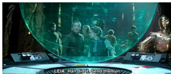
Gambar 4.31 Leia sedang memimpin Resistance

Dari kedua kode tersebut menggambarkan bahwa Maz sebagai perempuan memiliki keyakinan dan percaya diri. Ditambah dengan kode ekspresi dari Maz yaitu tatapan serius dan penuh harapan kepada Rey dengan memfokuskan mata dan mengerutkan dahinya. Sehingga membongkar stereotip perempuan yang tidak percaya diri (Williams & Bennett, 1975).