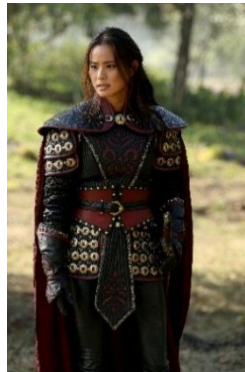
Gambar 4.42 Mulan dalam serial televisi Once Upon a Time

Dalam gambar ini merupakan adegan Captain Phasma saat berada di Planet Jakku. Penggambaran Phasma lewat kode kostum yang menggunakan baju zirah berwarna perak dan jubah berwarna hitam-merah sama seperti yang digambarkan tokoh Mulan dalam serial televisi Once Upon a Time . Warna perak memiliki kesan sesuai dengan karakter perak yaitu glamour, mahal, dan kemilau ( http://ensiklo.com/ ). Sehingga menjadikan Phasma menjadi tokoh yang berbeda dengan stroomtrooper lainnya.