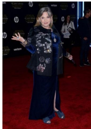
Gambar 4.8 Leia Organa Solo diperankan oleh Carrie Fisher

mendapatkan peran kecil dalam film The Conversation dan Apocalypse Now (1979). Ford kemudian menjadi superstar sebagai Han Solo di dalam sekuel Star Wars (1977-1983) dan sebagai Indiana Jones dalam Raiders of the Lost Ark (1981-1989). Ford banyak memainkan peran sebagai pemeran utama dalam film Blade Runner (1982), Witness (1985), Patriot Games (1992), The Devil's Own dan Air Force One (1997). Di tahun 2010, Ford bermain di Cowboys & Aliens , melawan Daniel Craig dan Morning Glory bersama Rachel McAdams dan Diane Keaton. Ford kemudian bermain dalam film 42 di tahun 2013. Han Solo adalah suami dari Leia Organa dan seorang pilot Millennium Falcon. Han berusaha menarik anaknya, Kylo Ren kembali ke lightside .