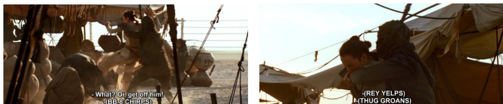
Gambar 4.34 Rey melawan ketika anak buah Unkar berusaha menangkap BB-8

Dari gambar 4.32, Rey melakukan perlawanan terhadap anak buah Unkar karena mereka berusaha untuk menangkap BB-8 sehingga hal tersebut membuatnya marah. Kemarahan Rey selain dilihat dari kode perilaku, terlihat juga dari kode dialog.