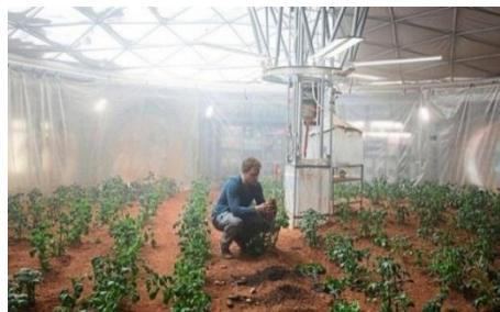
Gambar 4.17 Mark Watney bercocok tanam untuk bertahan hidup di Planet Mars

Rey digambarkan dalam adegan ini sebagai seseorang perempuan yang tinggal seorang diri di tempat tinggalnya. Dari gambar 4.16 ini dilihat dari level realitasnya, gerakan Rey saat menyiapkan roti yang mengembang dengan sendirinya, Rey kemudian mengaduk panci yang sudah terlebih dahulu matang dan menuangkan sup tersebut ke piring yang dipegangnya. Setelah itu terlihat Rey memakan makanannya seorang diri.