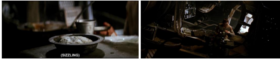
Gambar 4.16 Rey sedang menyiapkan makanannya sendiri

Rey digambarkan dalam adegan ini sebagai seseorang perempuan yang tinggal seorang diri di tempat tinggalnya. Dari gambar 4.16 ini dilihat dari level realitasnya, gerakan Rey saat menyiapkan roti yang mengembang dengan sendirinya, Rey kemudian mengaduk panci yang sudah terlebih dahulu matang dan menuangkan sup tersebut ke piring yang dipegangnya. Setelah itu terlihat Rey memakan makanannya seorang diri.