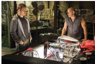
Gambar 4.21 Brian O’Connor dan Dome sedang memperbaiki mesin mobil

Rey sibuk memperbaiki bagian pesawat yang rusak di ruang mesin sedangkan Finn berada di atas ruang mesin seperti dalam adegan 4.9. Teknisi juga merupakan salah satu pekerjaan distereotipkan dengan laki-laki. Seperti yang dilakukan oleh Brian O’Conner dan Dome dalam film Fast and Furious . Dalam film tersebut, keduanya adalah laki-laki dan bisa memperbaiki juga memodifikasi mesin mobil balap mereka.