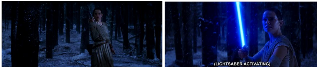
Gambar 4.40 Rey memegang lightsaber yang dimiliki Luke Skywalker

berhasil melarikan diri tanpa diketahui oleh First Order. Dari kode perilaku dan kode dialog dalam adegan 4.39, Rey membongkar stereotip perempuan yang bodoh (Williams & Bennett, 1975) dan justru melakukan hal sebaliknya.