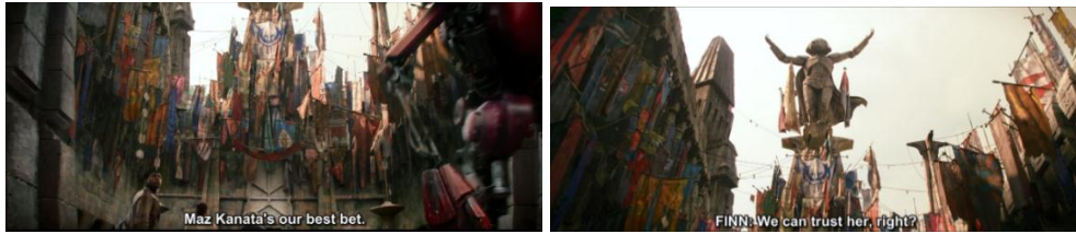
Gambar 4.44 Tampak luar istana Maz Kanata di Takonada

Adegan ini merupakan bagian depan atau tampak luar dari istana Maz Kanata di Takonada. Dari kode lingkungan, terlihat istana yang dipenuhi oleh bendera warna-warni di bawah patung Maz berada di paling atas. Patung tersebut menyerupai tokoh Maz secara keseluruhan dengan mengangkat tangannya dan menengadah ke atas juga memakai jubah. Tapi justru jubah tersebut yang berbeda dengan pakaian yang digunakan Maz. Sehingga Maz memiliki kekuasaan terhadap kerajaannya. Dilihat dari level representasi kode camera angle , extreme long shot untuk membingkai gambar bangunan agar penonton mengenal lokasi cerita. Low angle juga menggambarkan Maz Kanata sebagai ratu dalam kerajaannya memiliki kekuasaan yang besar (Askurifai Baskin, 2009). Sehingga dari adegan 4.32 di atas, Maz yang dilihat dari istana dan patungnya membongkar stereotip perempuan yang lemah (Williams & Bennett, 1975).