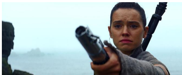
Gambar 4.33 Rey memberikan lightsaber kepada Luke Skywalker

Sehingga dari dialog tersebut menggambarkan bahwa Leia memberikan harapannya kepada Rey yang akan bertemu dengan Luke Skywalker. Force di sini dilambangkan sebagai energy yang memberikan kekuatan kepada Jedi (Starwars.wikia.com, 2016). Diperkuat dengan sepanjang Star Wars Saga, Leia adalah perempuan pertama yang mengatakan tagline tersebut. Lalu, dilihat dari kode camera angle yaitu low angle yang semakin menggambarkan sosok Leia yang kuat dan membongkar stereotip perempuan yang lemah (Maryanta, 2011).