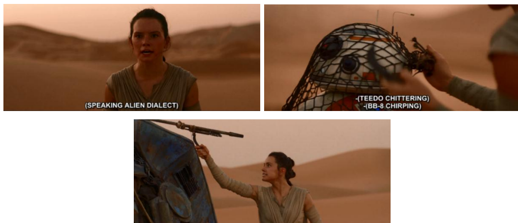
Gambar 4.23 Rey menolong BB-8 yang ingin ditangkap oleh Teedo

Dari adegan 4.23, dilihat dari level realitas, perilaku Rey memarahi Teedo yang menangkap BB-8 kemudian mendesak dan mengancamnya dengan pisau. Ekspresi raut wajah yang ketus dengan mulut yang memperlihatkan gigi agar Teedo mau melepaskan BB-8. Pengambilan gambarnya juga dilihat dari level representasi yaitu medium close up yang memperlihatkan perilaku sekaligus ekspresi Rey saat Rey marah dan mengancam Teedo. Kepekaan Rey terhadap suara BB-8 dari kejauhan membuatnya mencari tahu apa yang sedang terjadi dan ketika Rey melihat Teedo, Rey lalu memarahinya dan memaksa Teedo untuk melepaskannya. Penggambaran sikap heroic ini sering dilakukan oleh superhero