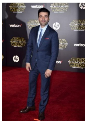
Gambar 4.10 Poe Dameron yang diperankan oleh Oscar Isaac