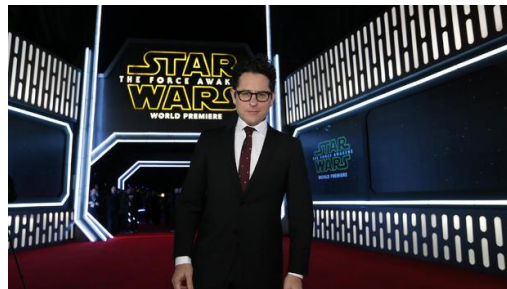
Gambar 4.3 J.J. Abrams