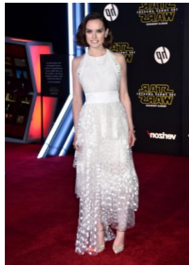
Gambar 4.4 Rey yang diperankan oleh Daisy Ridley