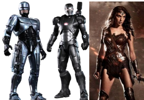
Gambar 4.43 Robocop. War Machine, dan Wonder Woman

Phasma yang digambarkan seperti robot yang berwarna perak ini sama seperti polisi robot yaitu Robocop atau War Machine dalam film Avengers . Dimana kedua tokoh tersebut diperankan oleh laki-laki sedangkan Captain Phasma diperankan oleh Gwendoline Christie yang adalah seorang perempuan. Tetapi, kostum Phasma tidak seperti tokoh Wonder Woman yang menampilkan sensualitas.