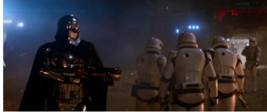
Gambar 4.41 Captain Phasma saat berada di Planet Jakku.