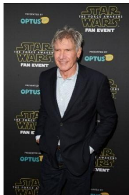
Gambar 4.7 Han Solo yang diperankan oleh Harrison Ford

Lahir pada 17 Maret 1992 di London, Inggris. Setelah menyelesaikan studinya di South Thames College, John memainkan peran pertamanya pada Attack the Block pada tahun 2011 kemudian dalam TV movie My Murder (2012), sebagai pemeran pendukung dalam film Half of a Yellow Sun (2013) dan Imperial Dreams (2014). Kemudian berperan sebagai Finn dalam Star Wars VII: The Force Awakens (2015). Melalui perannya ini lah, John meraih penghargaan sebagai International Fame . Finn adalah stroomtrooper yang berkhianat yang membantu Resistance untuk masuk ke dalam pangkalan Starkiller dan menghancurkannya.