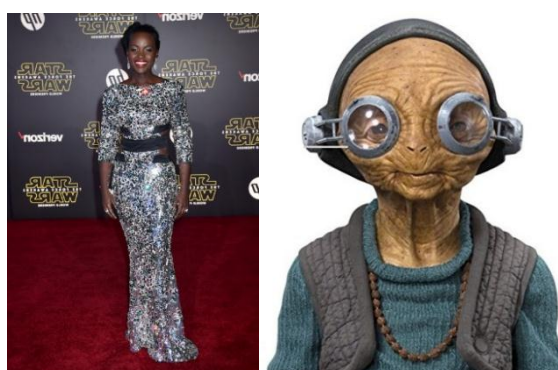
Gambar 4.11 Maz Kanata yang diperankan oleh Lupita Nyong'o

Lahir pada tahun 1979 di Guatemala, aktor Oscar Isaac mencintai dunia acting dan musik ini menjalai hidupnya di Miami, Florida. Setelah menyelesaikan sekolahnya di Jullard School pada tahun 2005, Isaac memulai perannya dalam film. Diawali dengan film The Nativity Story (2006). Kemudian Isaac juga memainkan peran pendukung dalam film Robin Hood (2010), Drive (2011) and W.E. (2011). Kemudian proyek-proyek berikutnya yaitu A Most Violent Year (2014) dan Ex Machina (2015). Isaac juga memenangkan Golden Globe untuk HBO mini-series Show Me a Hero (2015). Poe adalah pilot terbaik Resistance yang bertemu dengan tetua desa di Jakku yang memberi info mengenai lokasi Luke Skywalker.