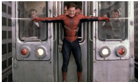
Gambar 4.24 Spiderman berusaha menghentikan kerta api

dalam film science fiction salah satu contohnya Spiderman . Seperti adegan Spiderman yang mau menolong penumpang kereta api bawah tanah yang sedang berada dalam bahaya. Spiderman yang mau menolong penumpang kereta api tanpa memiliki hubungan atau kedekatan sebelumnya tetapi mau menjaga keamanan dan kenyamanan di sekitarnya. Karakter Spiderman digambarkan dengan laki-laki sehingga melalui adegan ini adanya pembalikan peran laki-laki menjadi peran yang diperankan oleh perempuan.