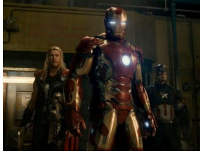
Gambar 4.27 Thor, Iron Man, dan Captain America saat berhadapan dengan musuh