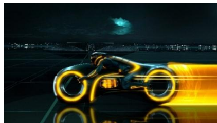
Gambar 4.15 Seorang laki-laki mengendarai motor berkecepatan tinggi

Gaya menunggang yang dilakukan Rey seperti dalam gambar 4.14, seperti gaya yang dilakukan oleh seorang laki-laki di dalam film Tron Legacy . Begitu juga dalam iklan motor Yamaha Jupiter MX yang dibintangi oleh Valentino Rossi, pembalap MotoGP. Iklan tersebut memperlihatkan bahwa citra maskulin melekat pada si pengendara motor. Motor yang dikendarai merupakan jenis motor berkecepatan tinggi terlihat saat Rey mengendarainya kemudian motor tersebut melaju dengan cepat.