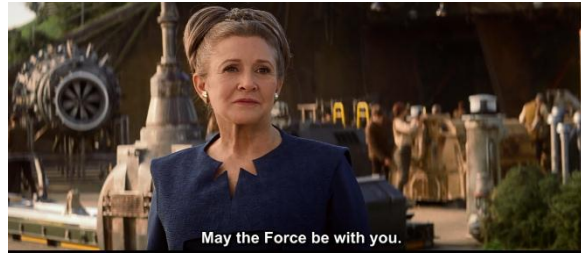
Gambar 4.32 Leia yang mengiringi kepergian Rey yang akan menemui Luke

Lewat kode dialog yang dikatakan oleh Leia dari gambar 4.20, merupakan tagline khusus untuk Star Wars saga yang merupakan kalimat harapan yang ditujukan untuk individu atau kelompok memperoleh suatu keberuntungan. Kalimat ini biasa diucapkan untuk seseorang ketika ingin menghadapi tantangan yang akan datang (Starwars.wikia.com, 2016).