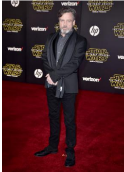
Gambar 4.9 Luke Skywalker yang diperankan oleh Mark Hamill

Leia adalah seorang pemimpin Resistance yang memiliki misi untuk menemukan keberadaan saudara kandungnya, Luke Skywalker.