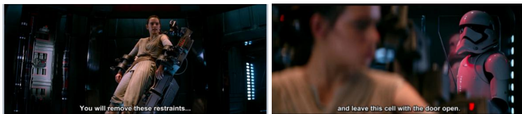
Gambar 4.39 Rey menggunakan force untuk memerintah Stroomtrooper yang sedang berjaga

perilaku ini lah, Rey mematahkan stereotip perempuan yang tidak percaya diri (Williams & Bennett, 1975). Dari kode ekspresi terlihat juga tatapan Rey yang melihat Han dengan sedikit bingung dengan menggerakkan kedua bola matanya mengikuti pergerakan Han yang terlihat lebih panik. Sehingga dari adegan ini Rey membongkar stereotip perempuan yang bodoh (Williams & Bennett, 1975). Dari camera angle, medium shot untuk memperlihatkan kedua karakter sedang melakukan sesuatu dan memperlihatkan ekspresi keduanya.