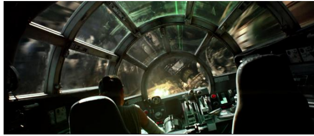
Gambar 4.18 Rey menjadi pilot Millennium Falcon

Dalam adegan 4.18 ini, Rey berada di dalam kokpit pesawat Millennium Falcon dan memperlihatkan kode perilaku yaitu mengendarainya sebagai pilot tanpa didampingi co-pilot. Berbeda dengan film Nonstop yang menunjukkan bahwa sebuah pesawat dijalankan oleh seorang pilot dan co-pilot.