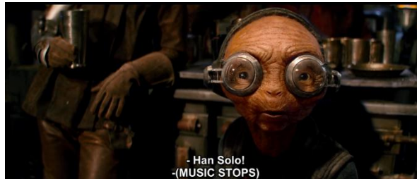
Gambar 4.29 Maz Kanata menyambut Han Solo yang baru saja memasuki istananya

dahi sambil mengangguk. Dari ekspresi tersebut Rey berusaha untuk meyakinkan Han bahwa Rey bisa menjaga dirinya sendiri. Rey tidak ingin ada orang lain yang menganggap remeh dirinya.