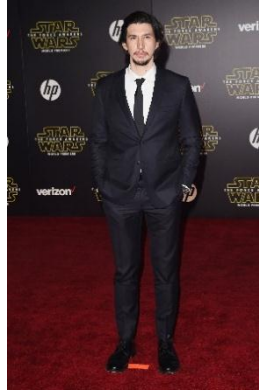
Gambar 4.5 Kylo Ren yang diperankan oleh Adam Driver