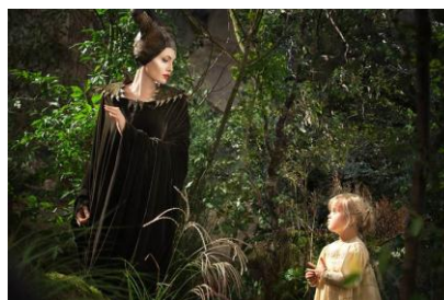
Gambar 4.25 Maleficent bersama dengan anak kecil

Tetapi saat Rey menolong BB-8 juga mencerminkan sifat perempuan sebagai seseorang penolong yang penuh belas kasih. Sama seperti yang dilakukan oleh tokoh Maleficent dalam film Maleficent . Maleficent sebagai tokoh yang memerankan peran jahat (antagonis) digambarkan masih memiliki sifat belas kasihan terhadap anak. Digambarkan dalam adegan 4.14 ketika seorang anak kecil ingin digendong dan Maleficent sempat menolaknya. Tetapi Maleficent menjadi luluh hati melihat anak kecil tersebut sehingga dia mau menggendongnya.