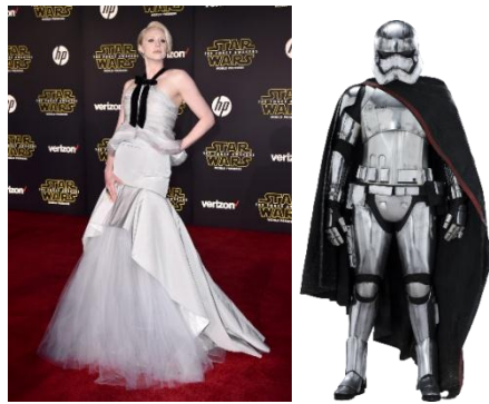
Gambar 4.12 Capt. Phasma diperankan oleh Gwendoline Christie

Lahir pada tahun 1983 di Mexico City, Mexico. Lupita memulai aktingnya sebagai remaja Kenya dan bekerja di balik layar dalam film The Constant Gardener . Ia menyutradarai dokumenter berjudul In My Genes dan membintangi serial TV Shuga . Nyong'o mendapatkan respons luar biasa melalui perannya sebagai Patsey dalam film The Constant Gardener (2013). Untuk hal tersebut, dia memenangkan Academy Award tahun 2014 sebagai 'best supporting actress'. Kemudian tahun 2014 dalam film Non-Stop dan Nyong'o berpartisipasi dalam New York debut dengan Public Theater's Off-Broadway Eclipsed . Maz adalah ratu bajak laut yang memiliki sifat bijaksana sama seperti Master Yoda. Maz kemudian membantu Rey dan Han untuk bertemu Resistance.