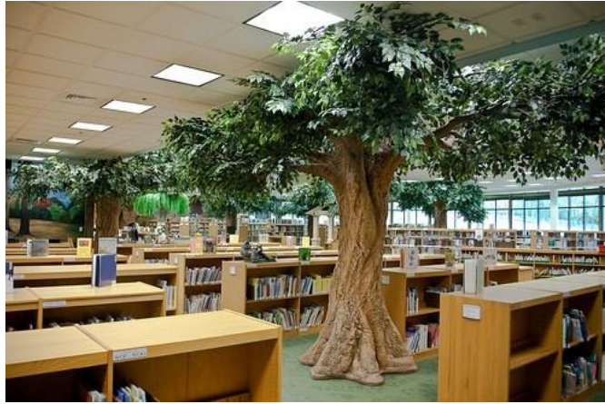
Gambar 4.22. Interior Perpustakaan Brentwood