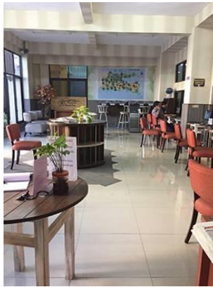
Gambar 4.8. Ruang Multimedia