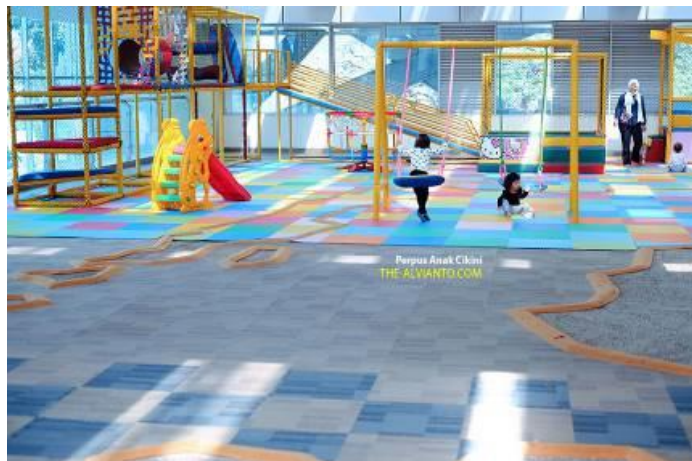
Gambar 4.4. Ruang Bermain ( Playground )