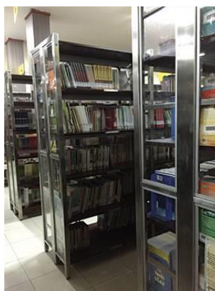
Gambar 4.9. Area Koleksi Buku