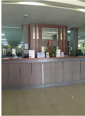
Gambar 4.7. Front Desk Perpustakaan