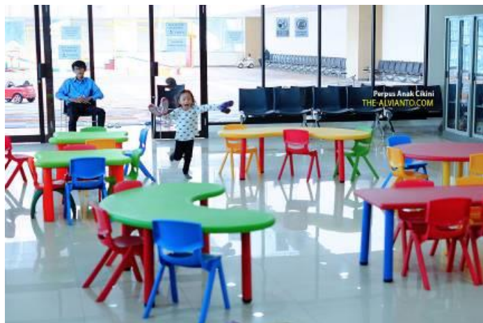
Gambar 4.2. Ruang Baca Anak