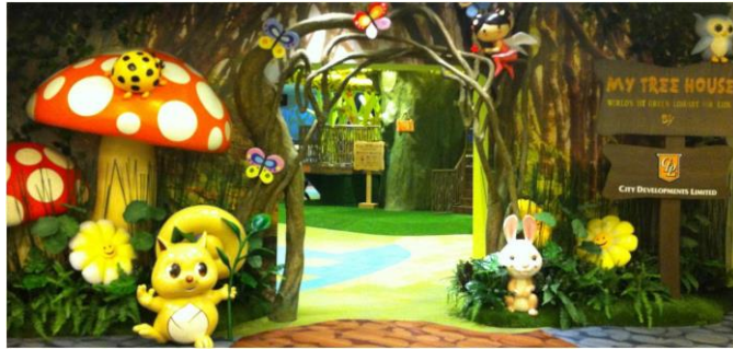
Gambar 4.12. Pintu Masuk Perpustakaan My Tree House