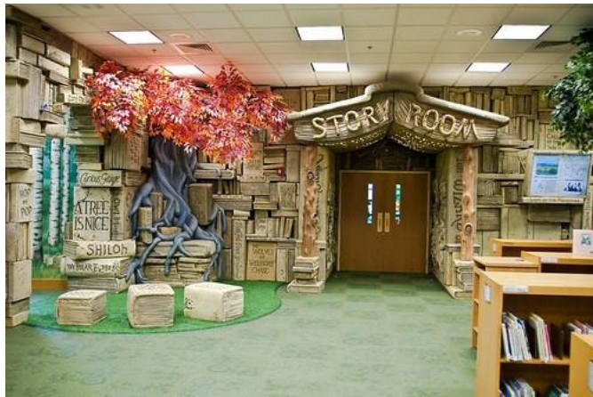
Gambar 4.23. Area Baca Perpustakaan Brentwood