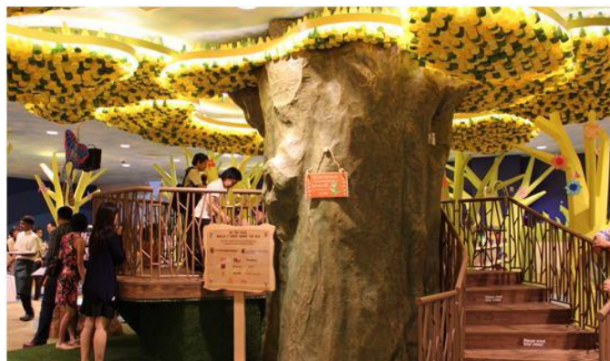
Gambar 4.13. Interior My Tree House