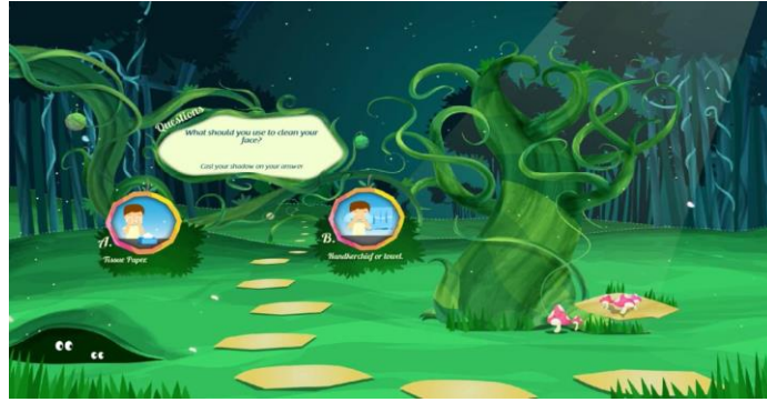
Gambar 4.15. The Knowledge Tree