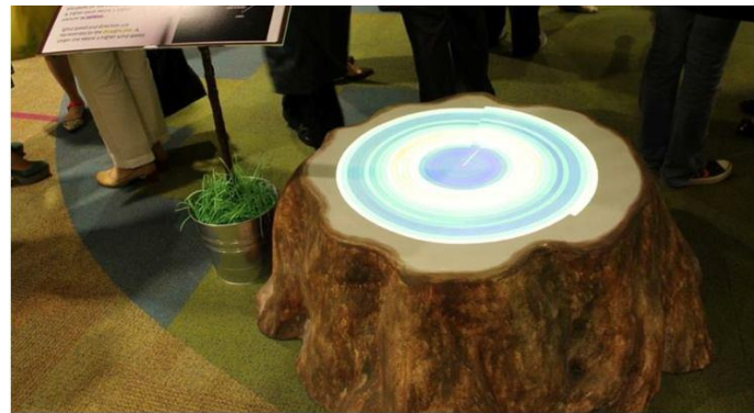
Gambar 4.16. The Knowledge Stump