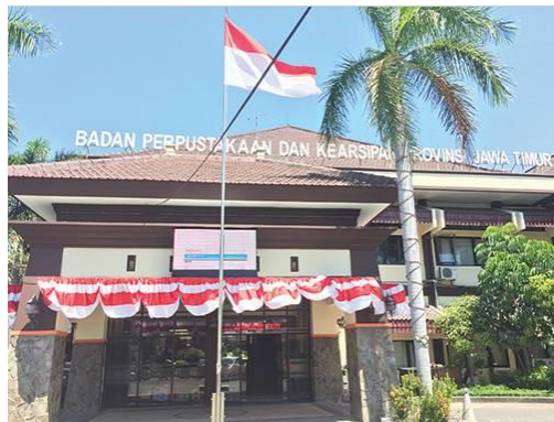
Gambar 4.5. Main Entrance Perpustakaan

Desain interior dari perpustakaan ini menggunakan gaya desain modern. Penataan ruang dan perabot terlihat rapi, bersih, dan nyaman. Sirkulasi dan papan petunjuk ( signage ) jelas dan dilengkapi dengan beberapa teknologi modern seperti pengisian buku tamu menggunakan komputer.