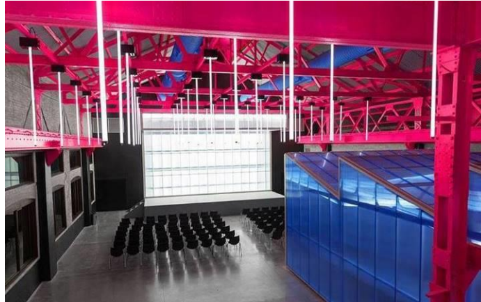
Gambar 4.20. Teater dan Pusat Kebudayaan