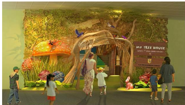
Gambar 4.11. Main Entrance dari Perpustakaan My Tree House

My Tree House adalah perpustakaan anak pertama yang menggunakan konsep green di Singapura. Desain dari perpustakaan ini memiliki tema, yaitu “ Enchanted Forest in the City ”. Tema ini dipilih karena merupakan sebuah imajinasi, yang sering muncul dalam cerita dongeng anak, yang dapat mendukung konsep green design . Material yang digunakan untuk seluruh elemen interior, baik lantai, dinding, maupun plafon merupakan material yang ramah lingkungan. Produk-produk seperti lampu LED yang digunakan juga merupakan produk yang hemat energi, sehingga mendukung konsep green . Perpustakaan ini juga memiliki fasilitas belajar yang inovatif, yang dapat menarik perhatian anak, seperti The Knowledge Tree dan The Weather Stump .