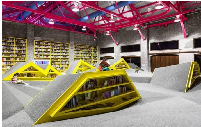
Gambar 4.18. Interior Perpustakaan Conarte