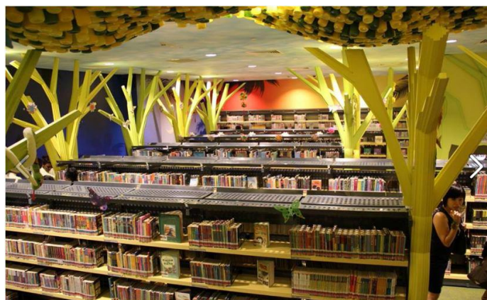
Gambar 4.14. Rak Buku yang Terbuat dari Bahan Daur Ulang