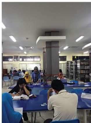
Gambar 4.6. Area Baca Perpustakaan