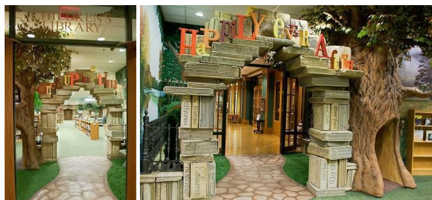
Gambar 4.21. Main Entrance Perpustakaan dari luar (kiri) dan dari dalam (kanan)

Perpustakaan ini memiliki desain dengan tema hutan yang unik, dipenuhi dengan banyak pohon, patung binatang, dan buku-buku raksasa yang mengundang anak-anak untuk masuk ke dalam perpustakaan. Meskipun tidak terlihat adanya area bermain di dalam perpustakaan, namun desain perpustakaan secara keseluruhan cukup menarik untuk dieksplorasi bagi anak-anak. Hal ini dikarenakan desain dari perpustakaan ini sangat memperhatikan detail. Area baca pun terlihat menarik dengan adanya buku-buku raksasa sebagai tempat duduk.