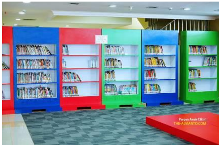
Gambar 4.1. Area Koleksi Buku

Perpustakaan anak ini terletak di lantai 2 perpustakaan daerah Cikini, Jakarta. Perpustakaan ini menyediakan berbagai macam koleksi buku, ruang baca, koleksi permainan yang edukatif, dan ruang bermain yang luas. Perpustakaan ini menggunakan bentuk-bentuk yang sederhana dan minimalis, dengan menggunakan warna-warna cerah, seperti merah, biru, hijau, dan kuning.