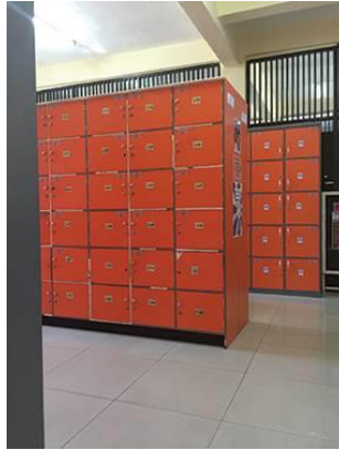
Gambar 4.10. Ruang Loker