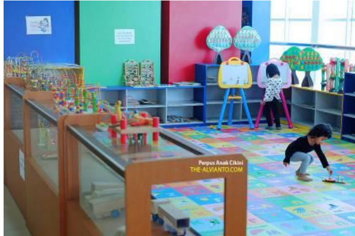
Gambar 4.3. Area Permainan Edukatif