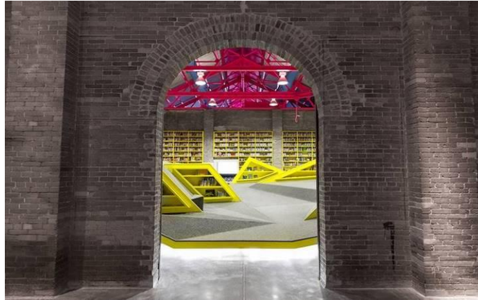
Gambar 4.17. Main Entrance Perpustakaan Conarte