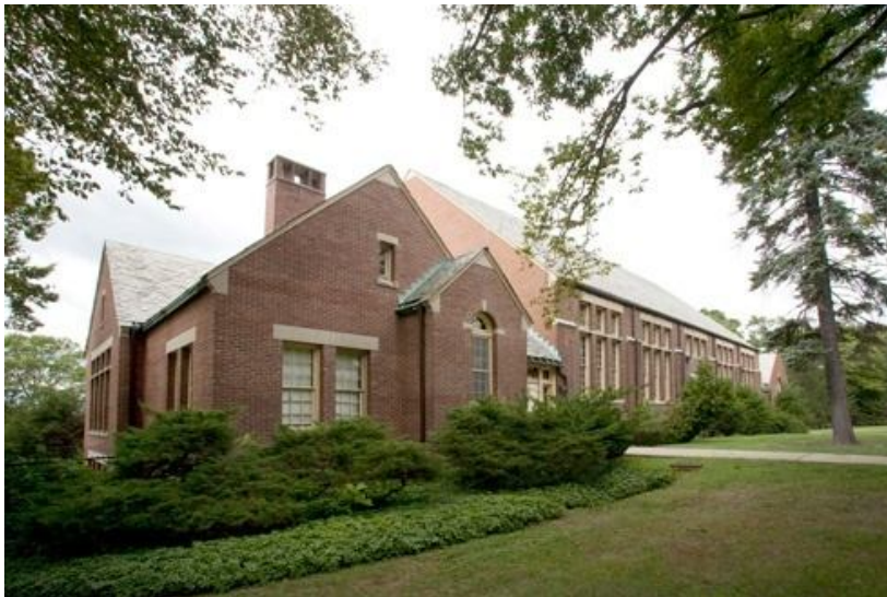
Gambar 4.5 Tampak bangunan center for autism and the developing brain

Center for Autism and the Developing Brain menyediakan wadah untuk setiap penderita autisme yang mengalami sindrom ASD dan gangguan perkembangan otak lainnya. Tempat ini adalah program yang dimiliki oleh New York Presbyterian, Weill Cornell Medical College dan Columbia College of Physicians and Surgeons dalam kemitraan dengan Yew York yang bergabung untuk autisme.