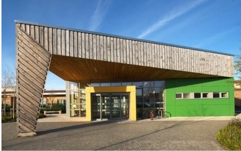
Gambar 4.4 Tampak bangunan the willow primary & special school