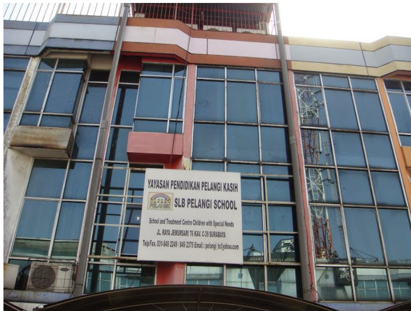
Gambar 4.2 Pelangi school and treatment center

Pelangi School and Treatment Center for Children with Special Needs ini merupakan sekolah serta tempat terapi untuk anak-anak autisme di Surabaya yang menerapkan sistem ABA ( Applied Behaviour Analysis ). Jumlah siswa yang berada di tempat terapi ini adalah 40 siswa, baik siswa terapi maupun siswa sekolah.