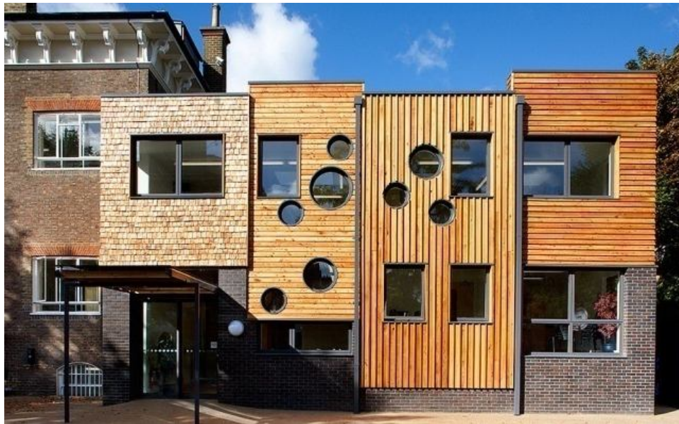
Gambar 4.3 Tampak bangunan the rainbow school

The Rainbow School ini merupakan sekolah serta tempat terapi untuk anak-anak autisme di London yang menerapkan sistem ABA ( Applied Behaviour Analysis ). Eksisting dari sekolah ini adalah sebuah villa dengan arsitektur bangunan Victorian pada tahun 1870an. Konsep dari bangunan ini adalah untuk membangun sesuatu yang menggunakan material yang ramah lingkungan serta desain yang nyaman sebagai bentuk dukungan bagi anak-anak autisme serta keluarganya.