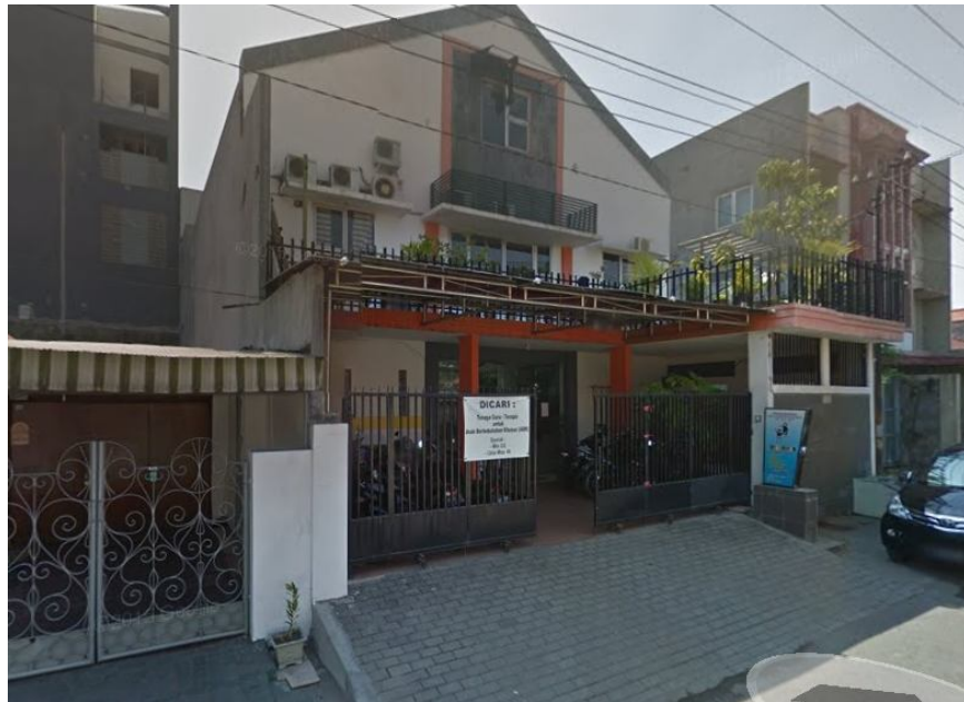
Gambar 4.1 Tampak bangunan AGCA Center