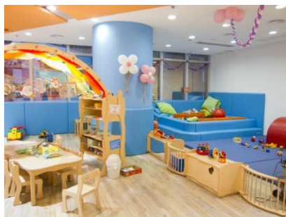
Gambar 3.13. Toddler play room