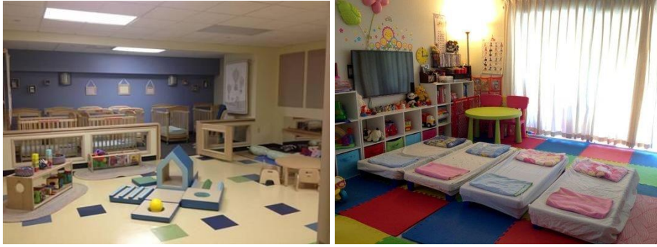
Gambar 3.17. Ruang tidur sesuai pembagian usia