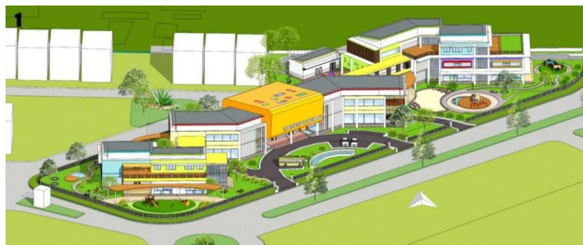
Gambar 3.4. Perspektif 1