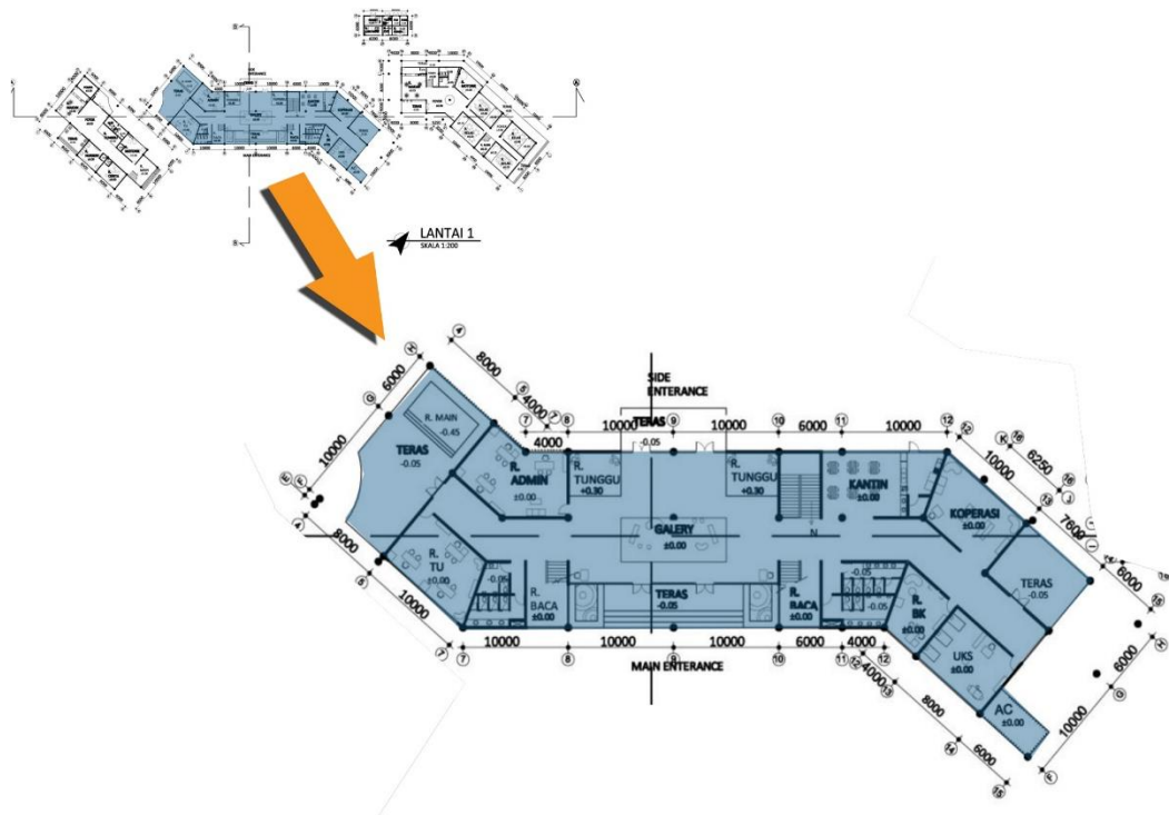
Gambar 3.6. Site terpilih

Site yang diambil untuk perancangan day care terletak di lantai 1 bangunan utama bagian tengah, dengan luasan total \pm 1200 \text{ m}^2 .