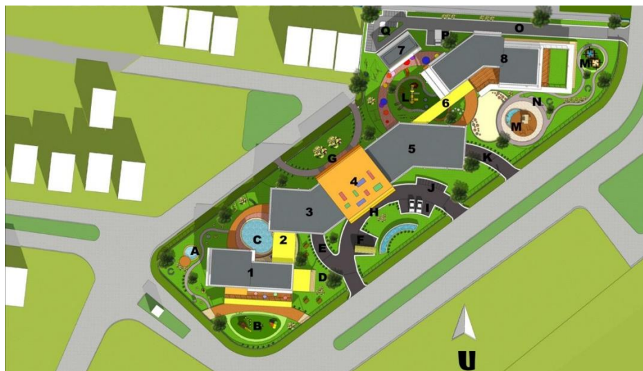
Gambar 3.2. Site plan