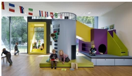
Gambar 3.11. Warna-warna yang cerah pada furniture

Rencana perancangan Bambini Day Care Centre dibuat sesuai dengan corporate identity dari Bambini Child Care & Pre-school . Ruangan untuk anak didesain sesuai dengan kategori usia mereka. Fasilitas yang akan dirancang meliputi fasilitas ruang bermain indoor, ruang aktivitas tenang, ruang aktivitas berantakan, ruang makan, ruang kesehatan, ruang staff, lobby, pantry, kamar mandi, ruang tunggu, service area, ruang tidur, ruang kelas berdasar pembagian usia anak. Rencana objek perancangan yang akan dibuat seperti berikut :