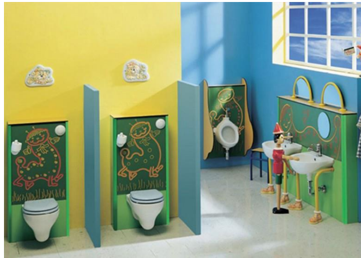
Gambar 3.18. Kamar mandi