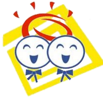
Gambar 3.7. Logo Bambini