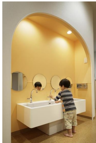
Gambar 3.15. Area cuci tangan