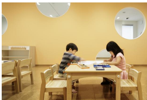
Gambar 3.16. Ruang makan