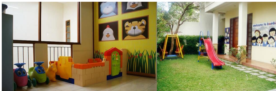
Gambar 3.10. Area bermain

Sumber : http://www.bambinichildcare.blogspot.com