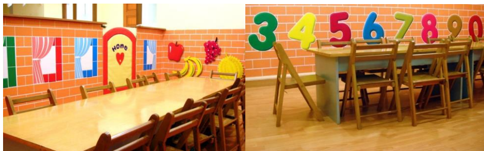
Gambar 3.8. Area Makan