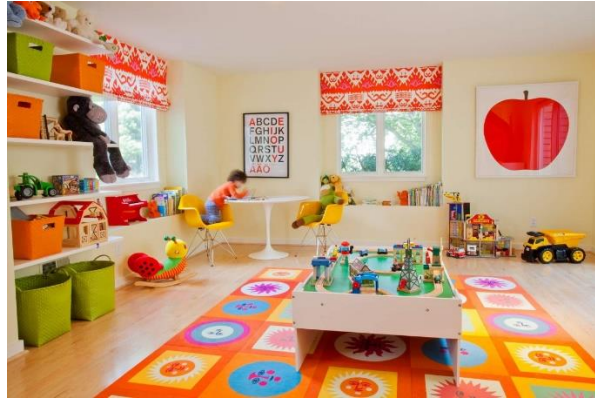
Gambar 3.14. Preschool play room