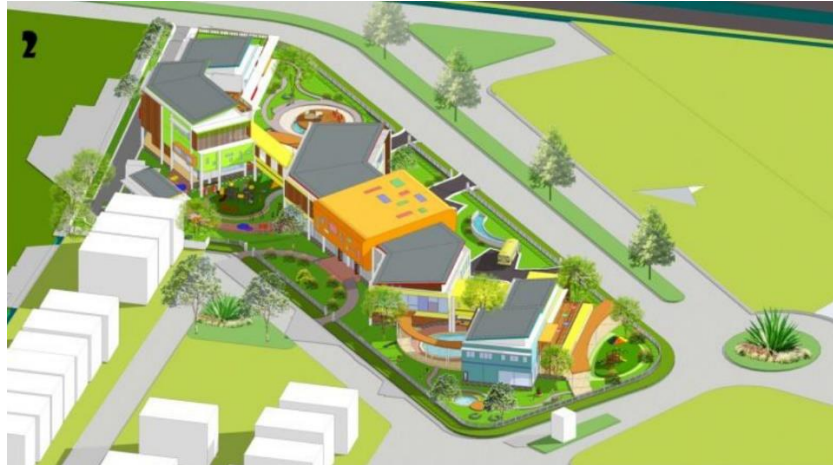
Gambar 3.5. Perspektif 2