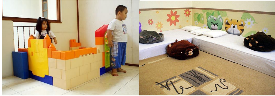
Gambar 3.9. Area bermain dan area tidur