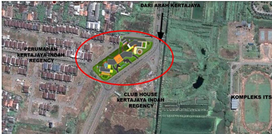
Gambar 3.1. Lokasi site