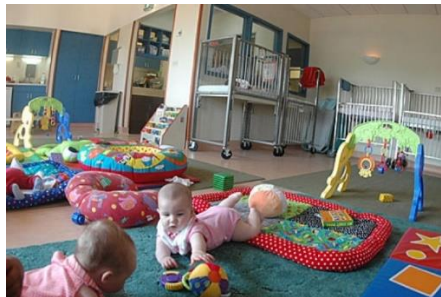
Gambar 3.12. Infant play room