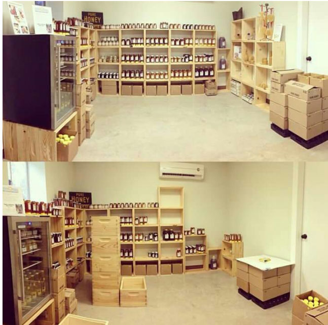
Gambar 4.10 Tampak dalam toko