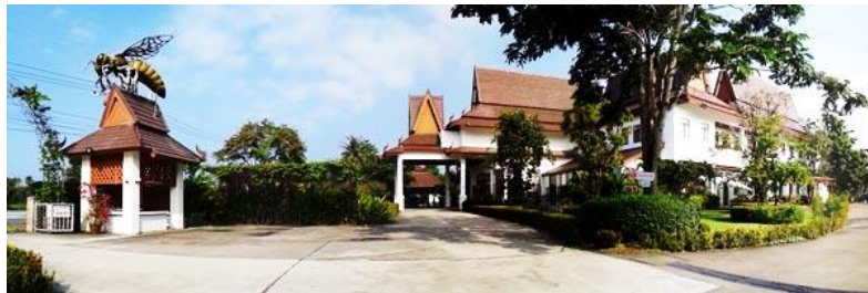
Gambar 4.3 Gambar Tapak Big Bee Farm

Sama halnya dengan di lokasi sebelumnya, disini pengunjung diajak berjalan mengelilingi peternakan lebah. Disini pengunjung juga dapat mencicipi berbagai macam jenis madu yang ada. Untuk pengunjung yang ingin mengetahui lebih banyak tentang madu, pengunjung akan diajak memasuki suatu ruangan semacam ruang kelas, dan disana pengunjung akan diberikan informasi lebih lanjut soal madu. Selain itu disini juga disediakan toko yang menjual berbagai macam produk olahan madu, mulai dari makanan, minuman, sampai dengan perawatan tubuh.