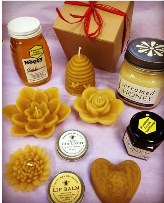
Gambar 4.7 Produk yang dijual