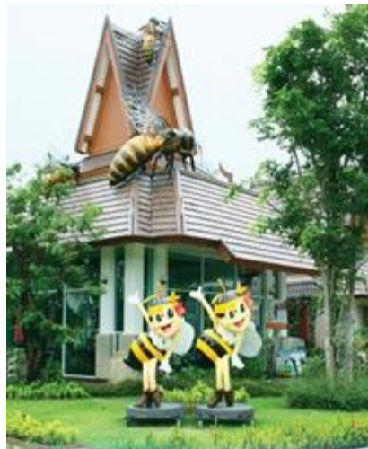
Gambar 4.4 Gambar Tapak Big Bee Farm