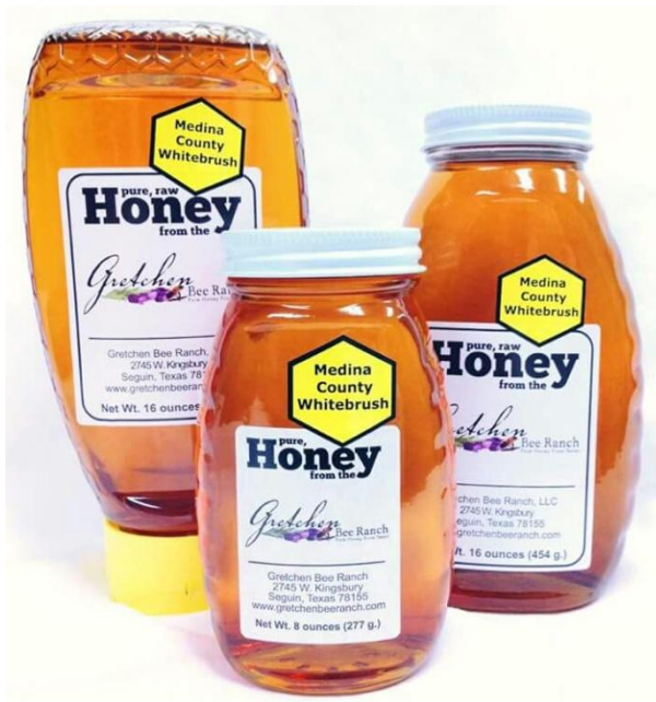
Gambar 4.8 Kemasan madu aneka ukuran