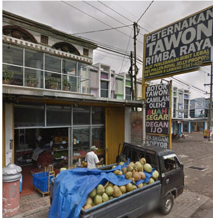
Gambar 4.1 Tapak Depan

Lokasi : Jalan Dr. Wahidin 8 Desa Bedali, Kecamatan Lawang, Kabupaten Malang.