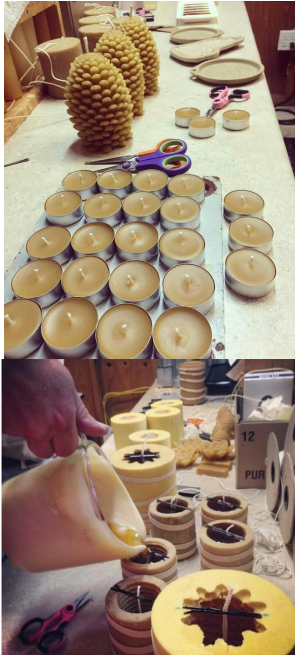
Gambar 4.9 Proses pembuatan lilin dari sarang lebah