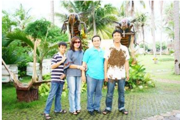
Gambar 4.5 Foto salah satu pengunjung pada Big Bee Farm