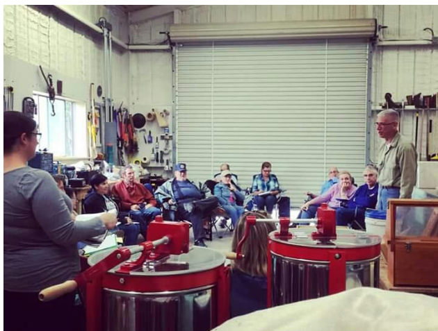
Gambar 4.6 Pelatihan tentang madu

Di lokasi ini, pengunjung diajak berkeliling peternakan lebah, dan disini pengunjung dapat mencoba langsung proses pemanenan madu. Disini pengunjung diberi pelatihan tentang proses beternak lebah, proses pemanenan madu, sampai dengan proses pembuatan lilin dari sarang lebah. Selain itu disini juga dijual berbagai macam madu dan juga lilin yang terbuat dari sarang lebah.