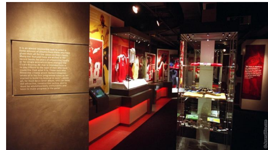
Gambar 4.4. The Arsenal Museum