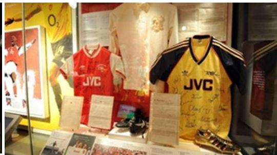
Gambar 4.6. The Arsenal Museum