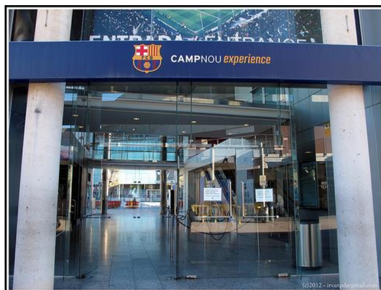
Gambar 4.9. Main entrance Camp Nou