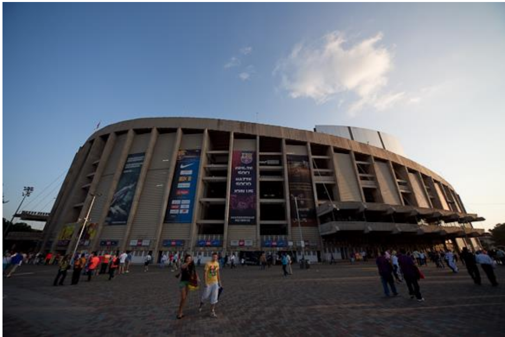
Gambar 4.8. Tapak depan Camp Nou

Ada juga sebuah area khusus yang didedikasikan untuk superstar Argentina Leo Messi, di mana Anda dapat melihat empat Ballons d'Or dan tiga Boots Emas, dan menikmati semua gol nya pada dua dinding interaktif.