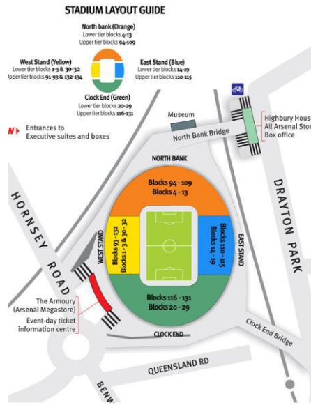
Gambar 4.1. Lokasi Emirates Stadium

Nelson, Eddie Kelly dan Perry Groves memimpin Legends Tours dioperasikan oleh museum.