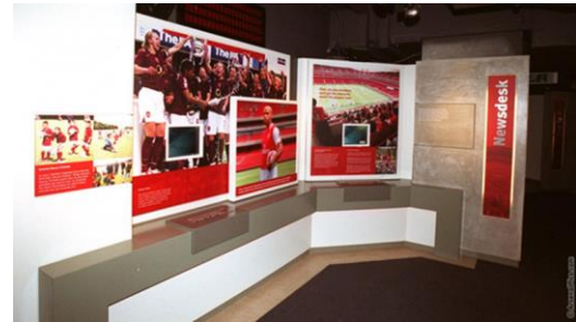
Gambar 4.5. The Arsenal Museum