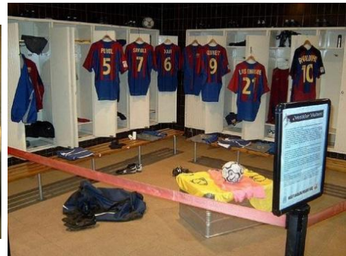
Gambar 4.11. F.C Barcelona Museum