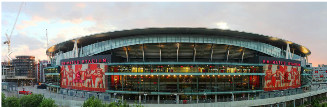
Gambar 4.2. Tapak depan Emirates Stadium