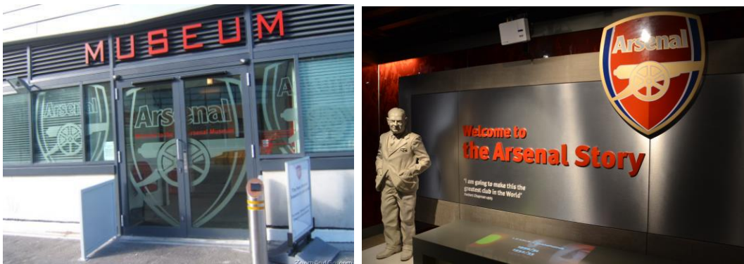
Gambar 4.3. Main entrance dan lobby The Arsenal Museum