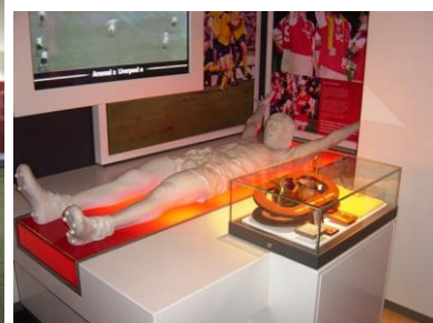
Gambar 4.7. The Arsenal Museum