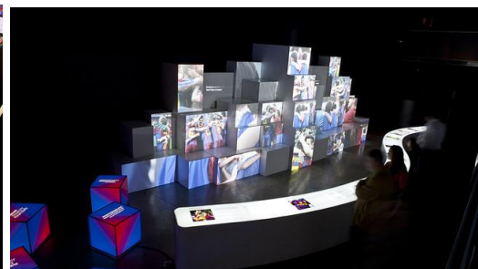
Gambar 4.12. F.C Barcelona Museum