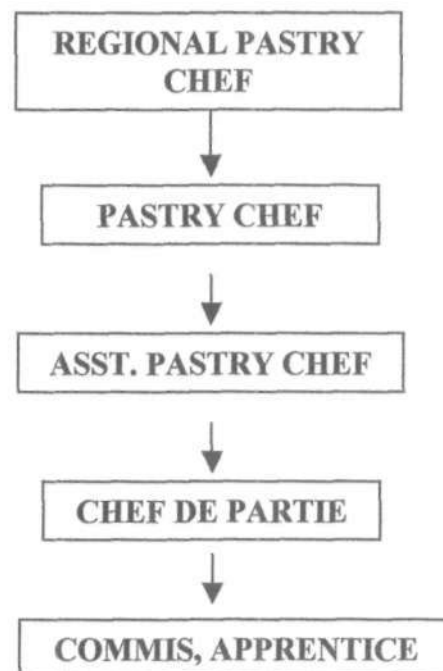
Gambar 4.3. Struktur Organisasi Departemen Pastry