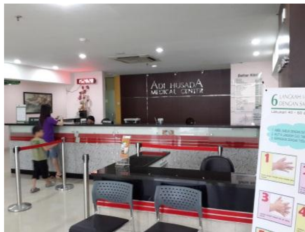
Gambar 4.2. Lobby Rumah Sakit Adi Husada Surabaya

Lobby ini sudah lumayan bagus dikarenakan ukurannya yang besar dan luas tapi ruang tunggu tidak berfungsi maksimal. Gaya modern pada resepsionisnya memberikan nuansa bersih dan profesional.