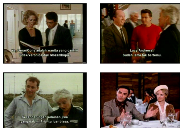
Gambar 4.3 Contoh Cuplikan Movie Mania Suroboyoan

Beberapa contoh gambar dari film-film yang ditayangkan oleh Movie Mania Suroboyoan dapat dilihat pada gambar-gambar di bawah ini. Gambar-gambar di bawah ini dicuplik dari beberapa judul film, seperti Strike of The Panther dan The Bees .