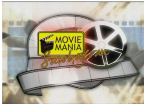
Gambar 4.2 Logo Movie Mania Suroboyoan

sini. Awalnya, Movie Mania Suroboyoan ini bernama Film Suroboyoan yang menayangkan film serial maupun film lepas. Setelah sempat berjalan dengan tayangan dua film serial ( Swordsman dan Love Talks ) dan 10 film Hollywood, Film Suroboyoan berhenti ditayangkan. Pada awal 2007, JTV berniat untuk menggebrak kembali dengan tayangan serupa, namun diadakan pembaharuan nama program dan jenis film yang ditayangkan. Program film yang di dubbing ini disebut dengan Movie Mania Suroboyoan dan hanya menayangkan film lepas (tidak ada lagi film serial). Untuk memfasilitasi produksi film-film dubbing ini, JTV merekrut 45 orang untuk menjadi dubber dan mempersiapkan sebuah studio khusus untuk pelaksanaan proses dubbing .